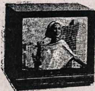
TELEVIZIJOS APARATAI (įvairaus dydžio ir įvairių firmų)

ELECTRONICS 200 5TH AVE (tarp 23 & 24 Gatvių) NEW YORK, N.Y. 10010 TELEFONAS (212) 807 - 8484