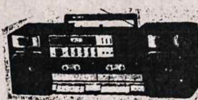
ĮVAIRŪS RADIO APARATAI SU TRUMPOM BANGOM