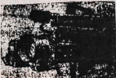
PANASONIC M7 COMCORDER VIDEO FILMAVIMO APARATAI PAL SISTEMAI