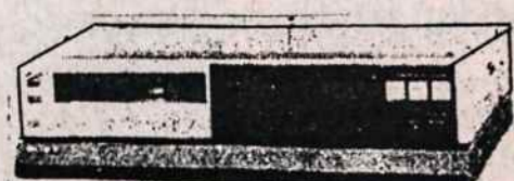
VCR (Video juostų rekordavimo ir grojimo aparatai) PAK/SECAM/DK SISTEMAI (įvairių firmų, įskaitant ir Panasonic)

VISA APARATŪRA TURI PAAIŠKINIMUS IR RUSŲ KALBA