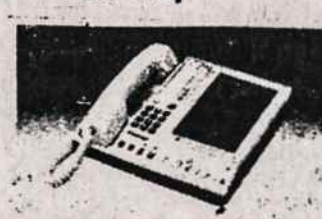
TELEFONŲ ATSAKYO APARATAI