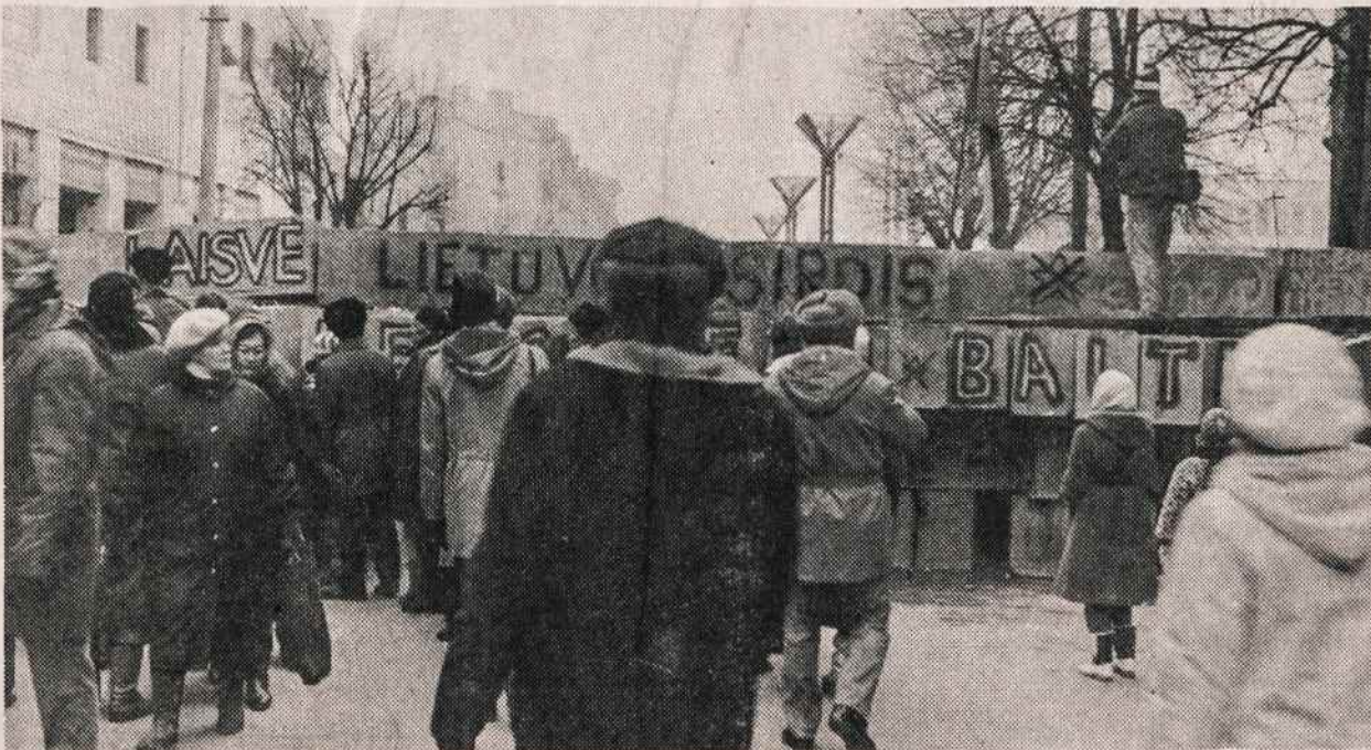
Įėjimas iš Gedimino prospekto į Nepriklausomybės aikštę prie Aukščiausiosios Tarybos rūmų. Barikada "Čia Lietuvos širdis".