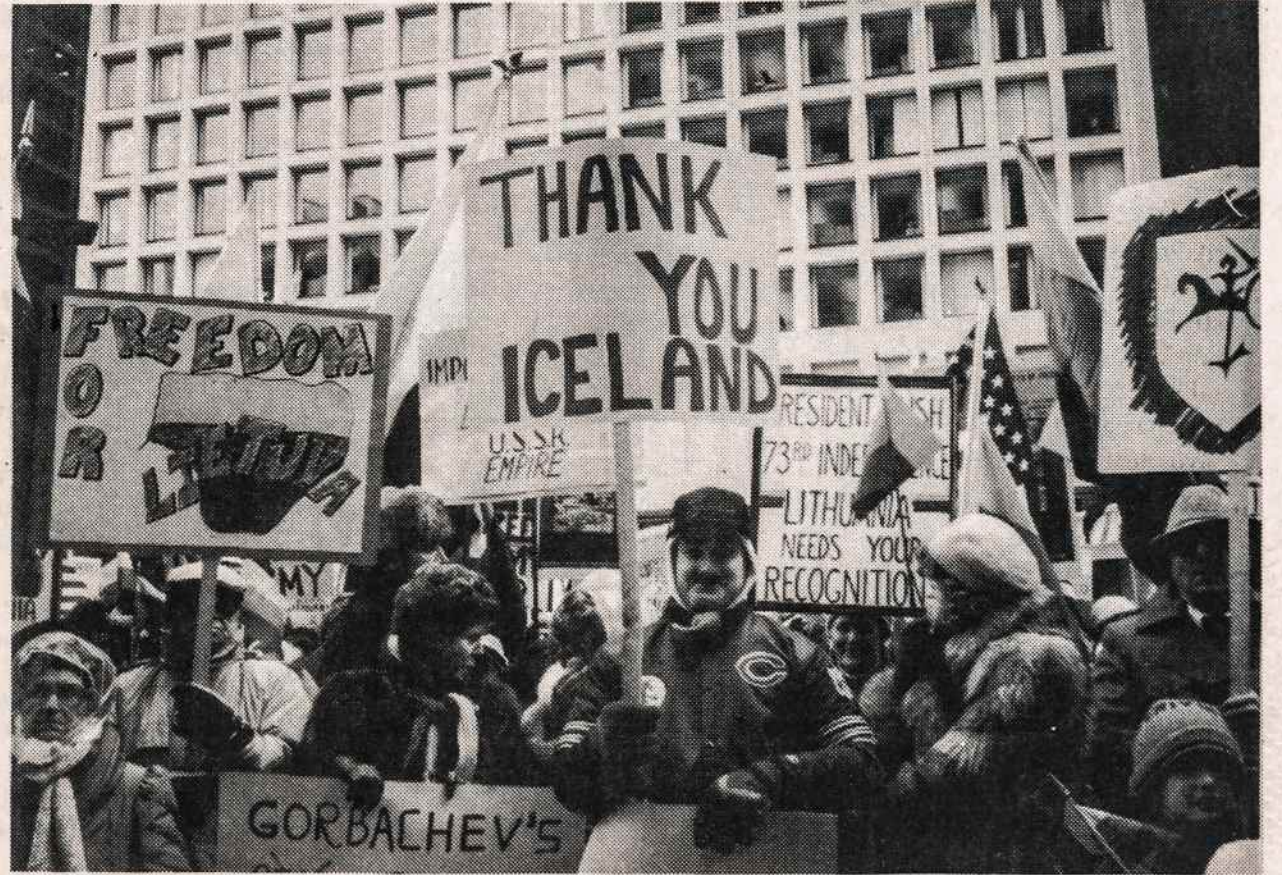
Vaidas iš Lietuvos Jaunimo Sąjungos surengtų demonstracijų Chicagos Daley Plazoje vasario 16. Nepaisant labai šalto oro, susirinko apie 1000 asmenų.