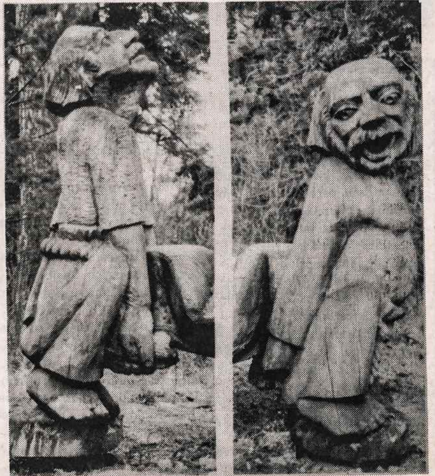
Neringoje — Raganų kalne liaudies meistrų medžio skulptūros.