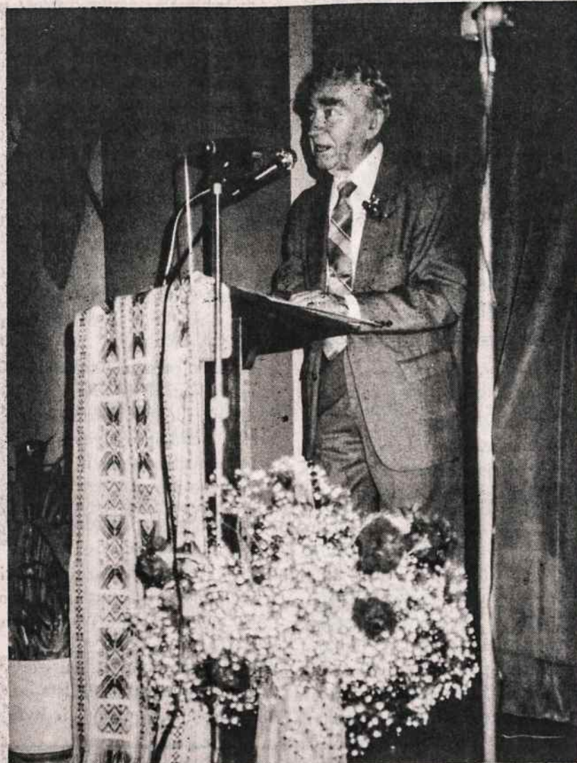
Bernardas Brazdžionis kalba savo 80 m. sukakties pagerbime Los Angeles, Calif. Poetas, Lietuvos Kultūros ir švietimo ministerijos kviečiamas, gegužės pradžioje vyks į Lietuvą ir su savo kūrybos vakarais lankys Lietuvos gimnazijas.