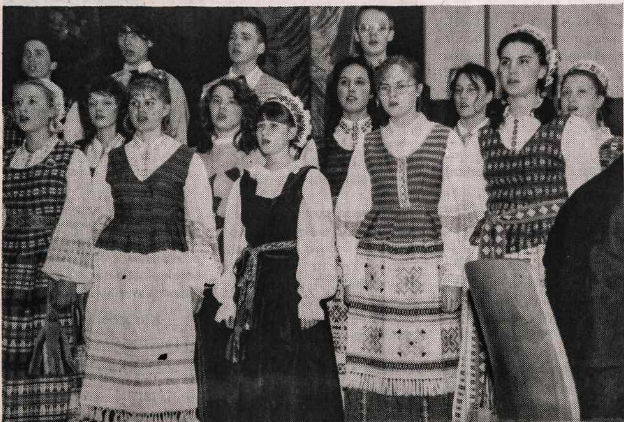
Vasario 16 gimnazijos mokiniai dainuoja Lietuvos nepriklausomybės šventės minėjime Hüttenfelde.

— ELTA, Lietuvos telegramų agentūra, reorganizuota, pavadant jai vykdyti ir Vyriausybės informacijos tarnybos funkcijas. Direktoriumi paskirtas Vidmantas Putelis.