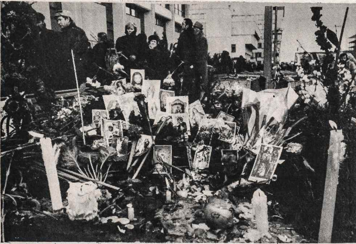
Vilniuje prie Aukščiausiosios Tarybos rūmų budima ir meldžiamasi.