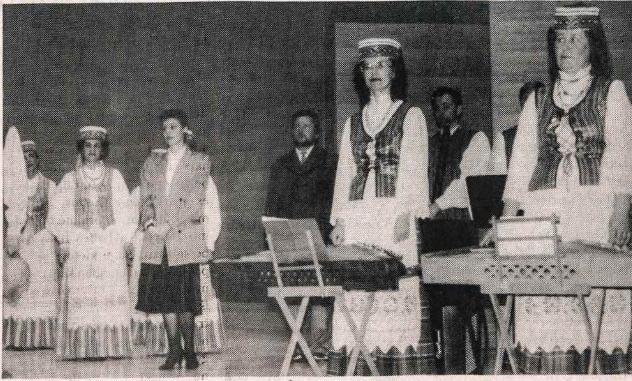
Panevėžio liaudies dainų ir šokių ansamblis "Ekranas" atliko programą balandžio 7 Clevelando valstybiniame universitete.

Vysk. Žemaitis kelionę Amerikoje koordinuoja Lietuvių Katalikų Religinė Šalpa. Telef. 718 647-2434.