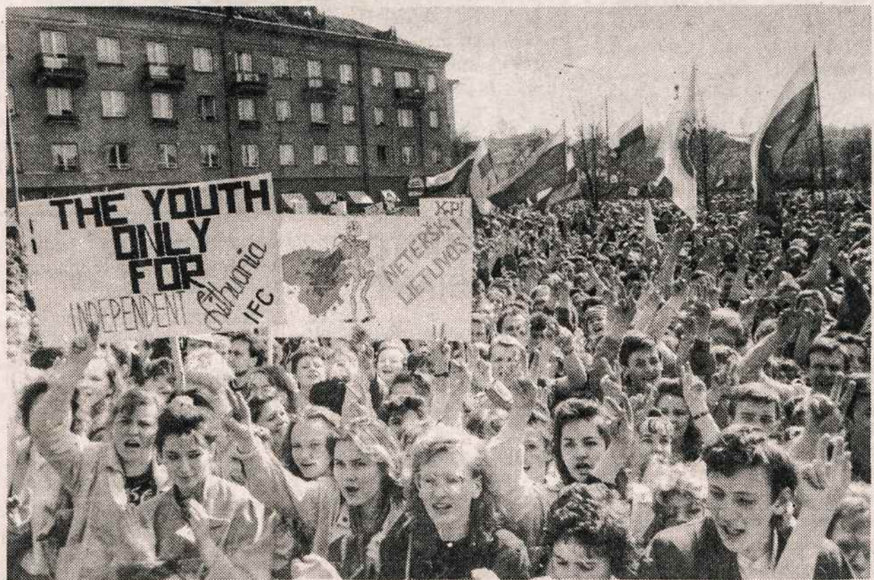
Lietuviai studentai demonstruoja Vilniuje už Lietuvos nepriklausomybę.

Ši infliacija Lietuvai nieko gero nežada.