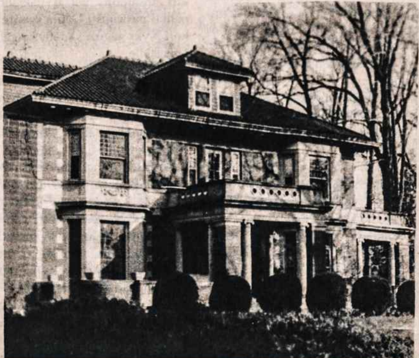
Pranciškonų vienuolynas Brooklyne, sujungta senoji statyba su naująja.

Tačiau netrukus po Lietuvos pavergimo išėivijoje padėtis pasikeitė.