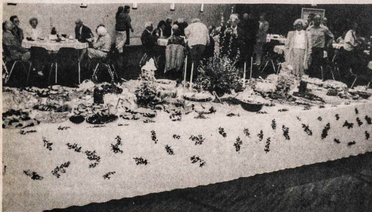
LMK Federacijos New Yorko klubo parengtas Atvelykio stolas Kultūros Židinyje balandžio 7.