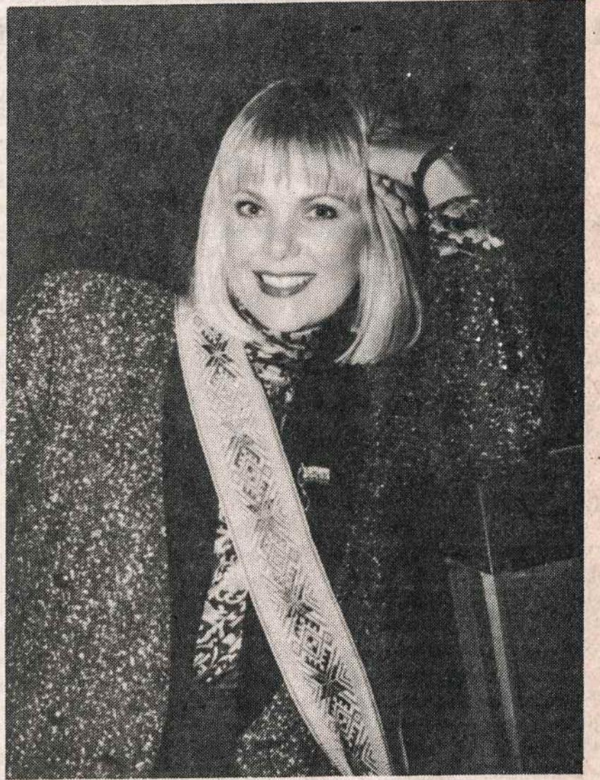
Filmų ir televizijos artistė Ann Jillian — Jūratė Nausėdaitė 1990 spalio 26 Atlantic City, NJ, paminėjo 30 metų teatro veiklos sukaktį iškilniu koncertu. Lietuvos Vyčių 26 kuopos atstovai ją apdovanojo lietuviška juosta. Iškilioji artistė vadovauja lietuvių dainų šventei, kuri įvyks gegužės mėn. Chicagoje.