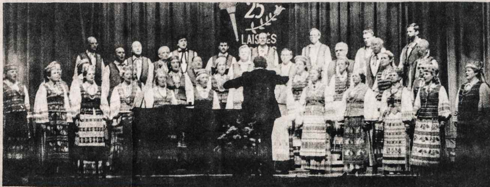
Čurlionio ansamblis dainuoja Kultūros Židinio scenoje balandžio 20, minint Laisvės Žiburio radijo 25 metų sukaktį. Nuotr. V. Maželio

Latviją prezidentui pritariant. Be Lietuvos ir Latvijos, Lugar kelionė apima dar 6 šalis, įskaitant Lenkiją ir Čekoslovakiją. (LIC)