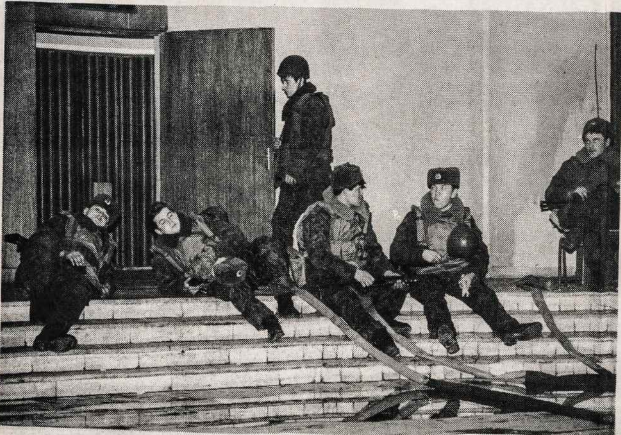
Sovietų vidaus reikalų ministerijos daliniai prie Spaudos rūmų sausio 17. Okupavę juos sausio 12-ąją, jie ne tik nesidangina iš Lietuvos, bet palaipsniui užiminėja ir naujus pastatus kituose respublikos miestuose.