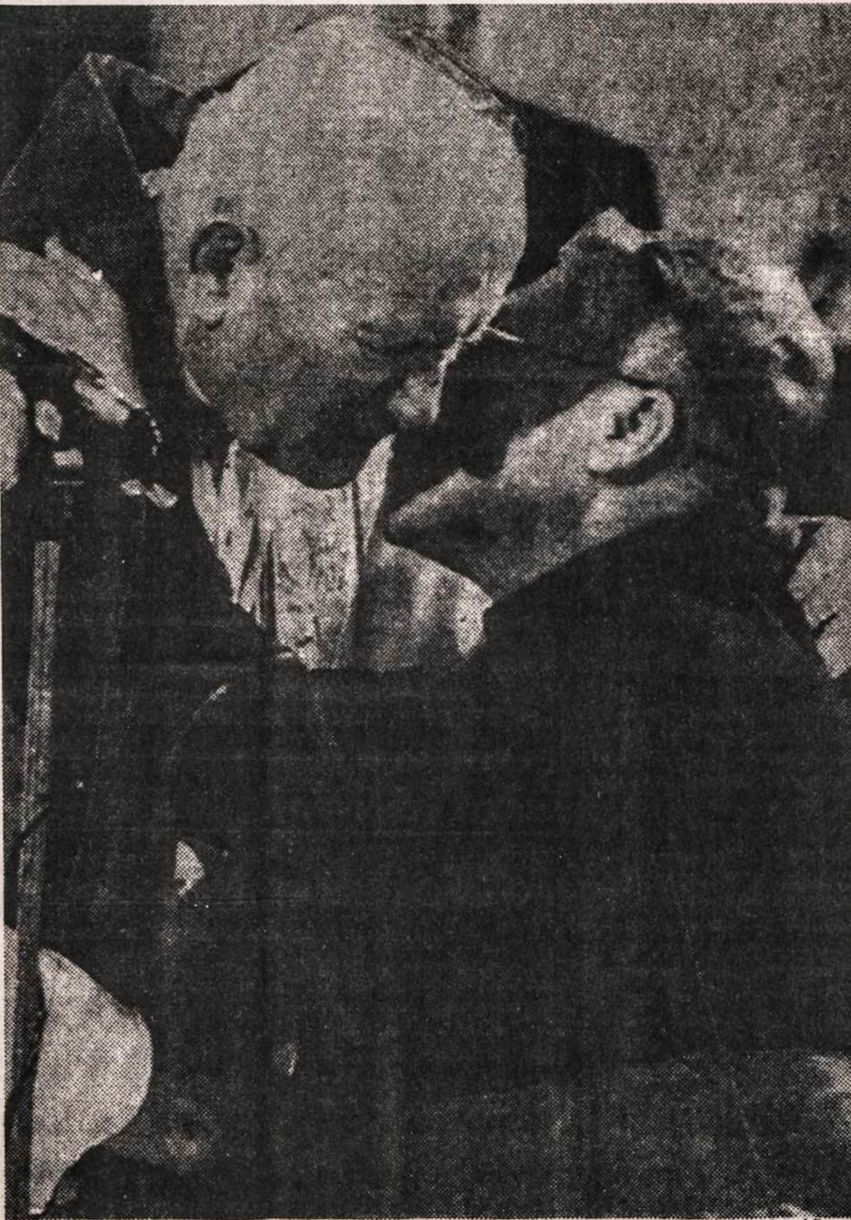
Šv. Tėvas Jonas Paulius II birželio 5 Lomžoje sveikina su Lietuvos kardinolu Vincentu Sladkevičiumi.

Maskvos valdininkų nuomone, politinė situacija Lietuvoje ir vyriausybės "ekstremistiniai polinkiai", — kaip jie sako, — neleidžia saugiai plėsti atominės energetikos. Todėl nutarta nestatyti naujų atominų elektrinių Lietuvoje.