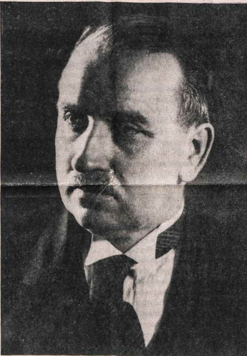
Prof. Pranas Dovydaičis