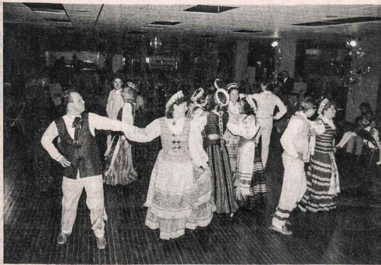
Hartfordo tautinių šokių grupė "Berželis" savo metiniame koncerte balandžio 20 šoka Tryptinį.