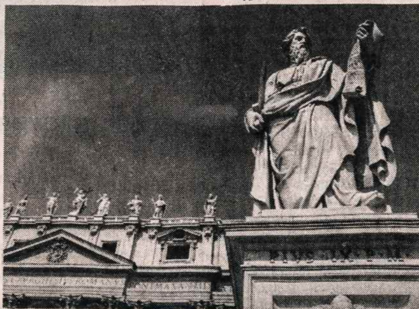
"Taigi Kristus vietoje einame pasiuntinių pareigas... Kristus vardu maldaujame: 'Susitaikykite su Dievu' (2 Kor 5, 20). Tautų apaštalo statula Šv. Petro bazilikos aikštėje.