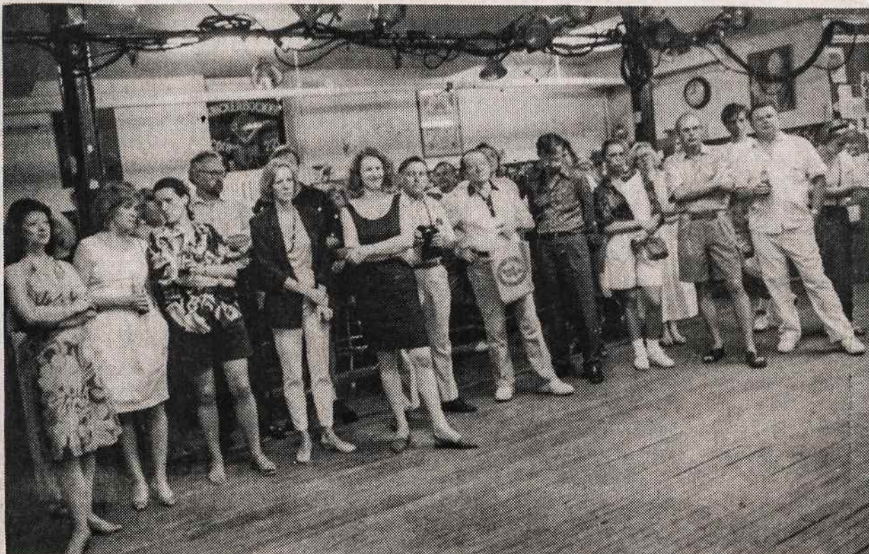
Aktorių susitikimas su New Yorko lietuviams Aušros Vartų parapijos salėje birželio 17.