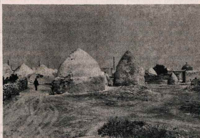
Sirijos dykumos miestelio vaizdas: Tell-Mardih, netoli senosios Eblos piliakalnio.

Mano kambarys į šiaurę pusę. Iš ten pamazėle, bet vis ryškiau ir drąsiau švyti aušra. Damaskas — seniausiam ir nuolat gyvenamam Žemės mieste nelengva užmigti. Paryčiu — smagus laikas, nes vėsu. Langai atviri. Girdžiu žmones bendraujant prie arbatos stiklo viešbučio kieme. Kitoje gatvės pusėje — stadionas. Ankstyvas bėgikas miklina kojas.