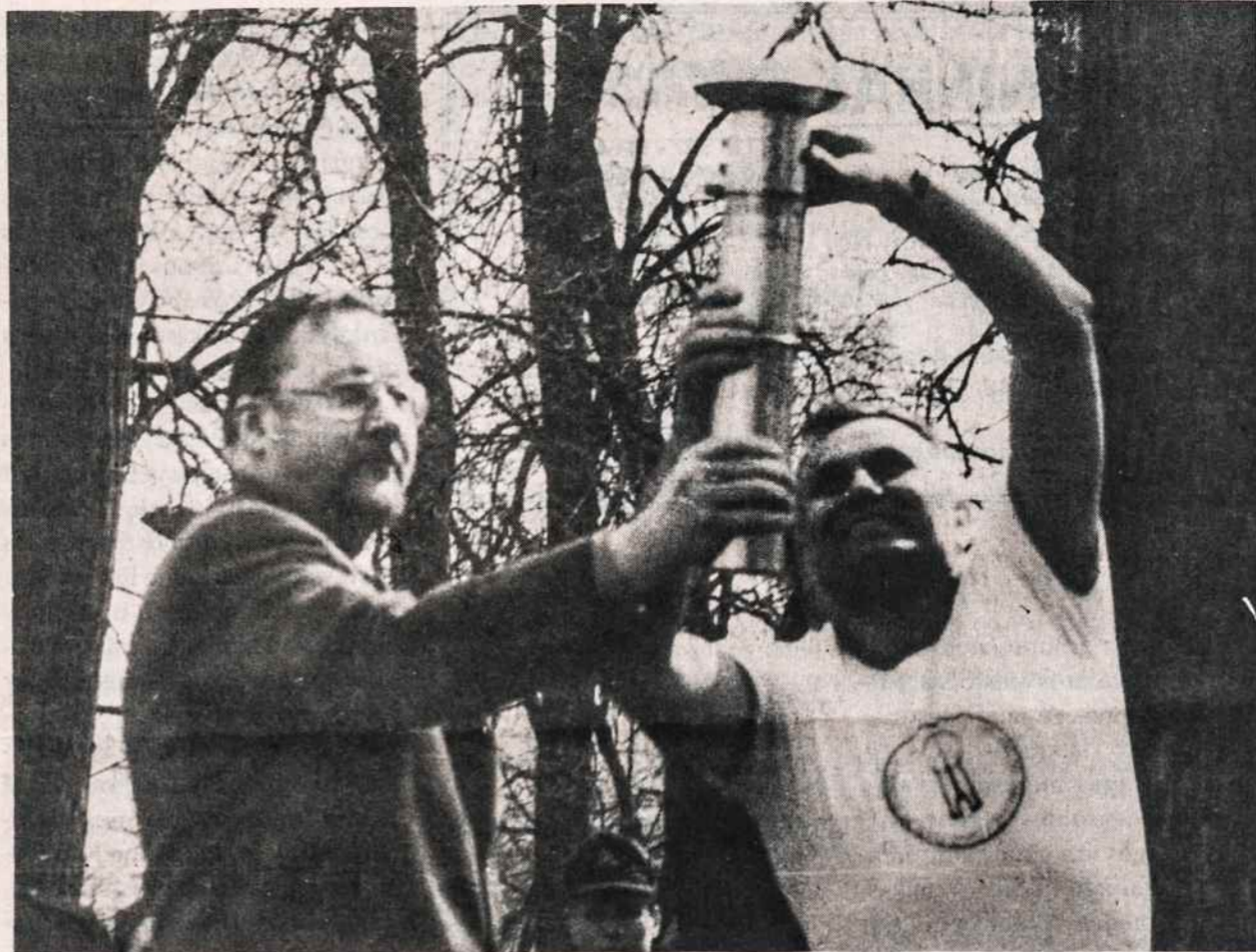
Lietuvos Aukščiausiosios Tarybos pirm. prof. Vytautas Landsbergis, prieš išskrisdamas diplomatinėn kelionėn į JAV, balandžio 28 uždegė Pasaulio lietuvių sporto žaidynių ugnį senuosiuose Trakuose.

Dar neteko skaityti ir girdėti iš kairės aliaruojančio riksmo