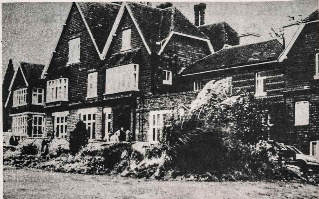
Lietuvių sodyba — Headley Park, 47 mylios nuo Londono, Anglijoje. Sodyba turi 23 hektarus žemės, tinka vasarajimui, suvažiavimams, poilsiui. Sodybos žemėje yra ežeriukas ir teka upelis

Kazimieras Barėnas. Meškos maurojimo metai . Romanas. Spaudė Draugo spaustuvė Chicagoje. Kaina 15 dol. Gaunama Ateities Literatūros Fonde , 409 — 50th Pl., Western Springs, IL, 60558.