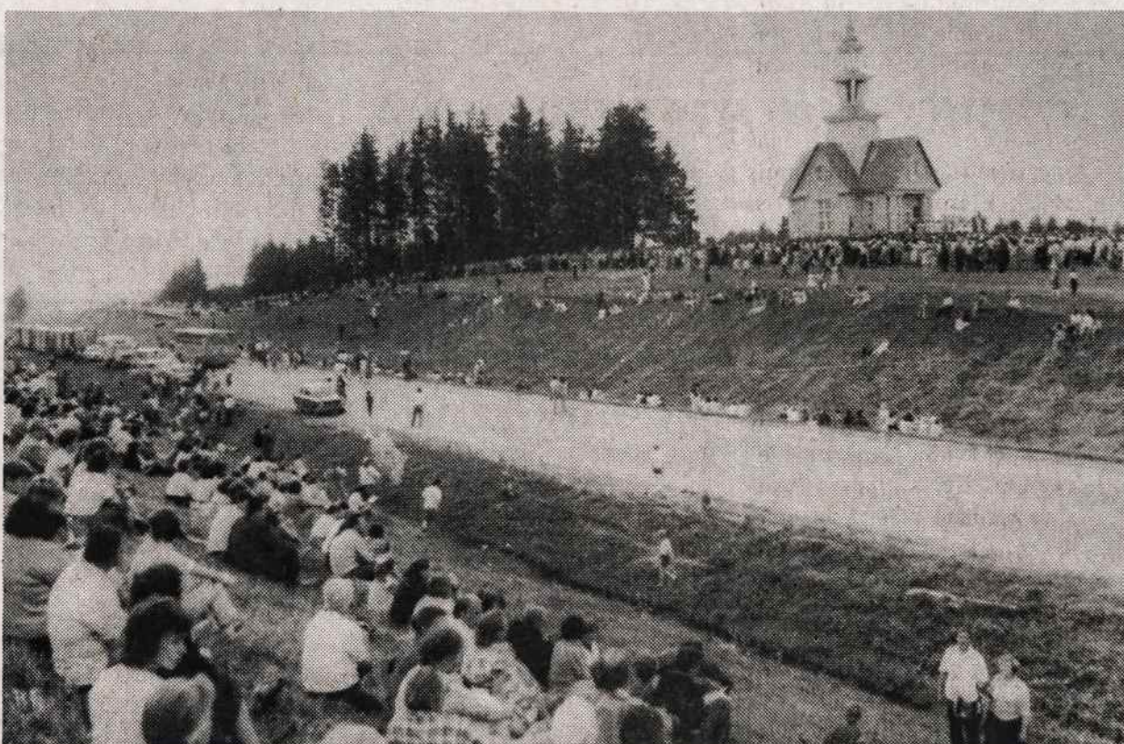
Prie Rainių miškelių pastatyta koplyčia kankiniams atminti. Pašventinta birželio 23. Šventinimo dieną suvažiavo žmonės autobusais pagerbti 73 kankinius, bolševikų nukankintus prieš 50 metų.