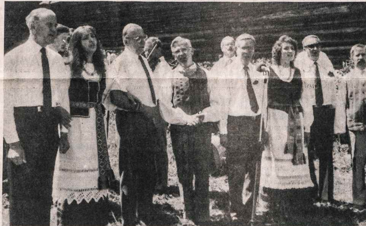
Los Angeles vyrų kvartetas ir "Armonikos" ansamblis koncertuoja Trakų pilyje.