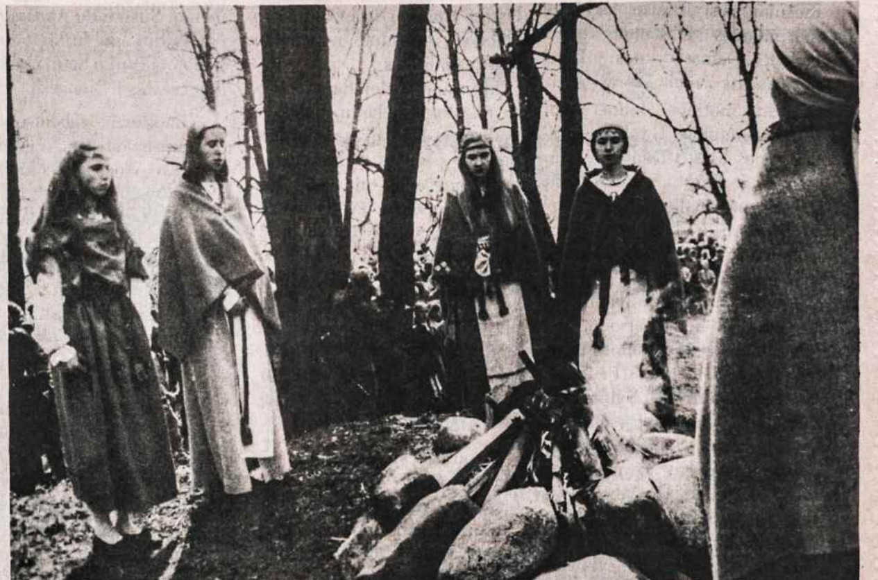
Senieji Trakai. Išklmės Gedimino jubiliejinių metų pradžioje — 1991 balandžio 28.

Tokia, deja, realybė. Valdas Aneliasukas, LLL narys