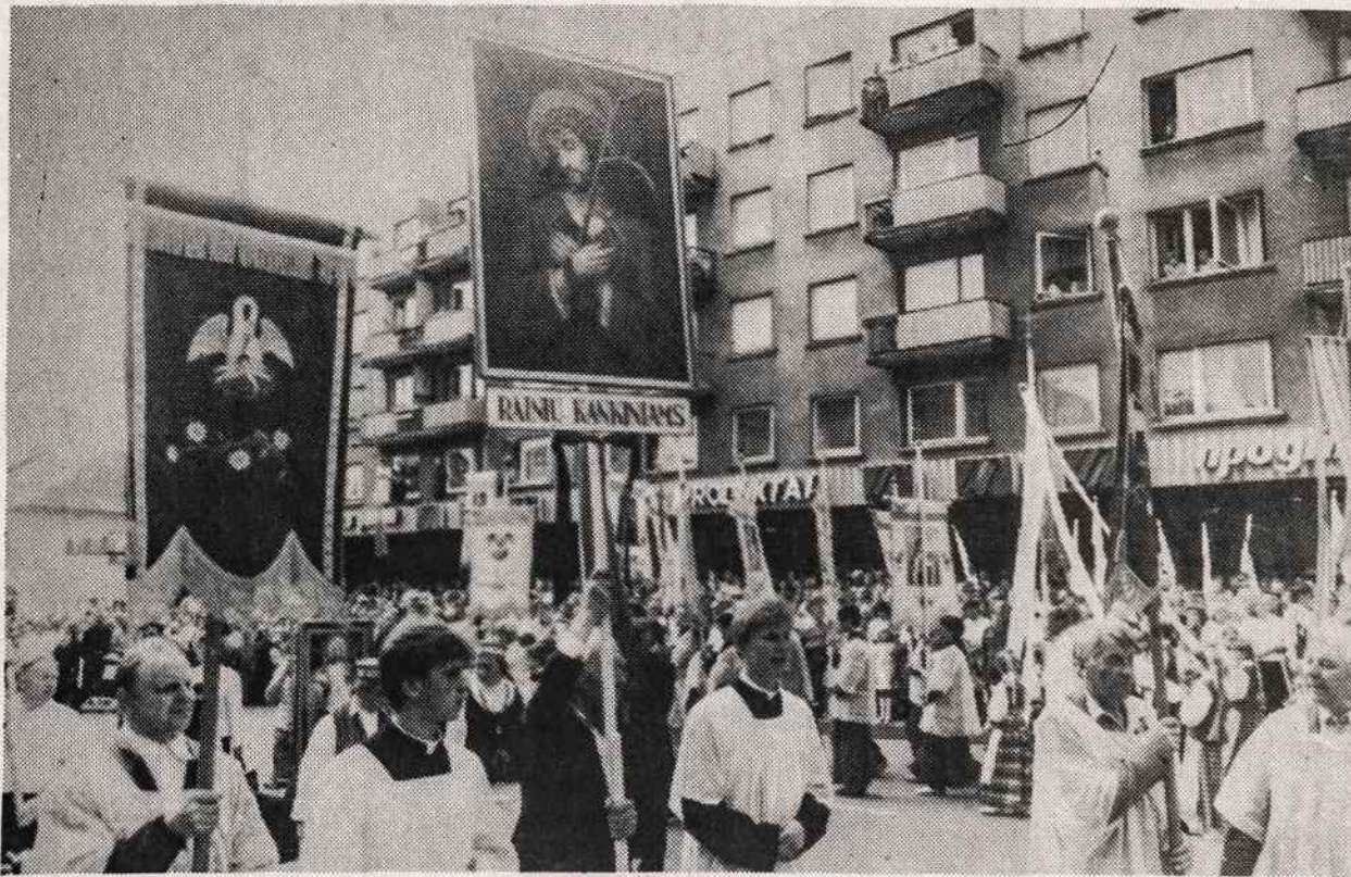
Procesija birželio 23 iš Telsių į Rainių miškelį.