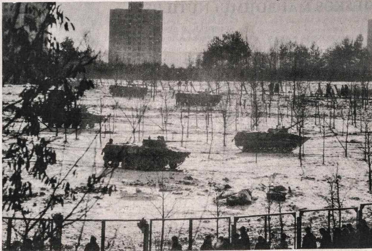
Sovietų tankai "gastroliauja" Vilniuje.

Savo rašinį ministras Meri baigia fraze, kuri tinka ne tik Estijos-JAV ekonominiams ryšiams, bet ir visam Pabaltijui, nes panašią sutartį su JAV yra pasirašiusios ir Lietuva bei Latvija. Jis sako: "Būdami dėkingi Amerikai už Pabaltijo aneksijos nepripažinimą, nerimstame, kad toji nepripažinimo politika, kaip ji dabar galėtų būti pritaikyta ekonominių lengvatų sutarties atveju, netaptų veikianti prieš Estijos tautinius interesus".