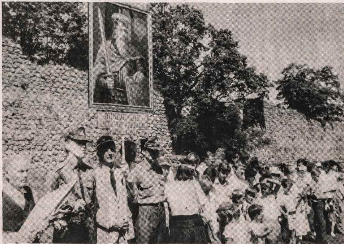
Vaizdas iš Lietuvos Valstybės šventės pirmojo minėjimo liepos 6 d. Medininkuose, prie Mindaugo pilies griuvėsių. Čia buvo pabrėžta, kad karalius Mindaugas jau daugiau kaip prieš 700 metų Lietuvą įjungė į Vakarų Europą. Patriotinės jaunimo organizacijos — Mindaugiečių — atstovai stovi garbės sargyboje prie Mindaugo paveikslo.