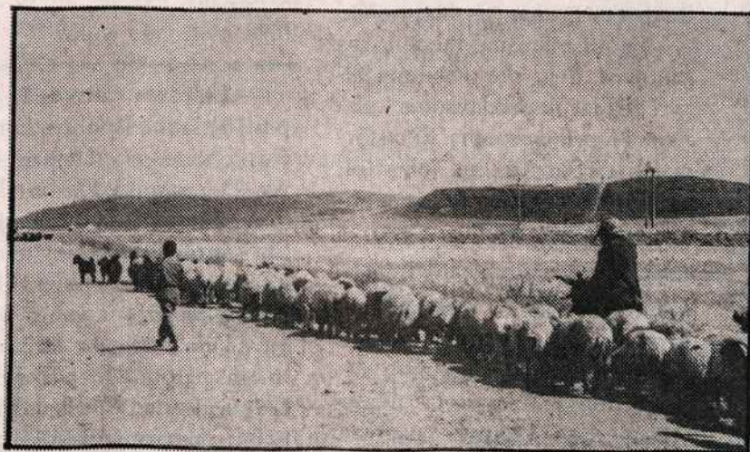
Skerdžius gano avis ir ožkas, jodamas ant asilo. Fone Eblous piliakalnis.

Keliauti vienam yra įdomiau, negu grupėje. Mat reikia pačiam viską susirasti. Užėnu į Damasko turizmo centrinę įstaigą. Paprastai tokiose įstaigose gali pasirinkti ir žemėlapių ir pasiklausti kelio. Deja, centrinė Damasko turizmo įstaiga turi tik dalinį Damasko žemėlapi. Tarnautoja paslaugi ir pataria nueiti į netolimą knygyną. "Gal", — sako. — "ten rasite detalų ir tikslių žemėlapi". Deja. Sirai nemėgsta spausdinti miestų ar krašto žemėlapių turistams. Sakoma, kelio galas ant liežuviu! Nūdien "Tiesioji gatvė" turi kitokį vardą: Souk Madhat Bacha — Madhat Bacha dengta prekyvietė. Žemėlapiu nešinas, kulniuojau per senamiesčio labirintą į Tiesiąją gatvę.