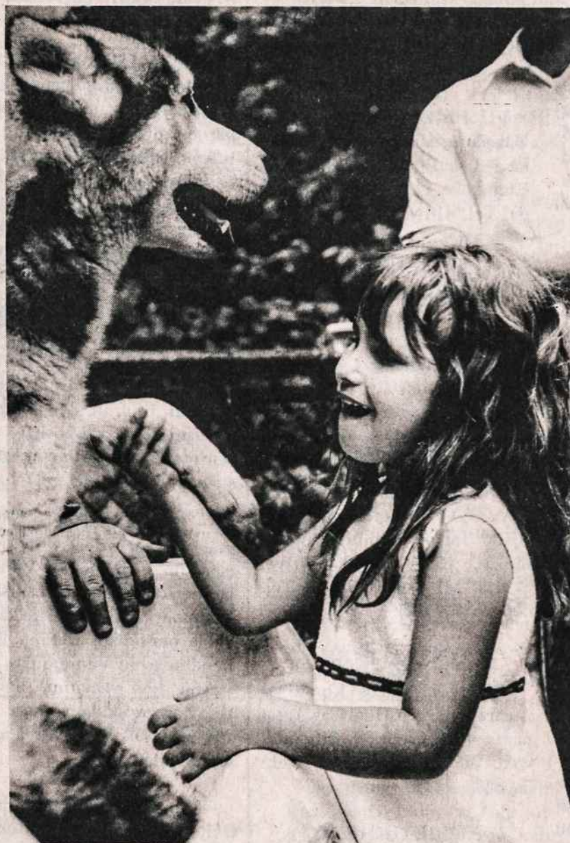
Jauna gamtos mylėtoja Bronzo zoologijos sode rado bičiulį.

Lenkijos ir Latvijos vyriausybės reiškia pasiryžimą išplėsti tarpusavio bendradarbiavimą ekonomikos, mokslo ir technikos srityje, taip pat gamtos apsaugojimo plotmėje, įsipareigoja sudaryti sąlygas savo pilečiam laisvai keliauti tarp abiejų kraštų. Artimiausiu laiku Varšuvoje bus atidaryta Latvijos prekybos atstovybė.