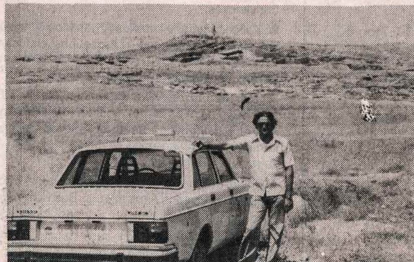
Valstybinė automašina su vairuotoju turistui iš užsienio. Fone Eblės piliakalnio šonas.