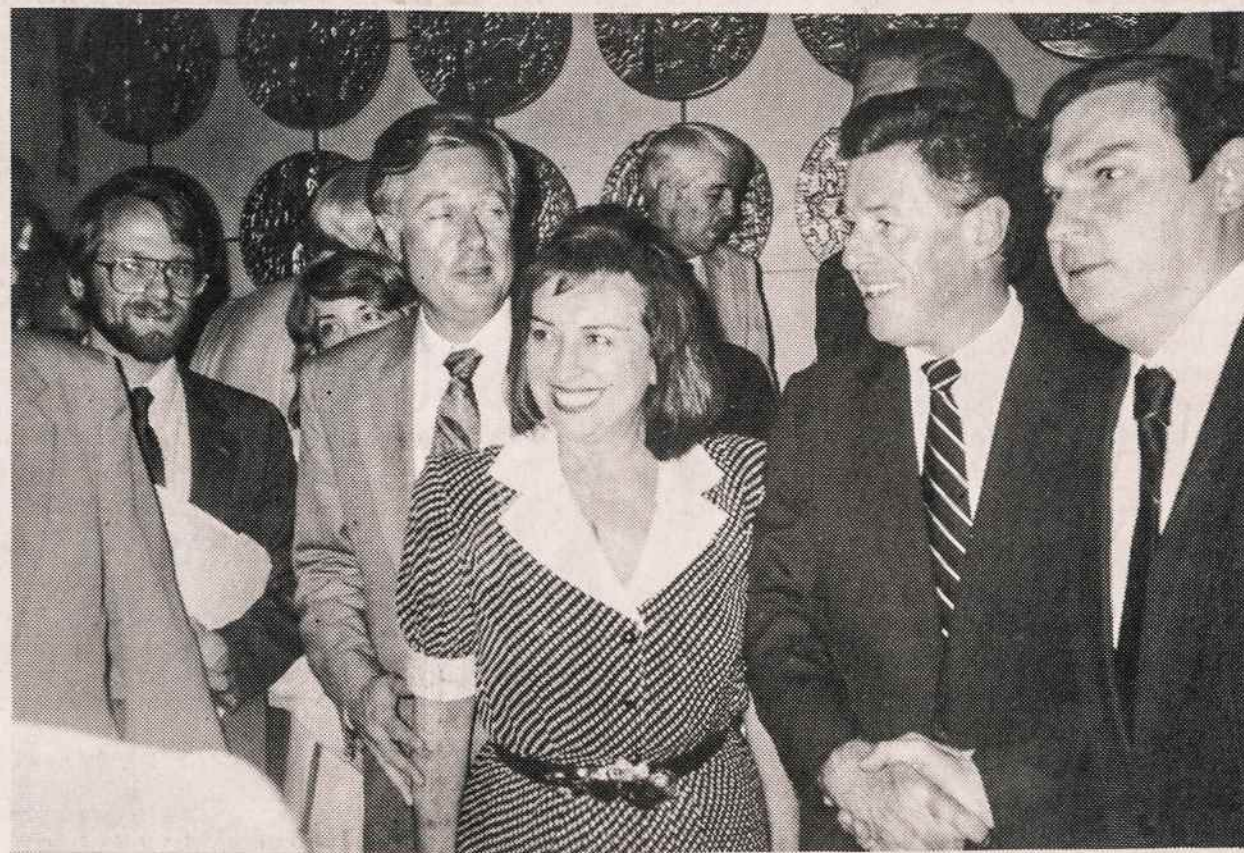
New Jersey gubernatorius Jim Florio (antras iš dešinės) tarp etninių grupių atstovų.

nalūs, neturi šiuo metu jokio kito atitiktens Lietuvoje. Muzika, scenografija, apšvietimas, režisūra sukuria ypatingai palankią atmosferą poetinio žodžio skambėjimui.