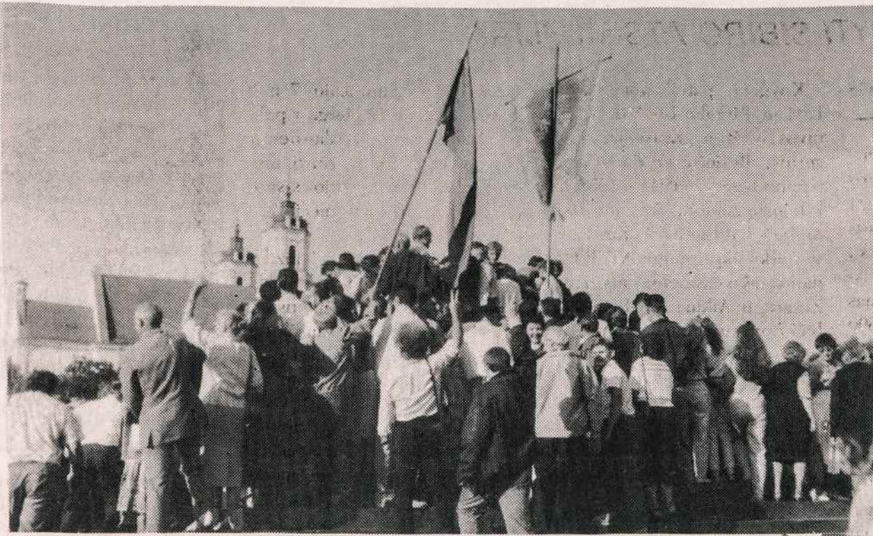
Vietoje, kur iki rugpjūčio 23 stovėjo Lenino statula, Vilniuje demonstruoja entuziastingas jaunimas. Toliau matyti Šv. Jokūbo bažnyčia.

Rašoma, kad daugiausia, keletas šimtų lietuvių buvę susirinkę prie savo parlamento Vilniuje, o Estijoje nedidelė minia sveikinusi jį netoli estų parlamento, kur skersai gatvę tuo metu vyko