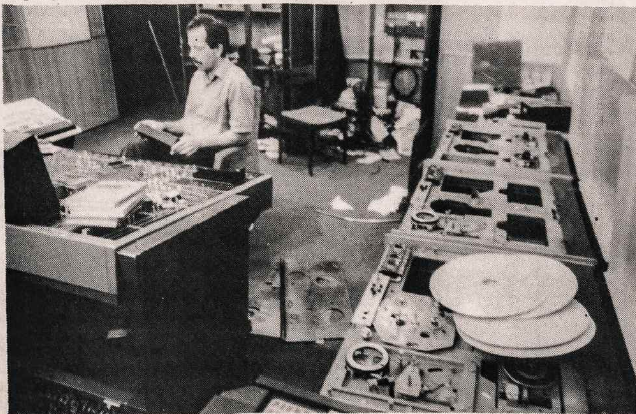
Lietuvos televizijos bokšto viduje, okupanto siautėjimui praėjus.