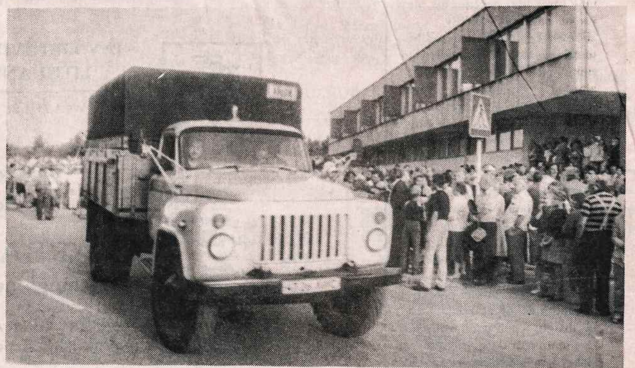
Iš televizijos bokšto patalpų Vilniuje pasitraukia Raudonoji Armija.