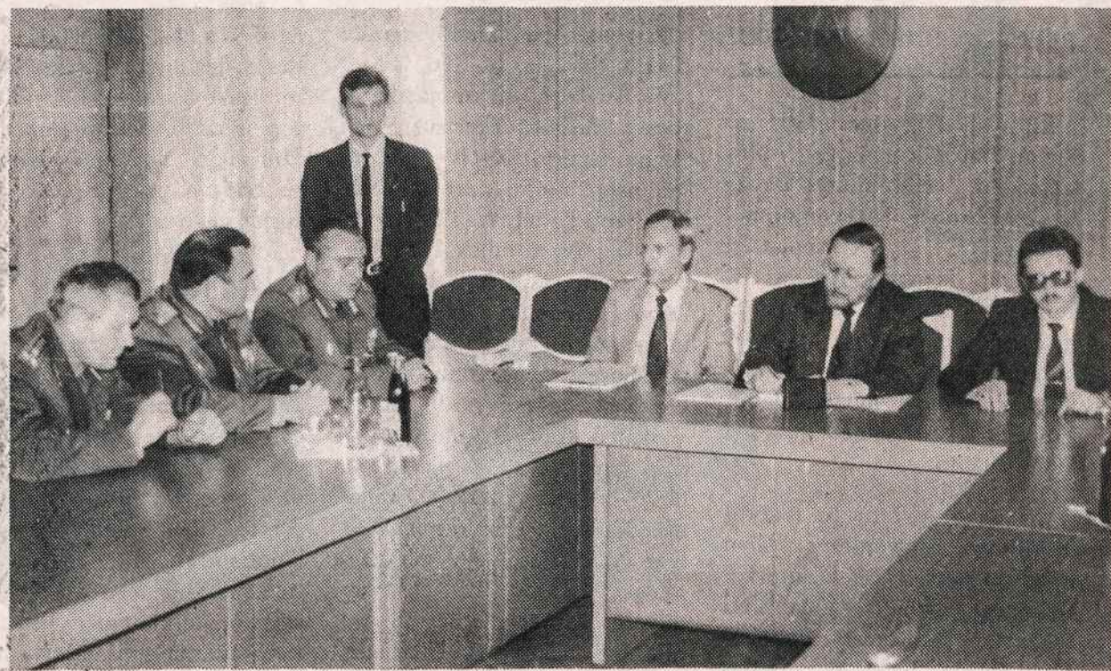
Lietuvos Aukščiausiosios Tarybos pirmininko Vytauto Landsbergio derybos su SSSR kariuomenės karininkais.

bertone, yra tarsi pakartoti gaivų laisvės pažadų kursą".