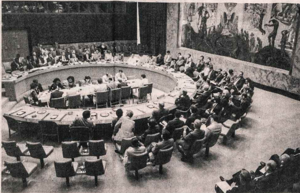
Bendras vaizdas iš JT Saugumo Tarybos rugsėjo 12 d. posėdžio, kuriame nutarta rekomenduoti Generalinei Asamblėjai, kad priimtų Estiją, Latviją ir Lietuvą į Jungtines Tautas. Dešinėje kampe matyti siluetai Pabaltijo valstybių diplomatų, kurie dalyvavo tame posėdyje kaip stebėtojai.

Vatikano dienraštis primena, kad Apaštaly Sostas niekad nepripažino Lietuvos ir kitų Pabaltijo šalių aneksijos, dėl to visą okupacijos metą nebuvo panaiškinta prie Vatikano akredituotoji Lietuvos atstovybė, kuri ir dabar tebeveikia.