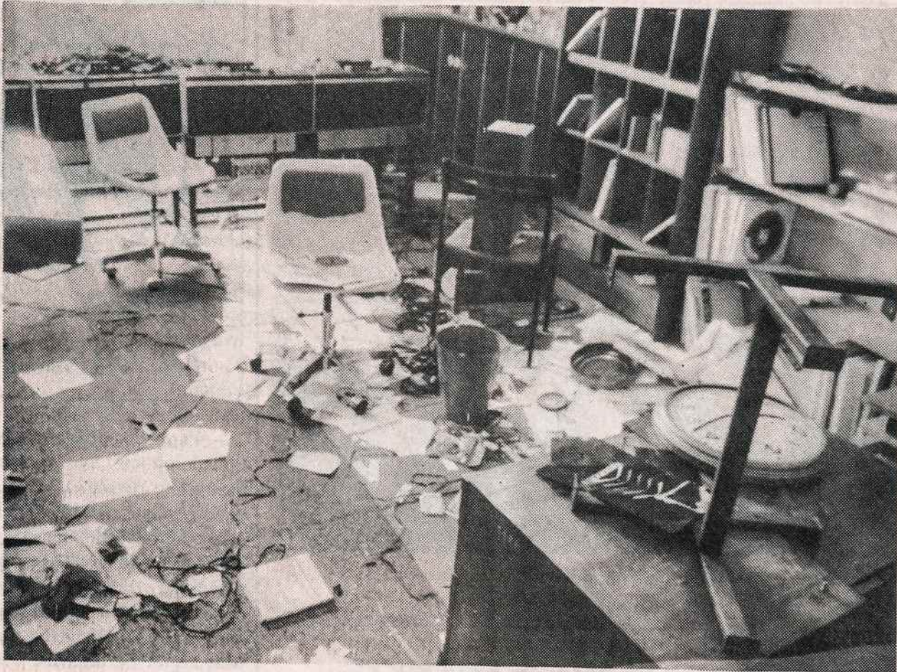
Okupantai, pasitraukdami iš televizijos bokšto, patalpas paliko tokiame stovyje.