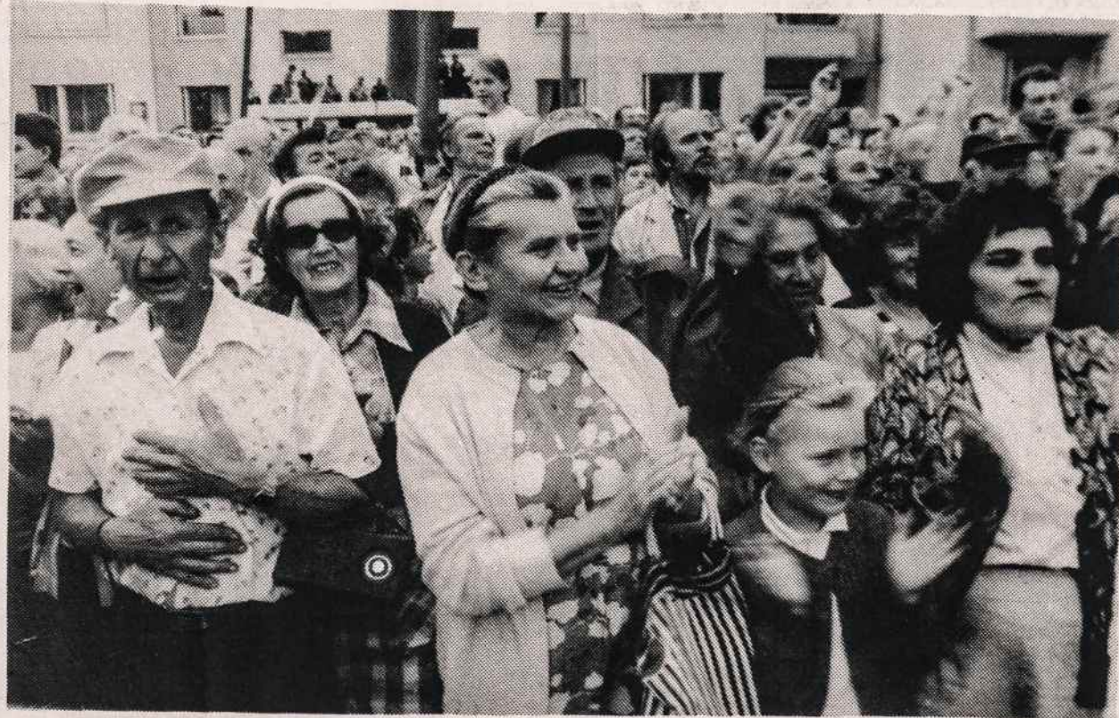
Džiaugsmo demonstracijos Vilniuje rugpjūčio 23.