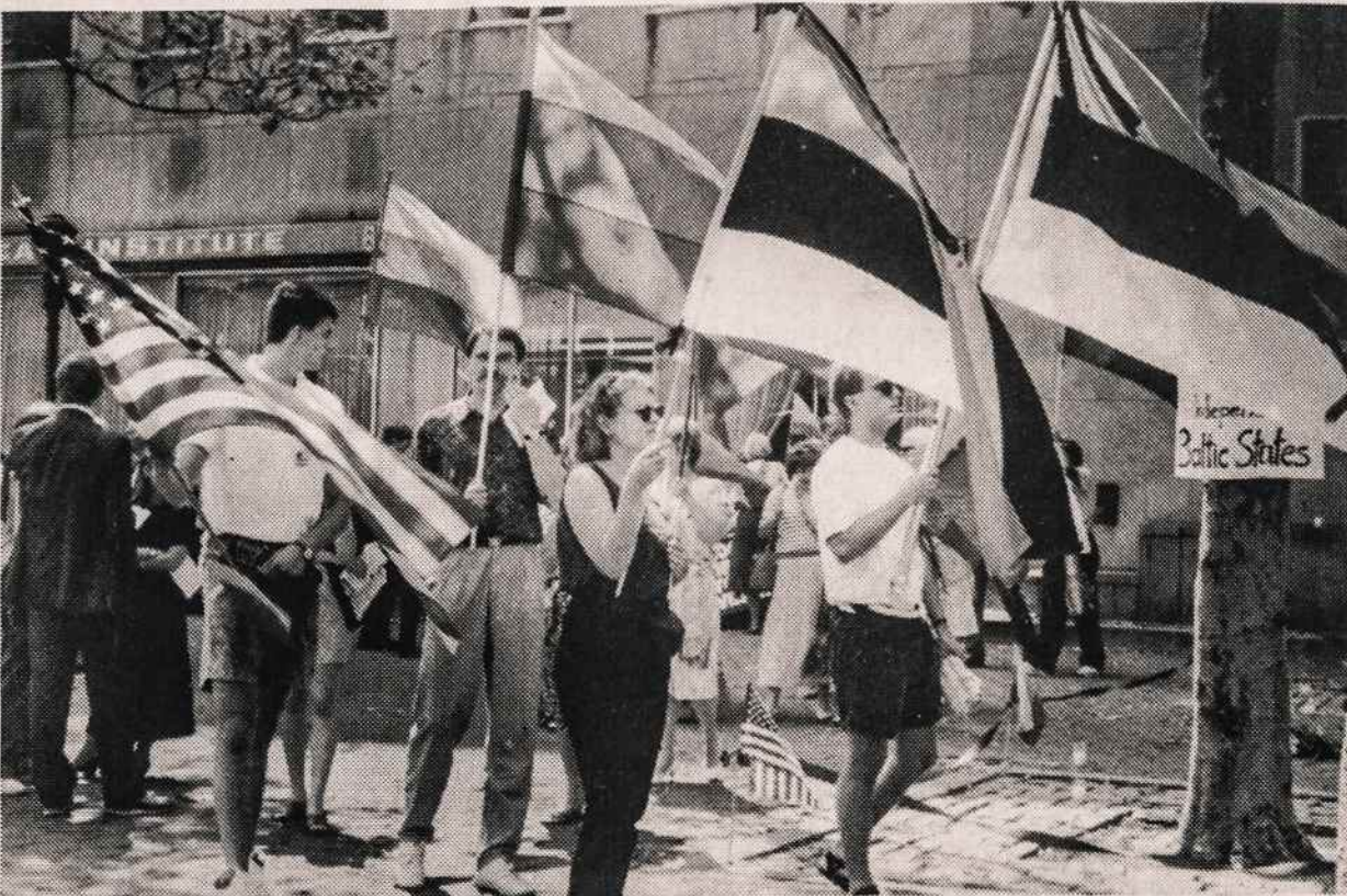
Pabaltiečių jaunimas demonstruoja rugpjūčio 23 New Yorke, prie Jungtinių Tautų, Juodojo kaspino dienos progą.