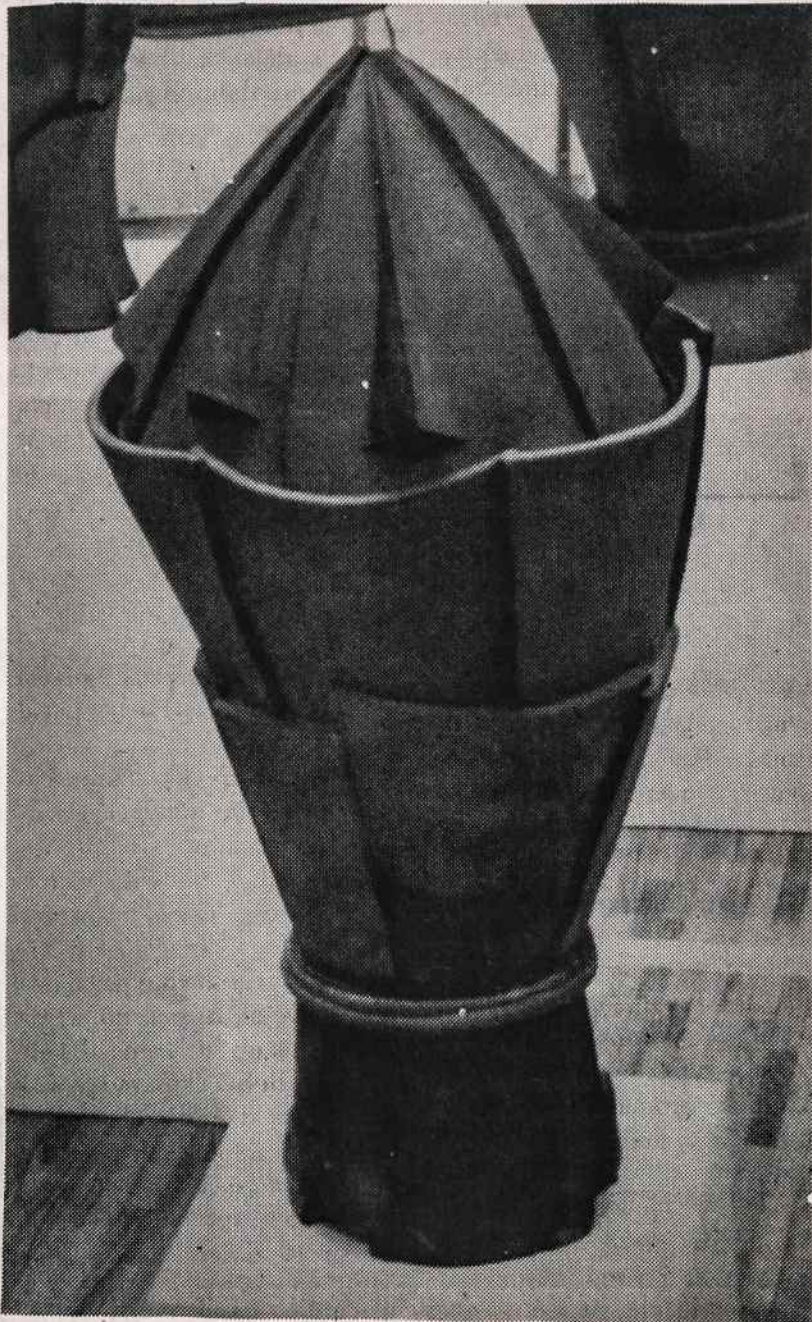
Petro Vaškio dekoratyvinė vaza, šamotas.

Tapyba atlikta aliejumi. Abu paveikslai vaizduoja pajūrio temas, kurios traktuojamos impresionistiškai. Pažymėtina, kad pirmasis jo paveikslų planas yra