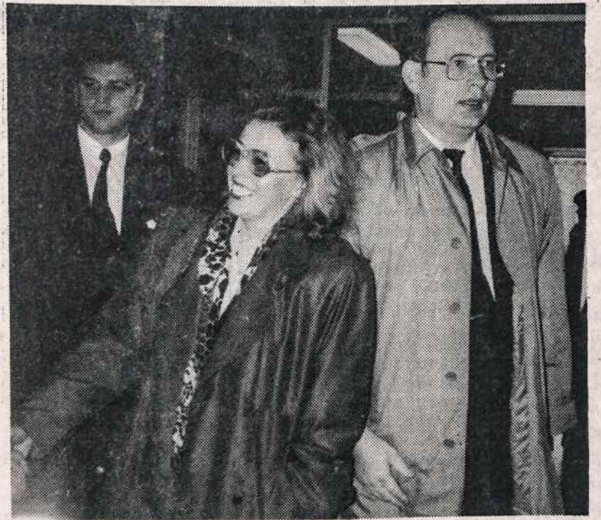
Lietuvos premjeras Gediminas Vagnorius su žmona atvyksta į Vliko seimo posėdžius Chicago Jaunimo Centre lapkričio 2 d.