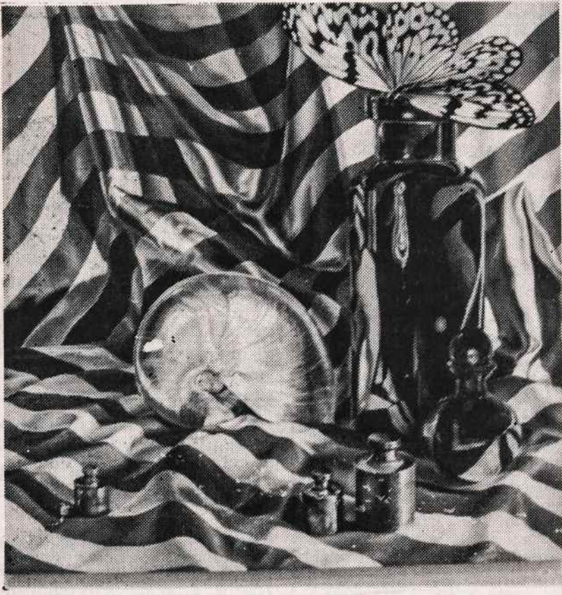
Dail. Giedrės Montvilienės "Amerikana", aliejus.