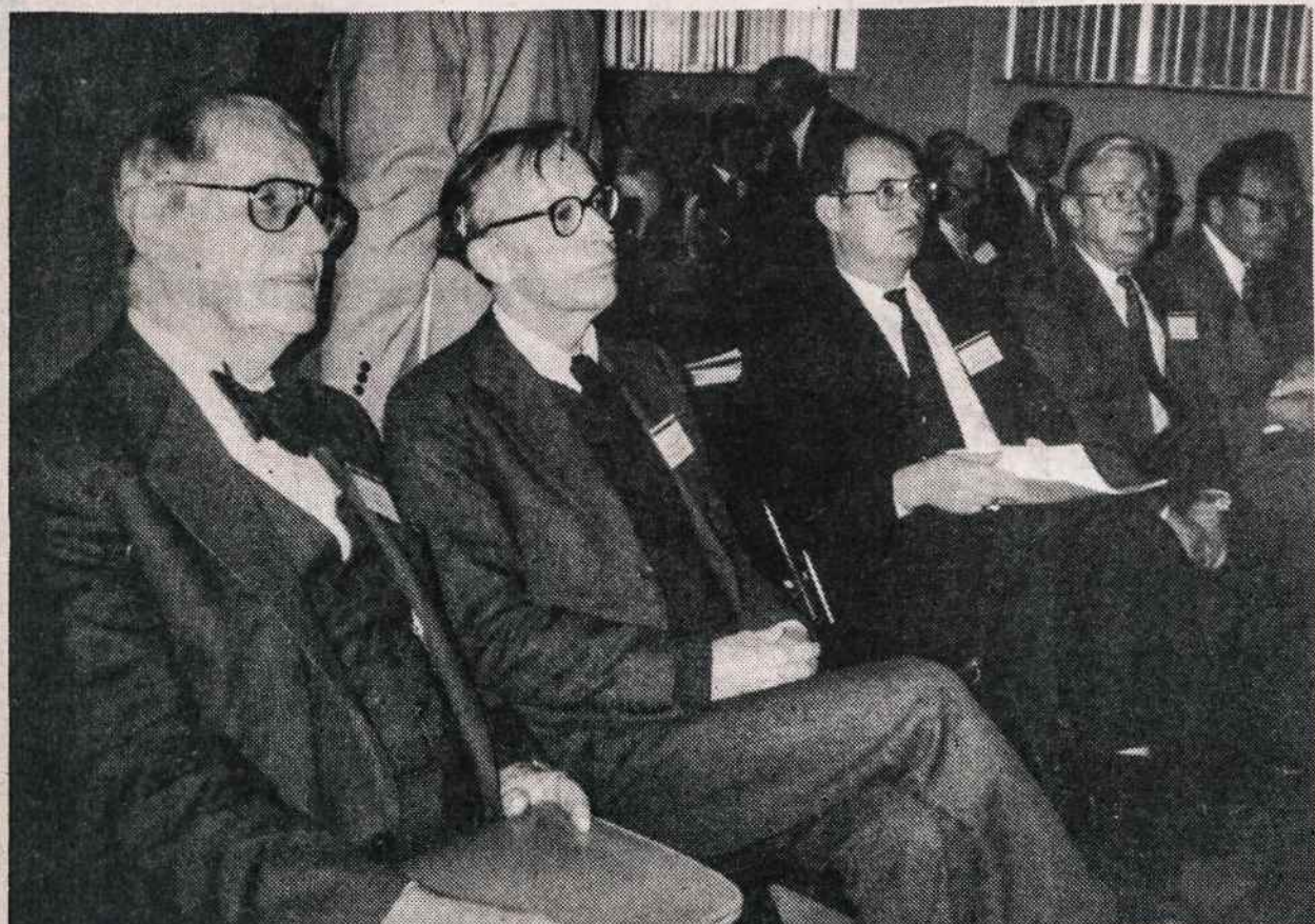
Vaizdas iš VLIKO baigiamojo seimo Chicagoje lapkričio 1 - 3 dienomis. Iš k.: Lietuvos ambasadorius Jungtinėse Tautose Anicetas Simutis, Lietuvos ambasadorius JAV Stasys Lozoraitis, Lietuvos premjeras Gediminas Vagnorius, VLIKO pirmininkas dr. Kazys Bobelis.