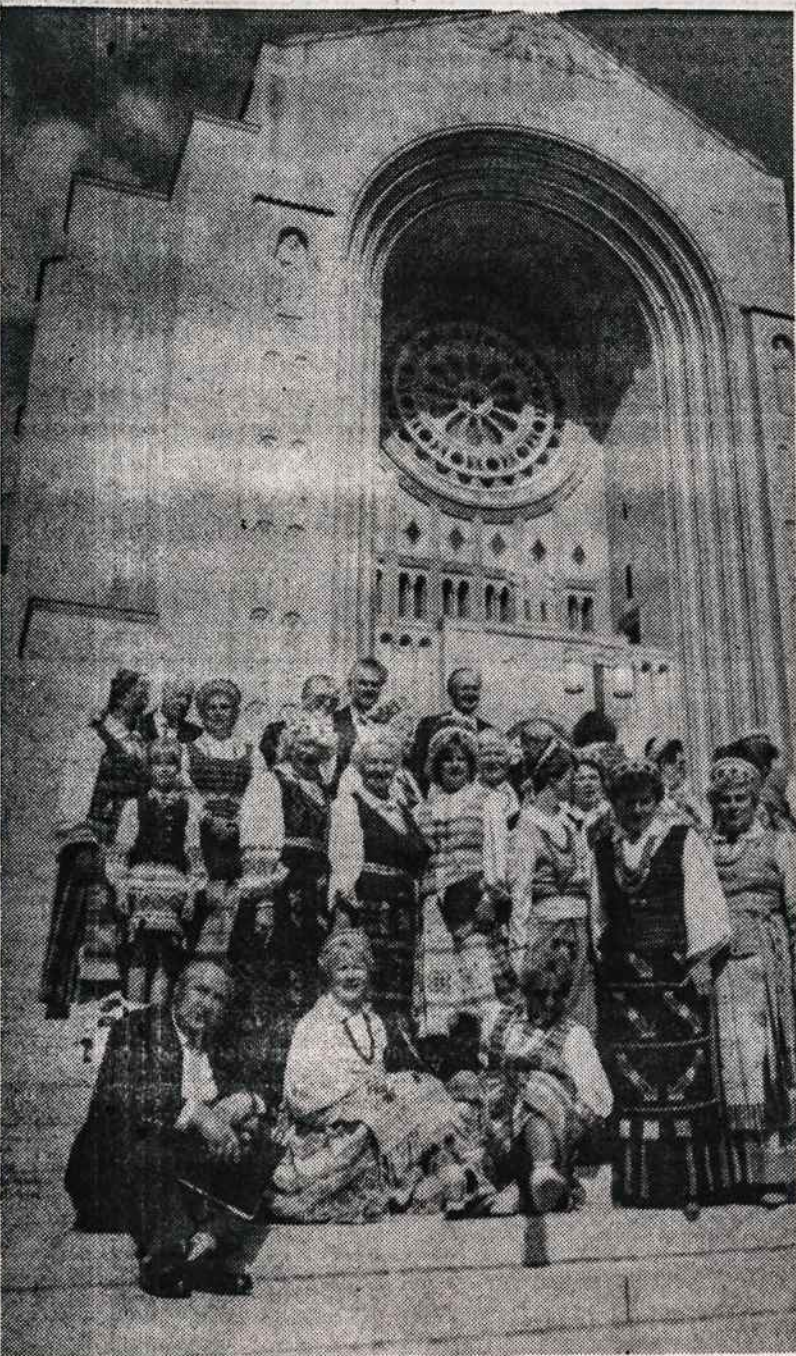
„Dainavos“ ansamblis iš Chicagos prie Amerikos katalikų Nekalto Prasidėjimo bazilikos Washingtone spalio 13, minint Šiluvos Marijos lietuvių koplyčios šventinimo 25 metų sukaktį.

Šios knygos gaunamos Darbininko Administracijoje. Galima užsakyti skambinant telefonu (718) 827-1351 arba rašant Darbininko administracijai — 341 Highland Blvd., Brooklyn, NY 11207. Galima nesiųsti iš anksto čekio, nes nežinome, kiek kainuos persiuntimo išlaidos. Kai išsiųsime užsakytas knygas, tada išsiųsime ir sąskaitą.