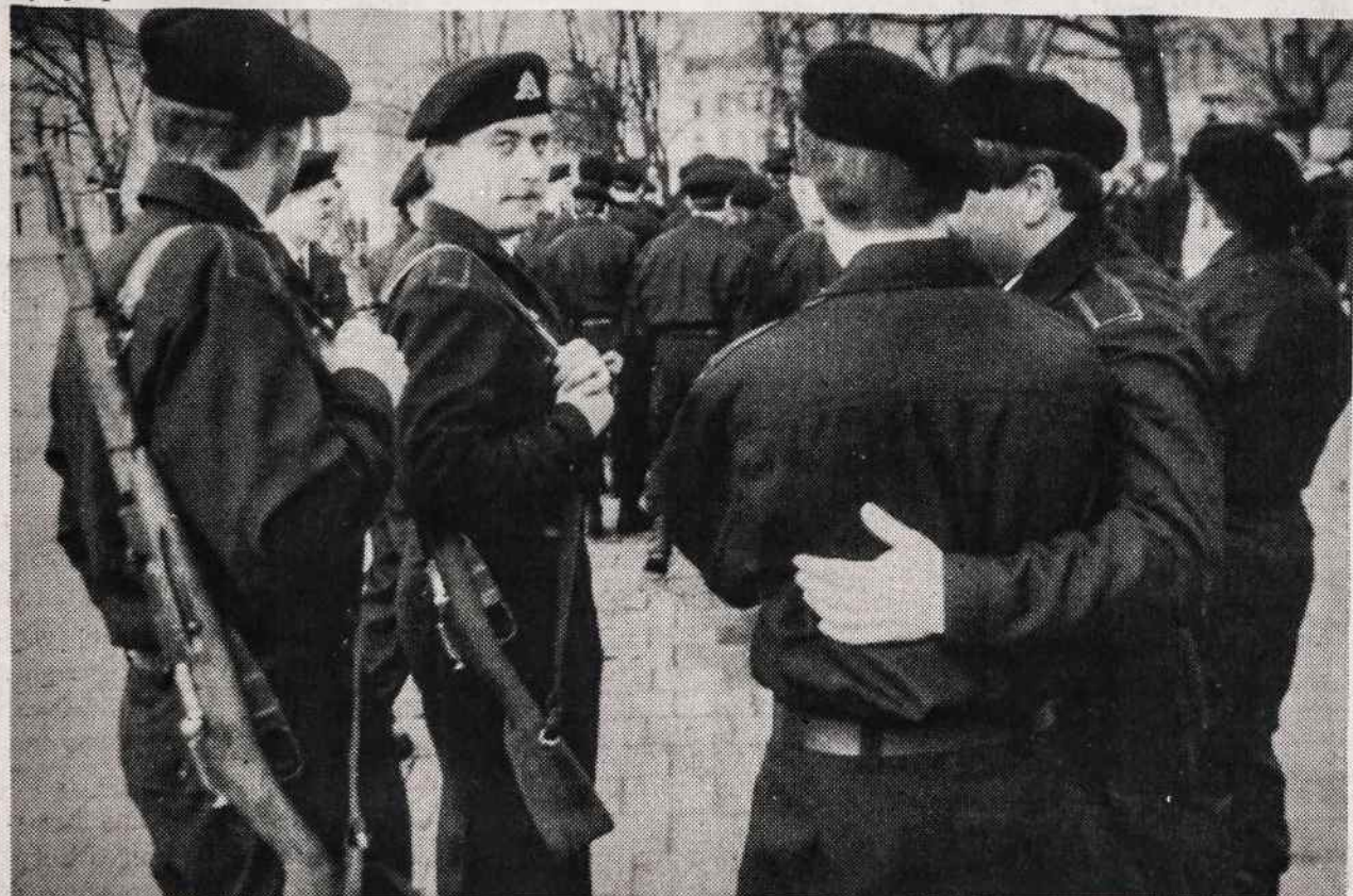
Taip atrodo naujai atsikūrusios Lietuvos kariai iš arčiau.