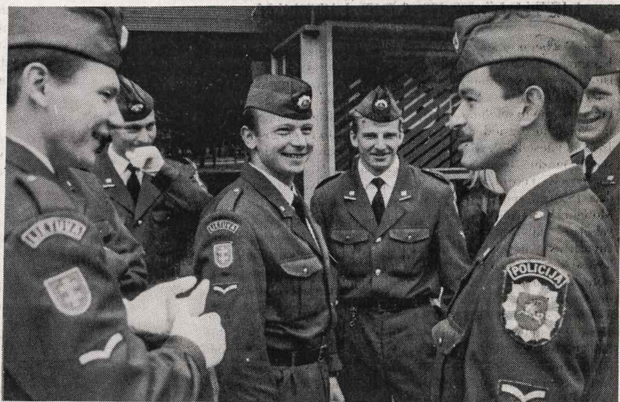
Nepriklausomos Lietuvos policija naujose uniformose.

Tegu sušvitę Padėkos dienos žiburiai nušviečia ir mus visus, paskatina gėriui, kad iš mūsų visų spinduliuotų meilė.