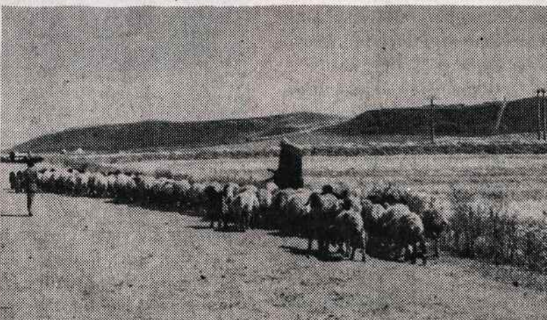
Eblos piliakalnis ir nūdienis Sirijos skerdžius.

Saladiną man garsiu padarė ne tik istorija, bet ir kelionės po Artimuosius Rytus. Keliaujant po Šiaurinį Iraką, teko stabtelėti Saladino gimtinėje, Tikrito (Tikrit) mieste ant vakarinio Eufrato kranto. Tikritas, tiesa, kadaise buvo kurdų miestas, — Salah ad-Din buvo kurdas, — bet nūdien čia arabai Saladina savo laiko.