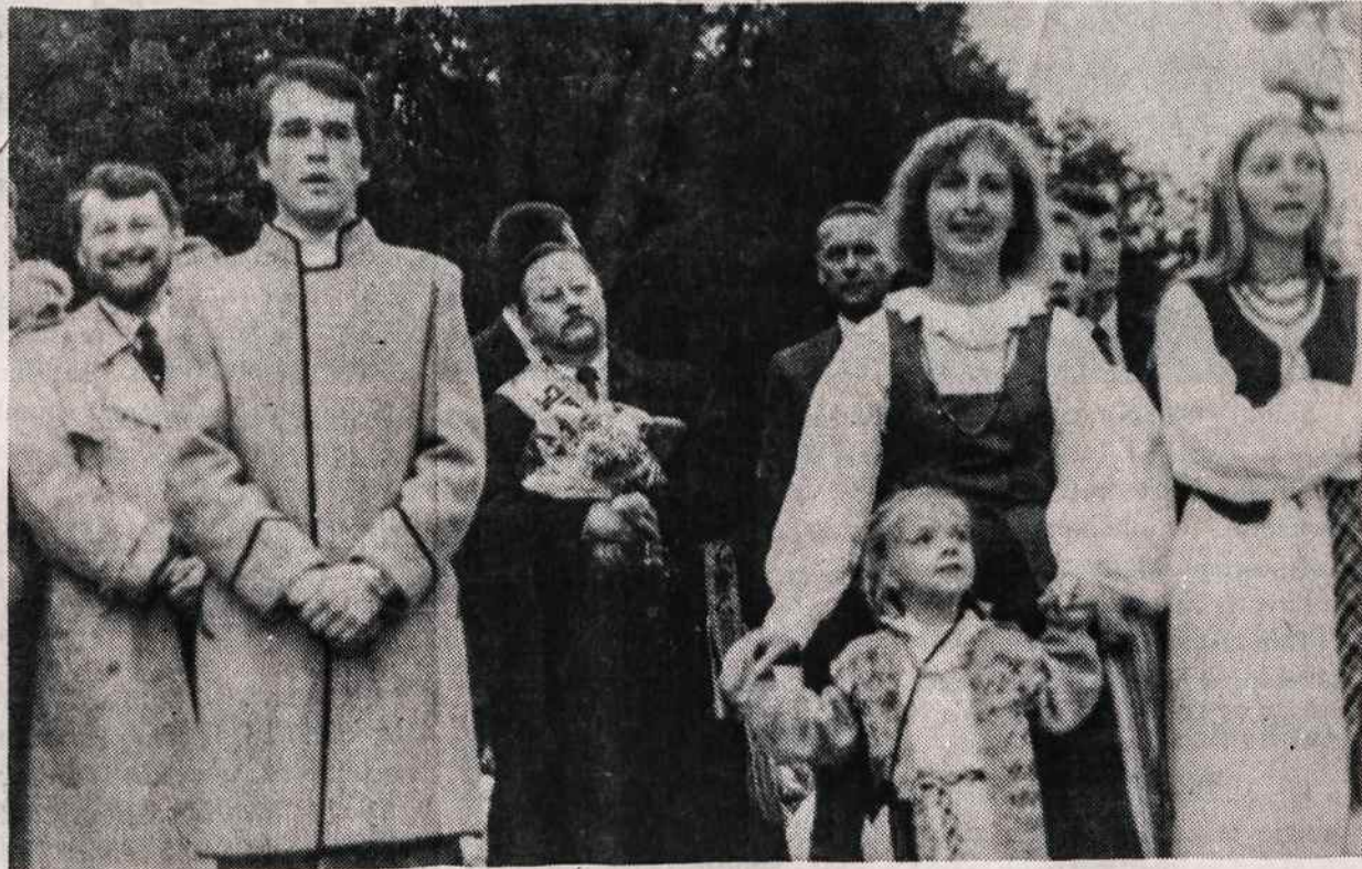
Gedimino šventė Vilniuje. Lietuvos prezidentas prof. Vytautas Landsbergis tarp jaunimo atstovų.