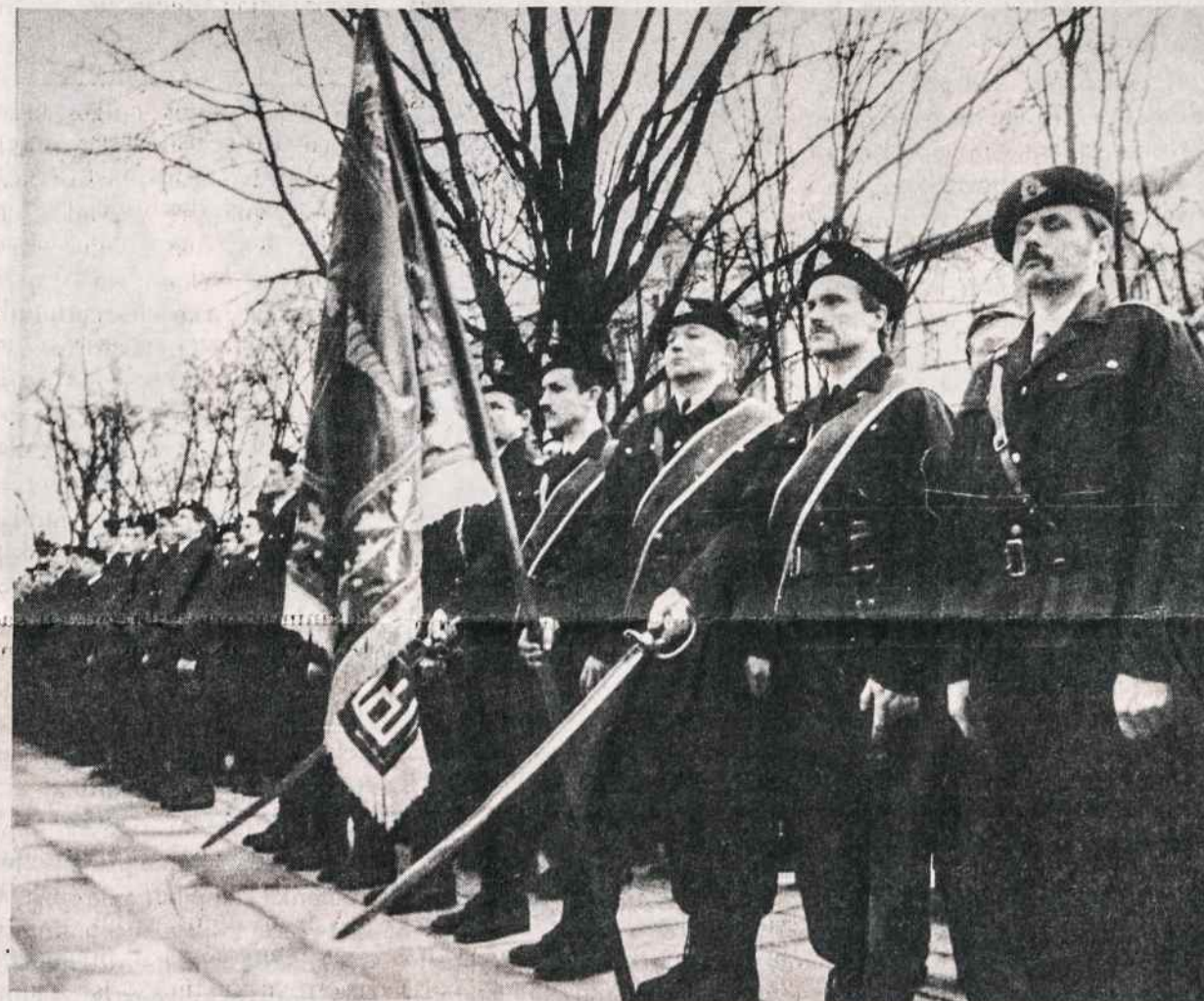
Minint Lietuvos kariuomenės dieną, kuri buvo švenčiama lapkričio 23-ąją, dabar pasaulio lietuvių žvilgsniai krypta į Lietuvą, kuri jau pradėjo organizuoti savo kariuomenę. Čia vaizdas iš iškilmų, kuriose dalyvauja jaunieji kariai su savo vėliava.

Pirmaisiais dviem Lietuvos nepriklausomo gyvenimo dešimtmečiais kalbininkai dėjo daug pastangų mūsų kalbą kiek įmanoma išvalyti, atsikratant kai kurių svetimžodžių ir sukuriant vadinamuosius naujadarus iš jau turimų lietuvių kalbos žodžių. Tai labiau sekėsi kalbą valant nuo kaimyninių tautų įtakos. Tad iš "parasoliaus" pasidarė lietsargis, iš "pažarninko" — ugniagesys, iš "nedėlios" — savaitė, iš "petelnės" — keptuvė ir t.t. Ne visi naujadarai tačiau prigijo. Pav., tolkalbiai ir purvabridžiai taip ir liko telefonais ir kaliošais.