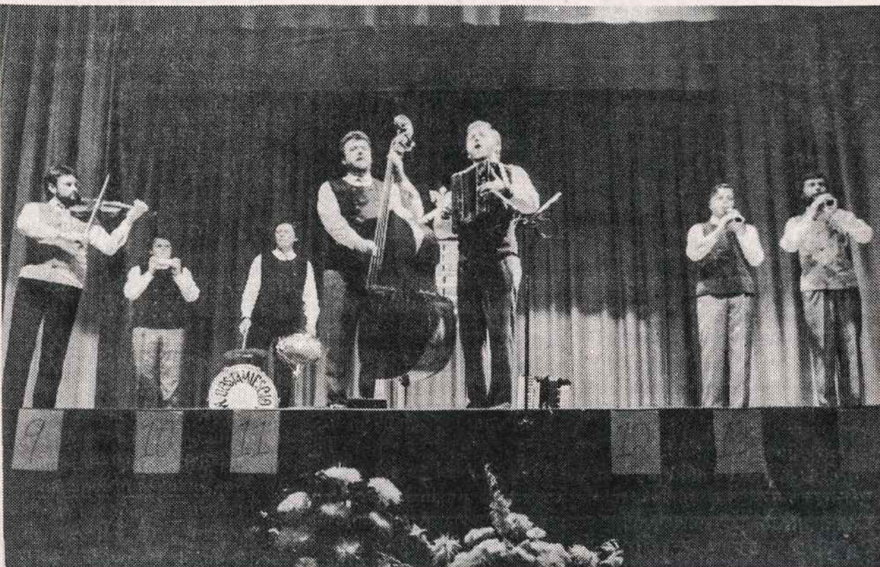
“Uostamiesčio muzikantai” koncertuoja Kultūros Židinio scenoje Brooklyne lapkričio 16. Koncertą rengė Laisvės Žiburio radijas.

DEXTER PARK PHARMACY Wm. Anastasi, B.S. 77-01 JAMAICA AVENUE (Cor. 77th Street) Woodhaven, N.Y. 11421 WE DELIVER 296-4130