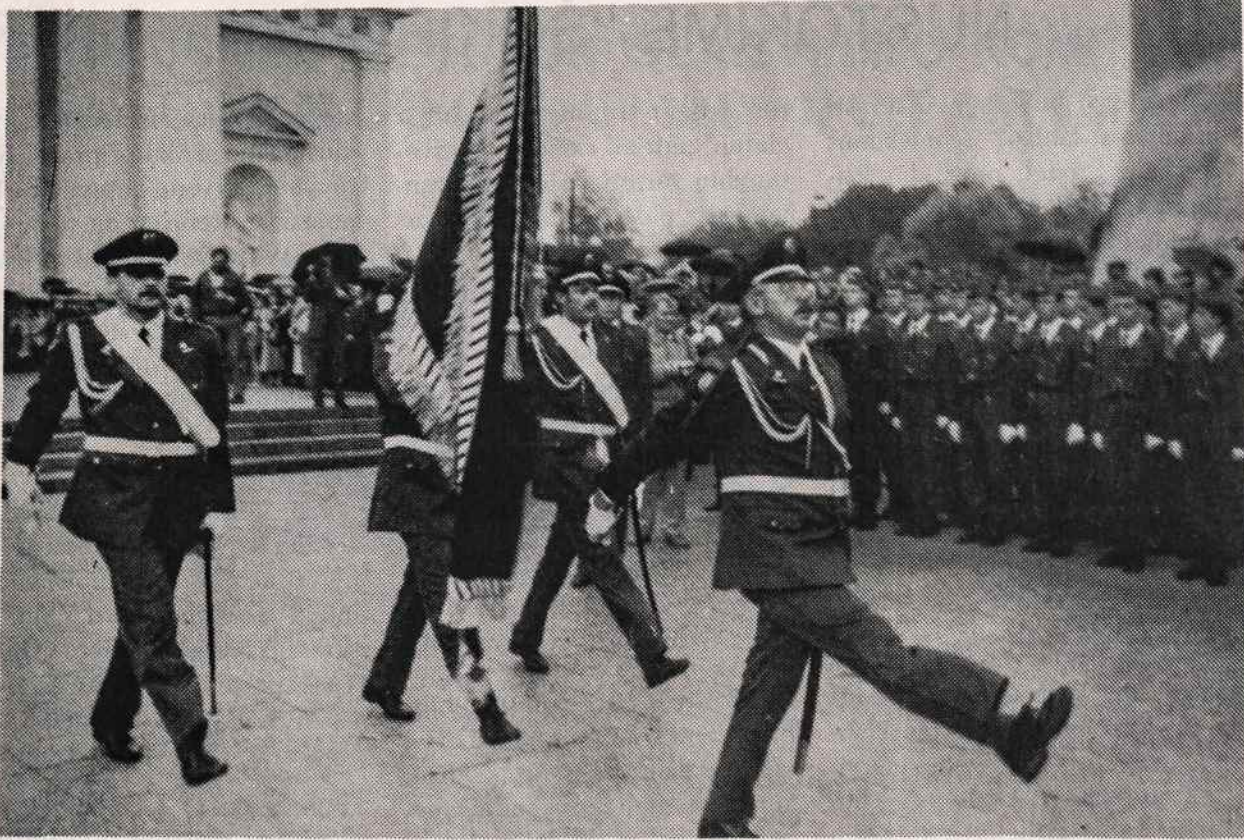
Iškilmingas paradas Lietuvos Policijos šventėje Vilniuje 1991 spalio mėn.