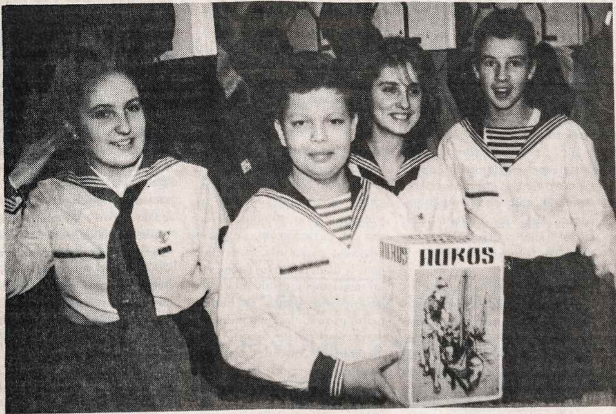
Lietuvos Sąjūdžio suvažiavime 1991 m. gruodžio 14-15 d. Vilniuje jūrų skautai renka aukas. Nuotr. Viktoro Kapočiaus