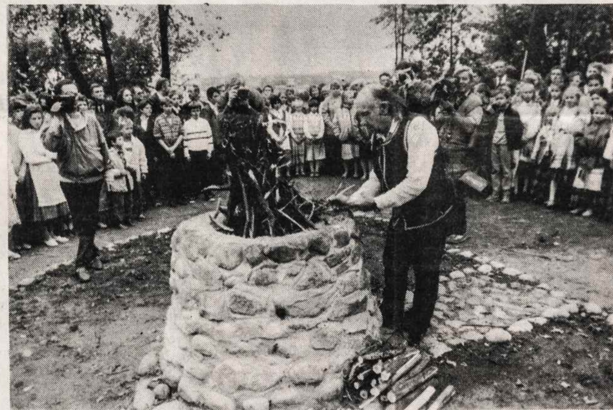
Vaidzas iš Didžiojo Lietuvos Kunigaikščio Gedimino šventės iškilnių atidarymo Vilniuje 1991 m. rugsėjo 28 d.: ant Gedimino kapo uždegamas aukuras. Šventė vyko ir rugsėjo 29 d., aplankant senųjų šventyklų ir kitas istorines vietas.

Noriu pacituoti kapitono Kluboko žodžius: "Koks jis buvo žmogus, tegul apie jį sprendžia