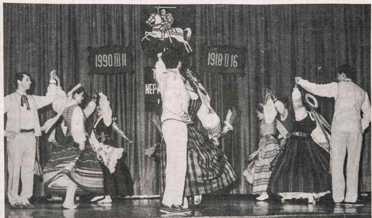
New Yorko lietuvių tautinių šokių grupė "Tryptinis" dalyvauja Lietuvos nepriklausomybės šventės programoje Kultūros Židinyje vasario 16 d.