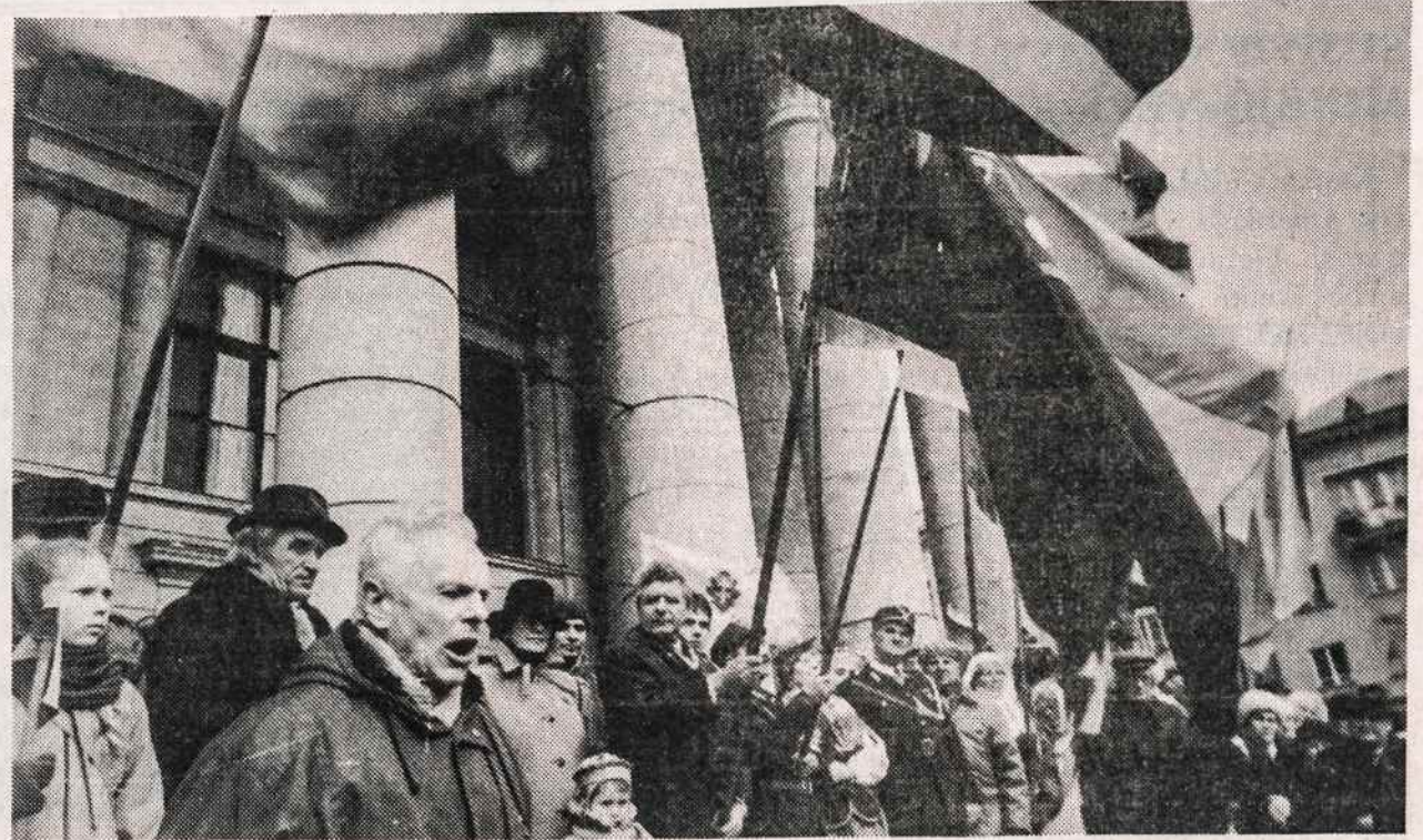
1992 vasario 16 d. minia džiūgauja Vilniuje, Nepriklausomybės aikštėje.