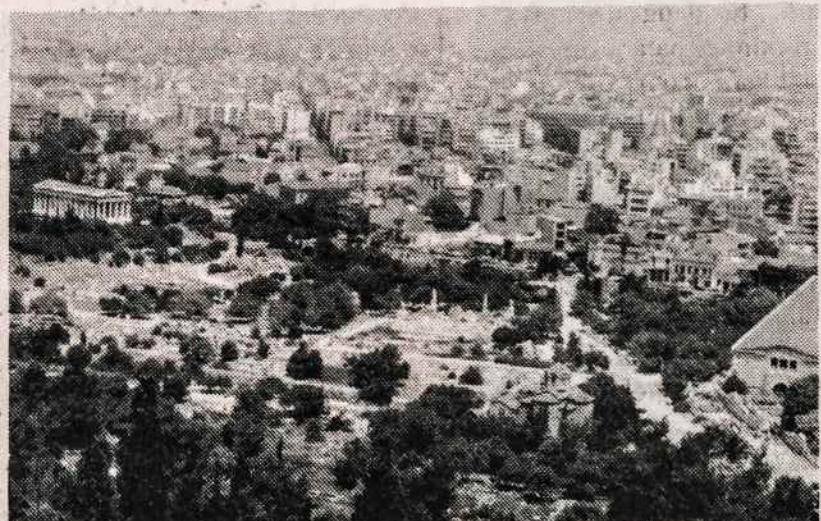
Atėnai: Bendras vaizdas.