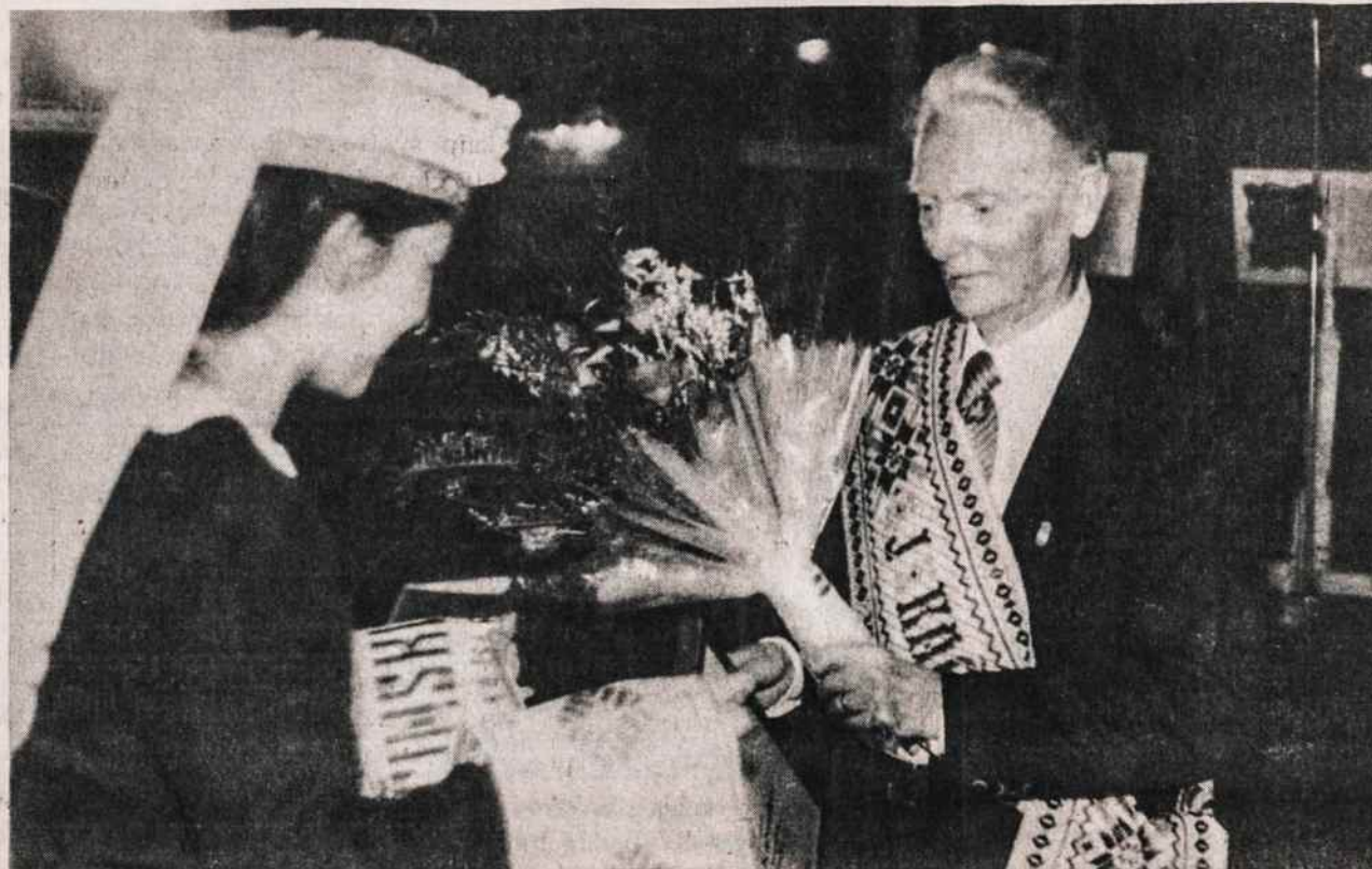
Kompozitorius Jeronimas Kačinskas po koncerto Klaipėdoje, 1991 m. rudenį.