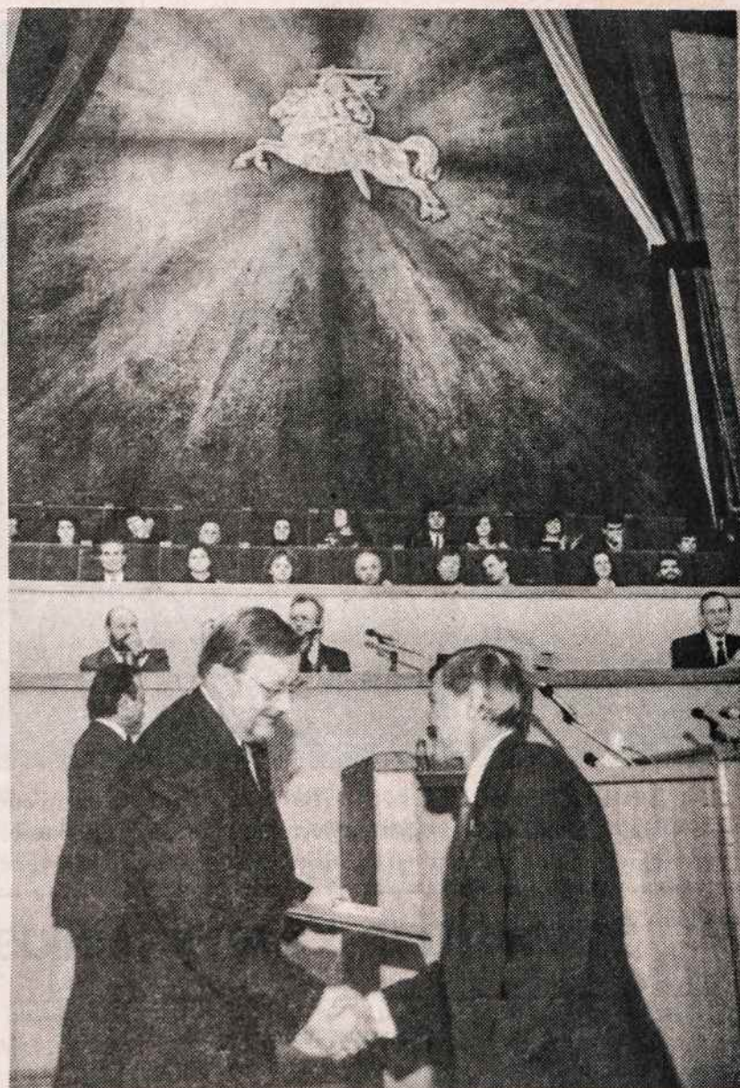
Lietuvos Aukščiausiosios Tarybos pirm. Vytautas Landsbergis Parlamente įteikia Sausio 13-osios medalius Lietuvos ir užsienio žmonėms, minint Kruvinąjį Sekmadienio metines.