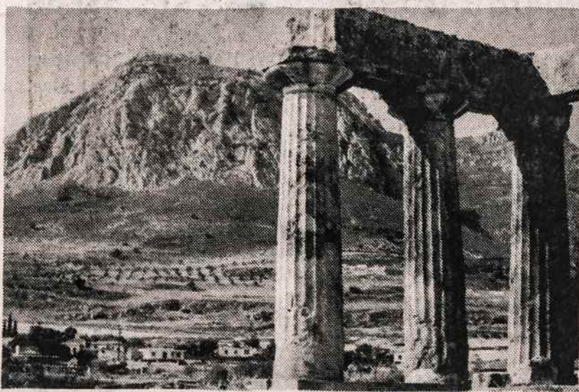
Korintas: Apolono šventovės dalis ir Akrokorintas.

Partenonas yra V prieškristinio amžiaus — Graikijos aukso amžiaus architektūrinis šedevras. Tuomet Atėnai kūrė demokratine imperiją, ėmė veržtis į išminties-filosofijos aukštumas, steigė ne tik lygas Kikladų salyne, bet ir stengėsi išlaikyti naujasėdijas Sicilijoje bei Italijos pusiasalyje ir varžėsi su diktatūron linkusia Sparta dėl Graikijos. Atėnietis, vardu Periklis, buvo Atėnų politikas, karo vadas, Partenono statytojas. 445 m. prieš Kristų Periklis sudarė su Atėnų varžove Sparta 30-ties metų paliaubas. Taika vyravo keturiolika metų. Periklis turėjo progą išpuosti Atėnus. Jam rūpėjo šventovės, menas, drama, muzika. Šventovė sienų neturi —