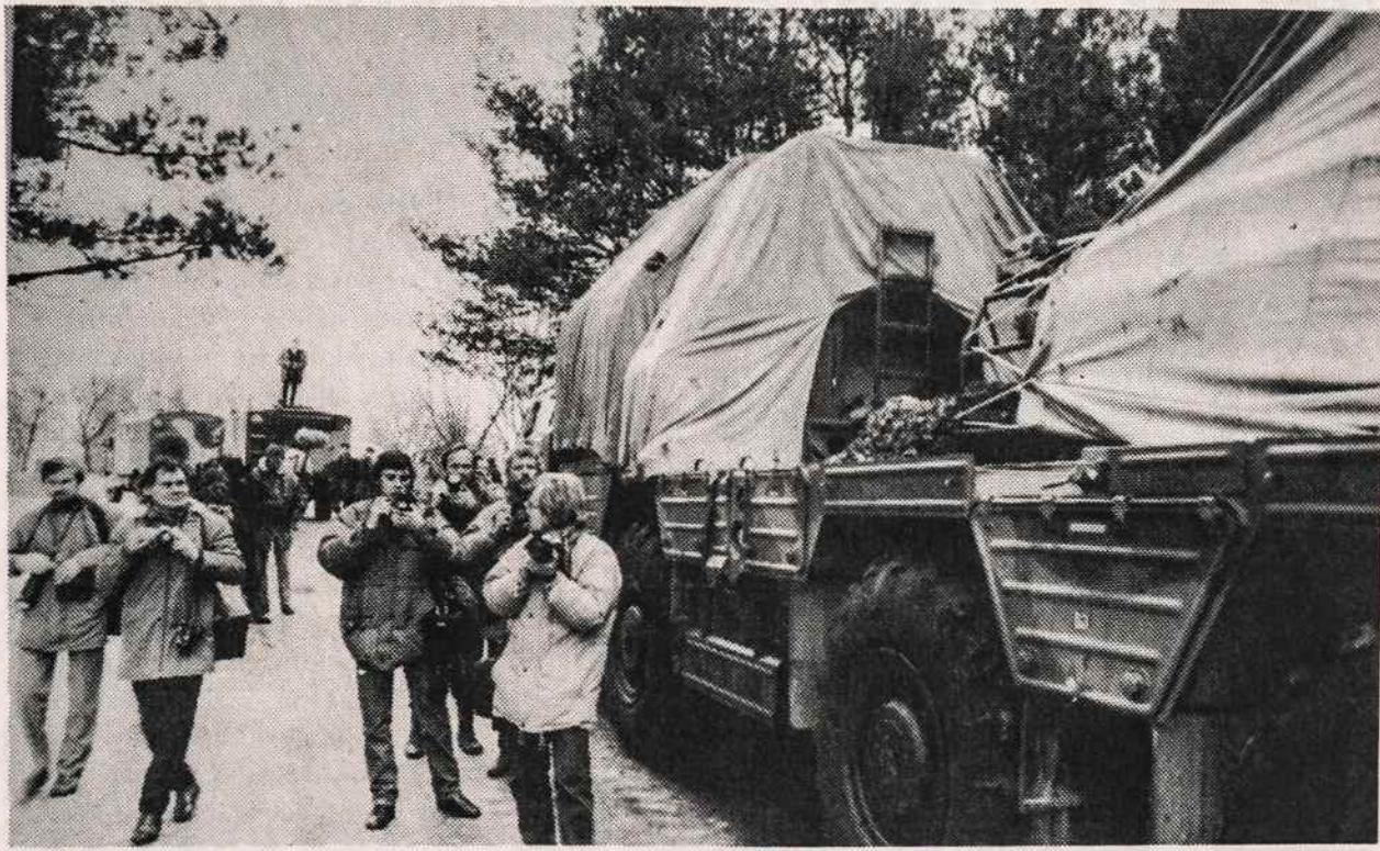
Tai ne maža žinia — Sovietų kariuomenė traukiasi, o ją "palydi" fotografai. Šis vaizdas užfiksuotas vasario 27 d., kai iš Mickūnų pajudėjo zenitinių raketų dalinys, tik, deja, ne Rusijos sienos link, bet persikėlė į Visorius prie Vilniaus. Naujausiomis žiniomis, tie daliniai kovo 2 d. priešpie pagaliau pradėjo trauktis iki Lietuvos sienos su Latvija. Buvo laukiama, kad jie pasuks į Rusiją.