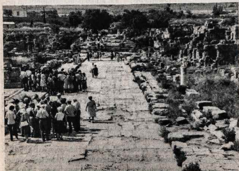
Senasis Korintas turi būrius lankytojų.

skelbimas imperatoriumi įprasta datuoti 52-aisiais metais, t.y. tuo metu, kai Klaudijus siuntė pasveikinimus, ryšium su Galiono atsiųstu pranešimu. Delfų įrašas prileidžia, kad Galionas jau kurį laiką buvo buvęs Achajos pro-