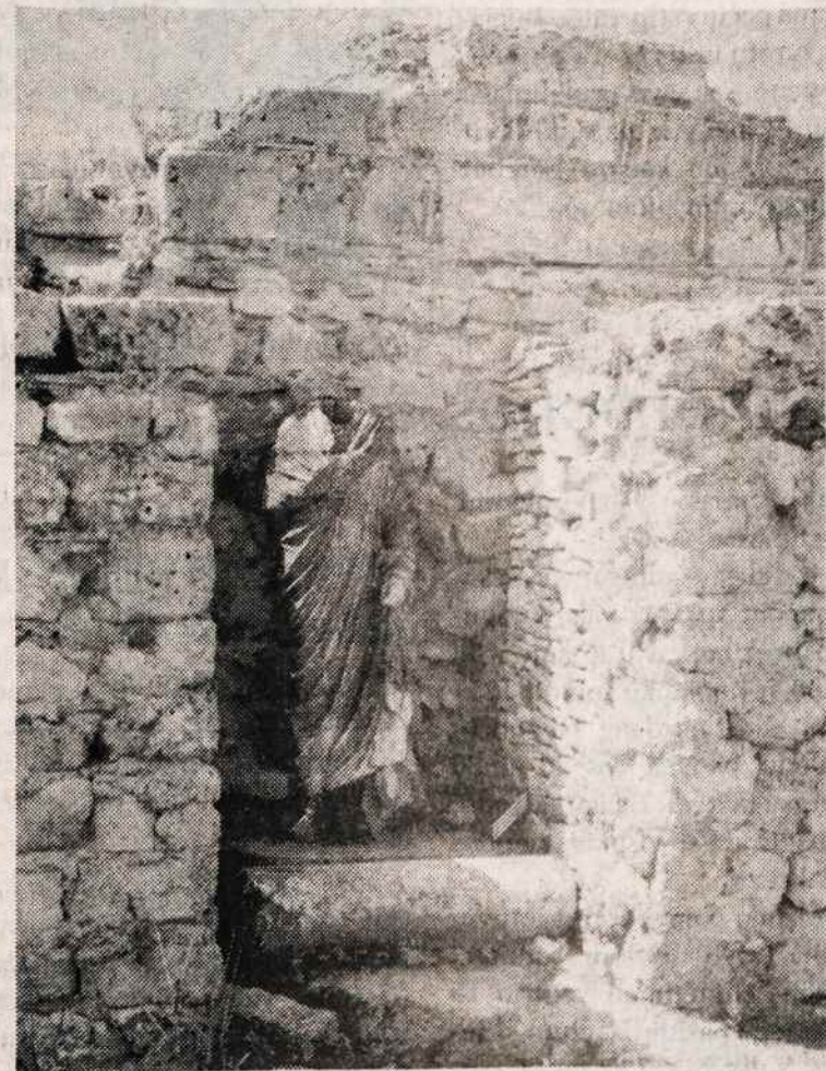
Korintas: statula be galvos. Achajos prokonsulai buvo dažnai keičiami, — statula gaudavo naują galvą.

Korintas buvo Romos imperijos didmiestis. Sakoma, kad miestas turėjo ketvirtį milijono gyvento-