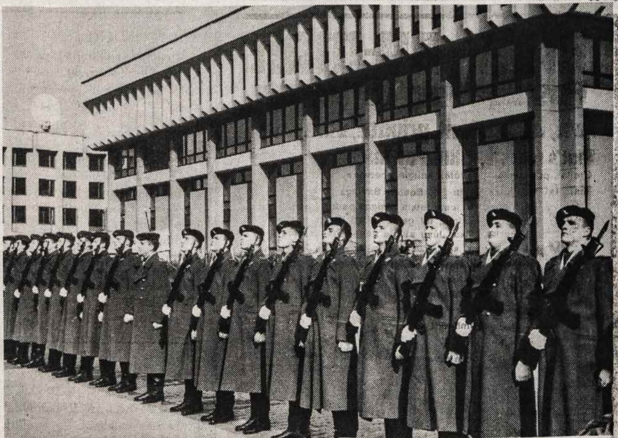
Vilniuje prie Parlamento rūmų Lietuvos naujosios kariuomenės rikiuotė 1992 m. kovo 11 d., Nepriklausomybės atkūrimą minint.