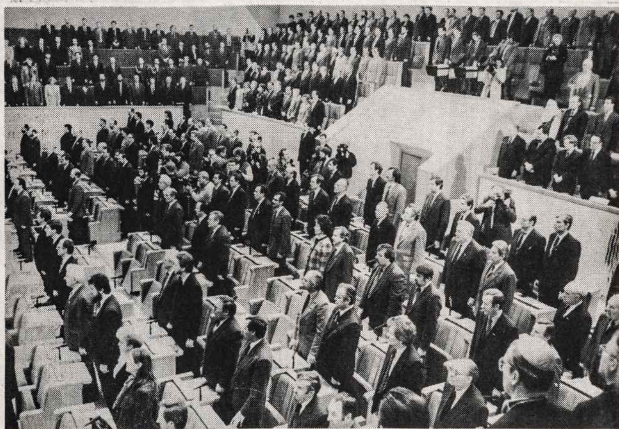
1992 m. kovo 11 d. Aukščiausiosios Tarybos iškilmingas posėdis. Deputatai gieda Lietuvos himną.