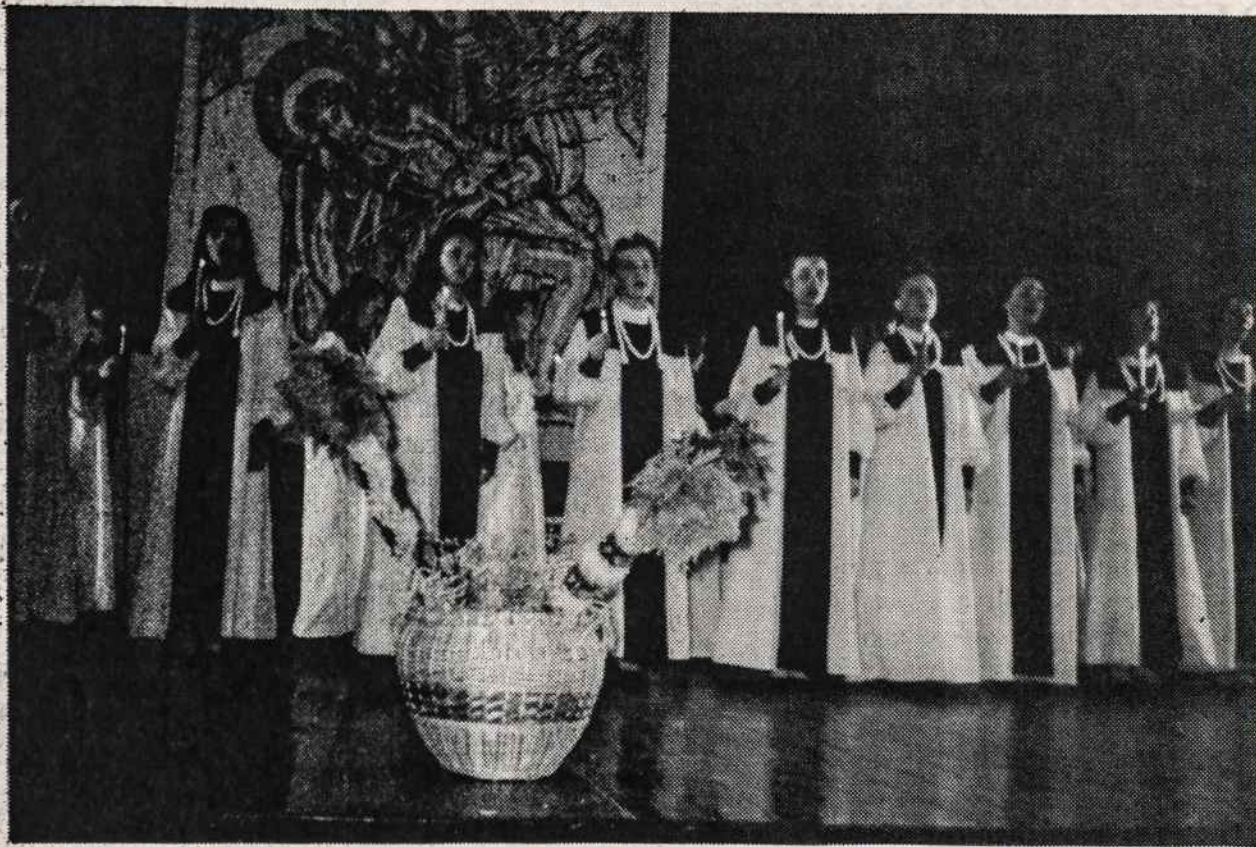
Mergaičių choras "Chorale" atlieka programą L.K. Bažnyčios Kronikos sukakties minėjime kovo 14 d. Vytauto Didžiojo universitete Kaune. Choro vadovė E. Jautukaitienė.