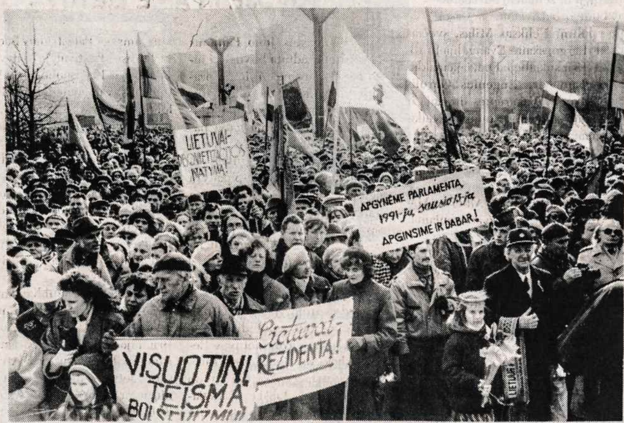
Vilniuje, Nepriklausomybės aikštėje, 1992 m. kovo 11 d. Sąjūdžio mitingas.

Visa tai rašome todėl, kad laikas jau dabar pradėti rūpintis, kaip prasmingiau ir įspūdingiau paminėti Kražių įvykių sukaktį. Reikia jau dabar sudaryti specialius komitetus, ieškoti būdų kuo atžymėsime šią sukaktį, kad jos prisiminimas išliktų ateičiai, kad mus pačius stiprintų. Iniciatyvos turėtų imtis Lietuvių Bendruomenė su savo padaliniais. Kražių įvykiai yra tokie dideli ir tokie prasmingi, kad pro juos bet kaip praeiti negalima.