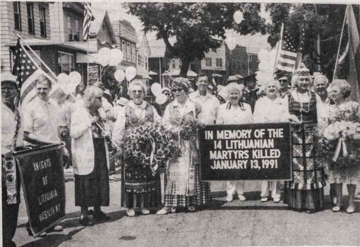
Lietuvos Vyčių 110 kuopa iš Maspeth, NY, V. Atsimainymo lietuvių parapijos, šiomet vėl dalyvavo iškilmingame parade gegužės 24 d., prisimenant JAV žuvusius, sužeistus ir dingusius karius. Šiomet, kaip ir pereiniais metais, prisiminti taip pat 1991 m. sausio 13 d. Vilniuje žuvę lietuviai. Čia su plakatu matoma dalis Lietuvos Vyčių, dalyvavusių eisenoje.

Pridurtina, kad Morkus lankė liuanistinę šeštadieninę mokyklą Elizabethe, o vasaros atostogų dvi savaites praleisdavo lietuvių jaunuolių stovyklose.