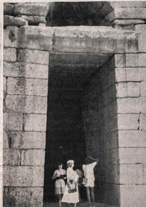
Mikėnai: Atrėjaus išdo tarpduris iš lauko ir iš vidaus pusės.

Gerai gidas pasako iš anksto, kas bus daroma. Mūsų gidė turi