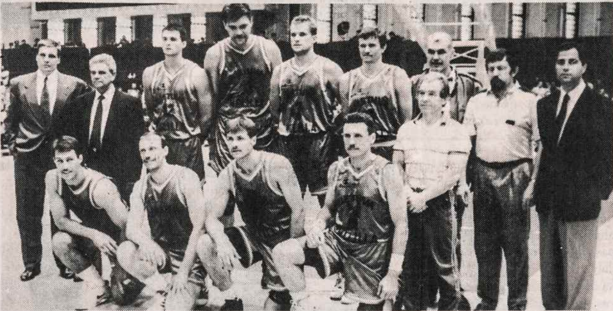
Lietuvos olimpinė krepšinio rinktinė.

Atsisėdo verandoje, glostė ledo atšaldytą degtinės stiklą ir žvalgėsi po temstantį dangų. Prie pat akiračio driekėsi juoda debesų juosta, o tos juostos viršus liepsnojo raudona ugnimi. Sprindžiu aukščiau vėl buvo tamsu, lyg suodžiais išterliota. Vaizdas atrodė labai šiurpia ir egzotiškai. Jonui Runtai tokia padangė nepatiko. Jis, tiesa, vaizdais nesidomėjo. (Bus daugiau)