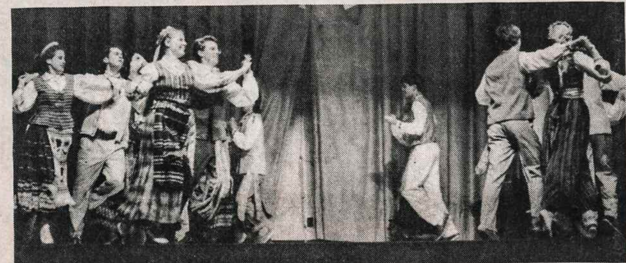
New Yorko tautinių šokių ansamblis "Tryptinis" šoka Maironio mokyklos abiturientų išleistuvių vakare. Ansamblis vyksta į devintąją tautinių šokių šventę Chicagoje.