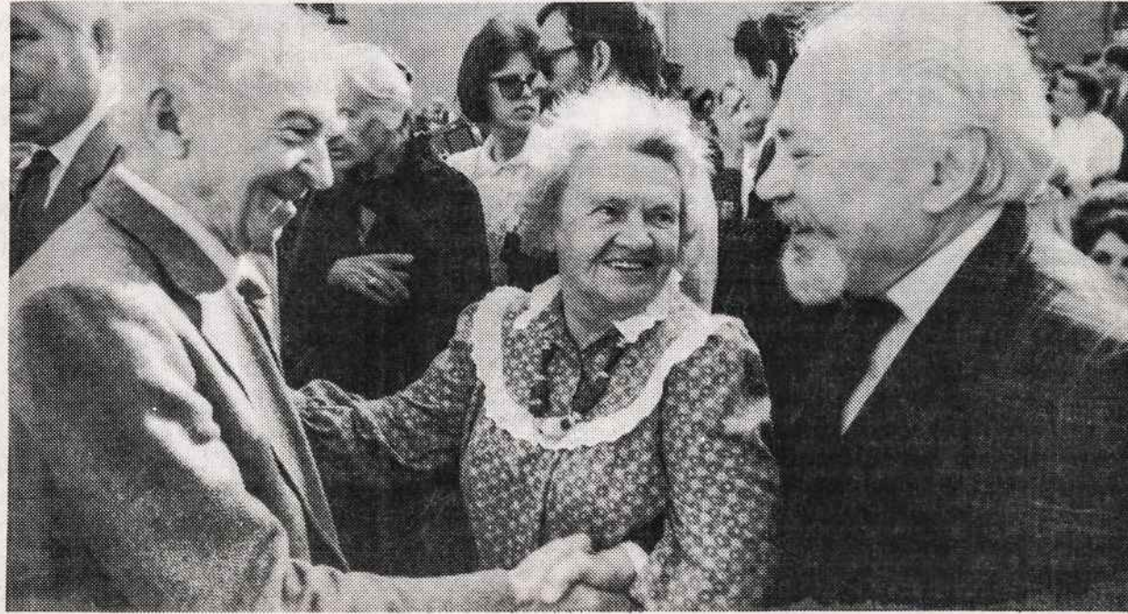
Poetai Bernardas Brazdžionis ir Kazys Bradūnas (su žmona) Vilniuje gegužės 31 d., poezijos pavasario šventėje.