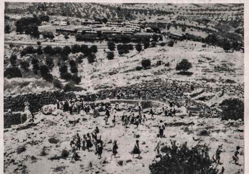
Mikėnai: karalių kapai Akropolio šlaite.

Agamemnonas, graikų kariuomenės vadas, prieš išplaukdamas į Troją, paaukoja dievams ant aukuro savo dukterį Ifigeniją. Klytemnestra to jam negali atleisti. Karui tęsiantis dešimt metų, ji tampa slapta Tyestes