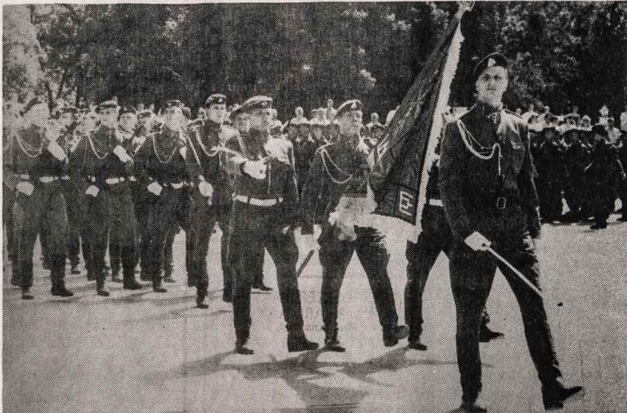
Po priesaikos Arkikatedros aikštėje birželio 6 d., Lietuvos "Celežinio vilko" brigados vyrai paraduoja Vilniaus gatvėmis.

— Gerbiamas? Tas sukčius! Tas apgavikas! Rašyk jam paprastai: "Brangus kolega!"