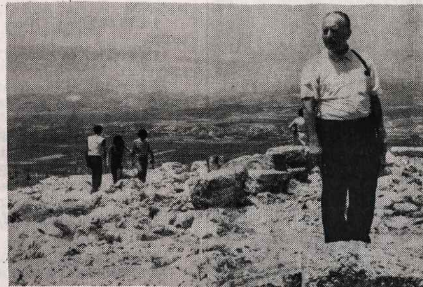
Mikėnai. Liūtų vartai Achajos kalnų fone.

"Oresteia" trilogijos fonas yra Trojos karas — istoriškas įvykis. Achajų kilnojimas sukūrė graikų naujasėdijas Mažojoje Azijoje.