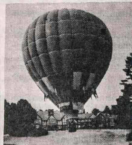
Toks balionas šiemet dalyvaus Pranciškonų Susiartinimo dienoje liepos 12 d.