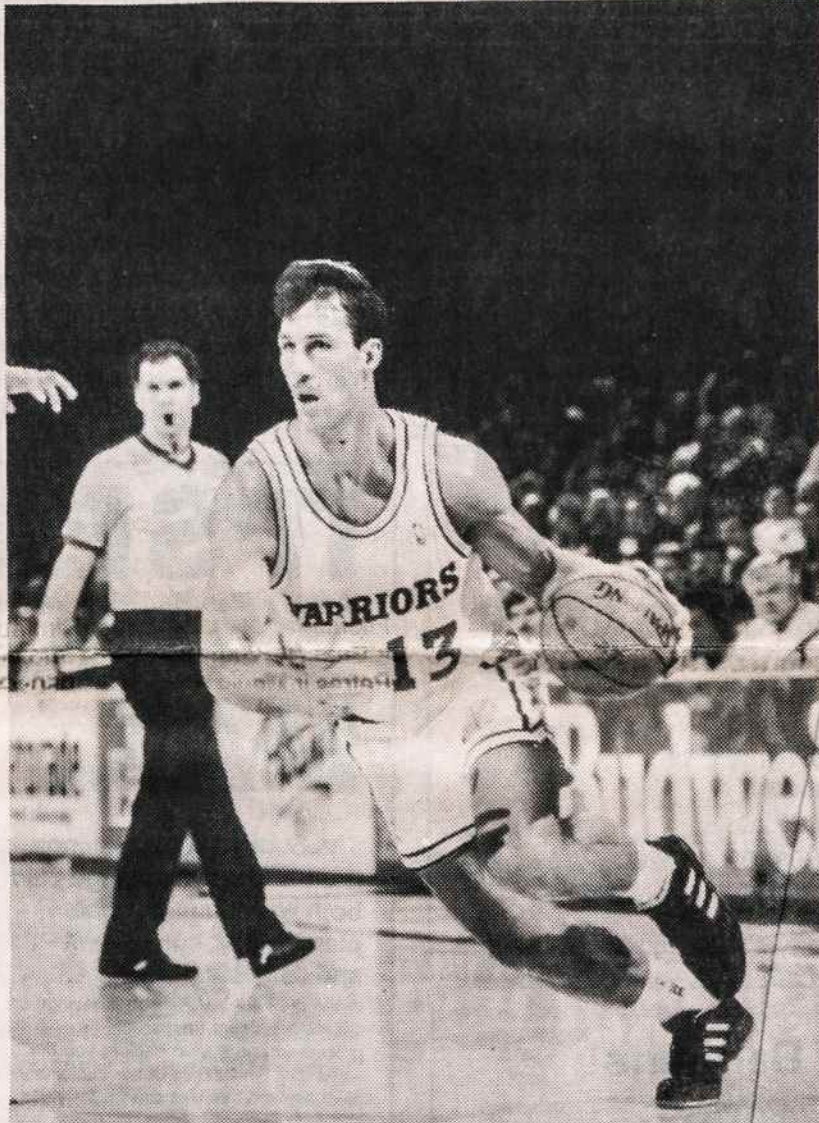
Šarūnas Marčiulionis rungtynėse

Nors tai dar ne olimpinis laimėjimas, tačiau Lietuvai tai labai naudingas laimėjimas. Tai at-