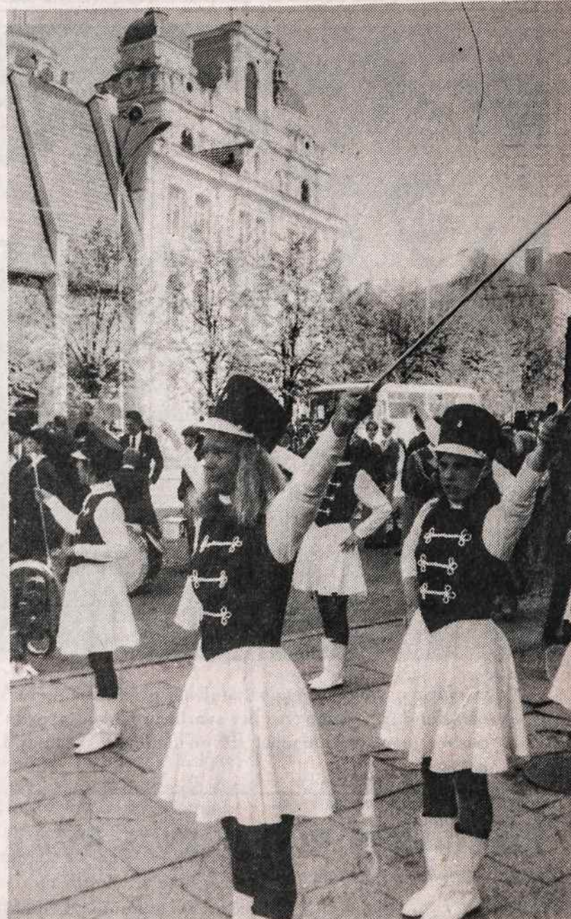
Švedų moksleivės Vilniuje dalyvauja dūdų orkestro šventėje.