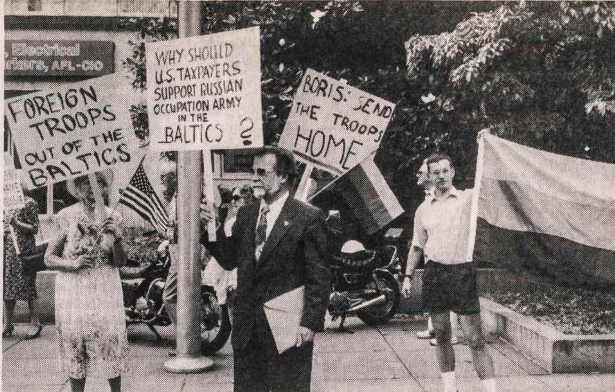
Žygiuojama su plakatais prie Rusijos Ambasados Washington JAV LB Krašto valdybos surengtoje demonstracijoje 1992 m. birželio 16 d.

Tokią pat teisę atstatyti Lietuvos Respublikos pilietybės turi ir nurodytų asmenų vaikai, kurie gimimu neįgijo kitos valstybės pilietybės (pavyzdžiui gimusieji Vokietijos stovyklose). Norėdume atkreipti dėmesį į tai, kad nurodytų asmenų vaikai, kurie gimė Jungtinėse Amerikos Valstijose, savo gimimu įgijo JAV pilietybę. Dėl to, pagal gruodžio 11 d. įstatymą, norint atstatyti Lietuvos pilietybę, jiems reikėtų atsižadėti JAV pilietybės ir persikelti nuolat gyventi į Lietuvą.