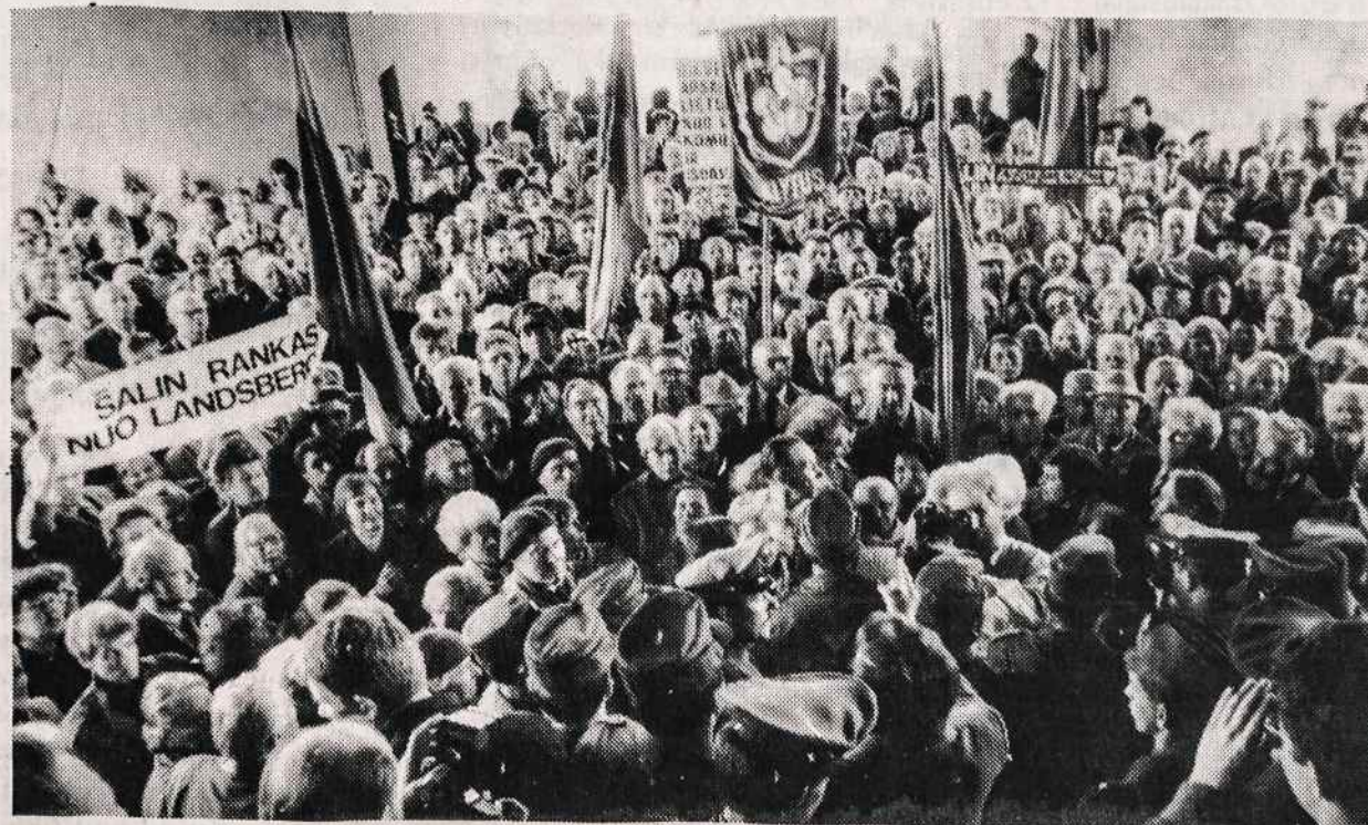
Prieš referendumą Vilniuje gegužės 19 d. piketuojamas Parlamentas, pasmerkiant komunistiškai nusistačiusius kairiuosius deputatus.

Visi remkime Lietuvių Fondą, nes gautomis palūkanomis remiama lietuvių.