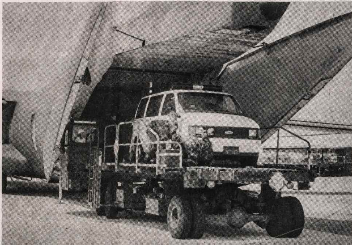
McGuire Air Force bazės karinis personalas krauna JAV kargo lėktuvą, kuris pakils skrydžiui į Vilnių, nešdamas 30,500 svarų medikamentų, aparatūros ir vieną ambulansą, bendros vertės apie pusantro milijono dolerių. Šį krovinį naudos Deborah Širdies ir Plaučių Centro 50-ies asmenų medikų-chirurgų vienetas, rugsėjo 18 d. išskrendantis į Lietuvą operuoti 20-ies vaikų, sergančių įgimtomis širdies ligomis. Deborah medikai Lietuvoje darbuos rugsėjo 21-25 dienomis.

Haydn - Schubert Festival P. O. Box 118 CH-8057 Zurich Switzerland.