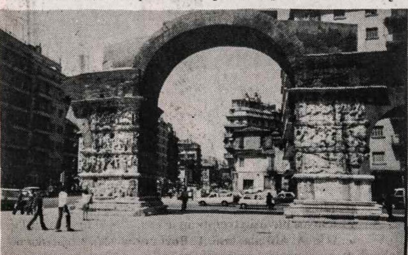
Romėnų imperijos likučiai Salonikuose-Tesalonikoje.