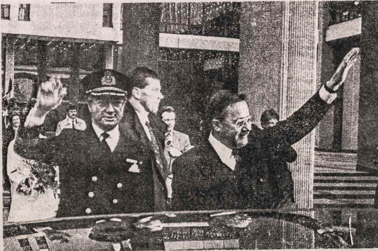
Vaizdas iš Švedijos karališkosios poros sutikimo Vilniuje spalio 15 d. prie Parlamento rūmų: Švedijos karalius Carl XVI Gustaf, jūrų laivyno admiralo uniforme, ir Lietuvos Aukščiausiosios Tarybos pirmininkas Vytautas Landsbergis atsako į susirinkusių vilniečių sveikinimus.