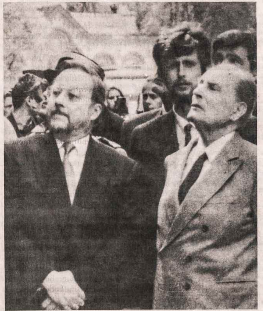
Su daugelio pasaulio valstybių vadais ir prezidentais teko susitikti Lietuvos Aukščiausiosios Tarybos pirm. Vytautui Landsbergiui. Šioje nuotraukoje jis Prancūzijos prezidentui François Mitterrand 1992 gegužės 14 d. rodo Vilniuje namą, kuriame 1918 m. vasario 16 d. buvo pasirašyta Lietuvos nepriklausomybės deklaracija.

Spalio 25 d. (pirmo turo) ir lapkričio 15 d. (antro turo) rinkimai į Lietuvos Seimą atnešė per-