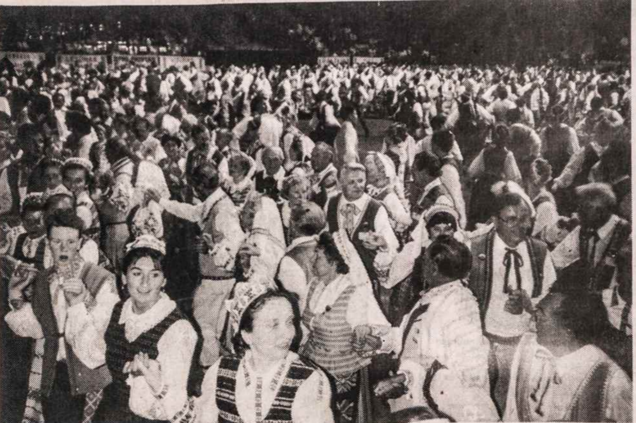
Šokėjų masė tautinių šokių šventėje liepos 5 d. Chicagoje.