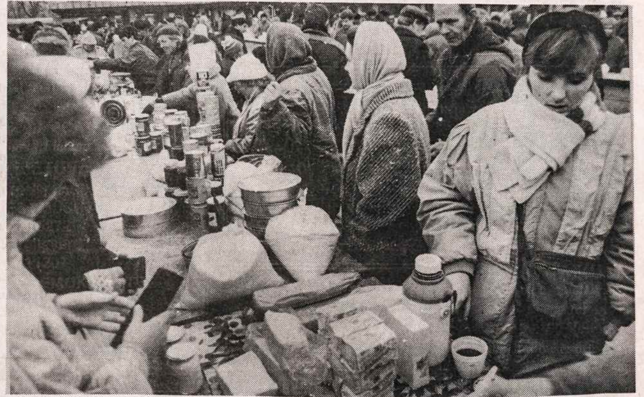
Vilniaus Kalvarijos turgavietėje prekiauja svečiai iš Ukrainos, Baltarusijos, Azerbaidžiano ir pigesnėmis kainomis parduoda kavą, sviestą, sūrį, dešrą, vaisius ir kitus produktus.