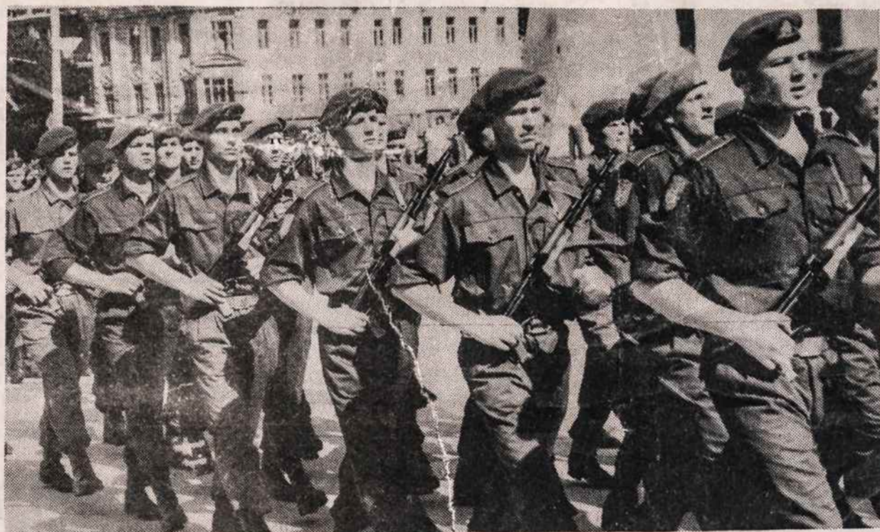
"Geležinio vilko" kariai žygiuoja Vilniuje.