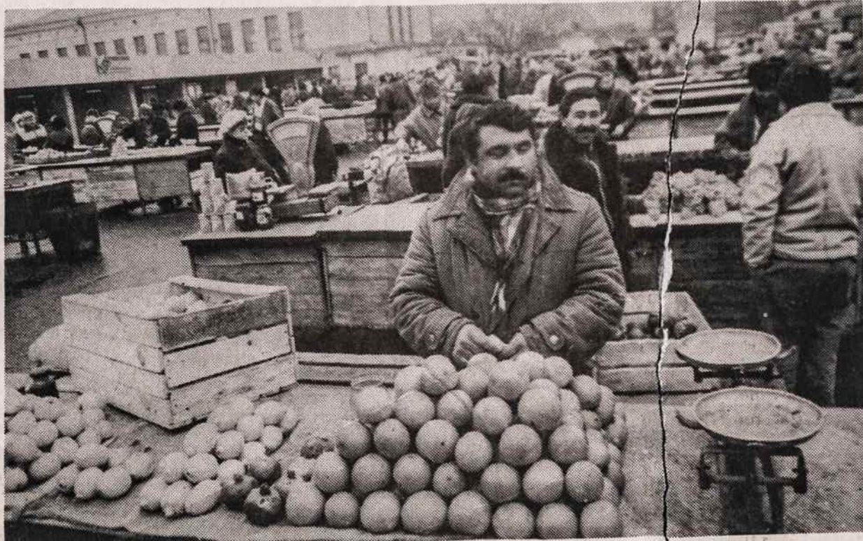
Vilniaus Kalvarijos turgavietėje: 1 citrina — 100 talonų, kilogramas bulvių 30 talonų.

MOKĖTI GALIMA VISOMIS KREDITO KORTĖLĖMIS JOKIO EKSTRA MOKESČIO UŽ PATARNAVIMĄ PILNAI APDRAUSTA IR AKREDITUOTA AGENTŪRA VYTIS INTERNATIONAL TRAVEL SERVICE 2129 KNAPP STREET BROOKLYN, N. Y. 11229 TEL.: 718 769 - 3300, FAX 718 769 - 3302