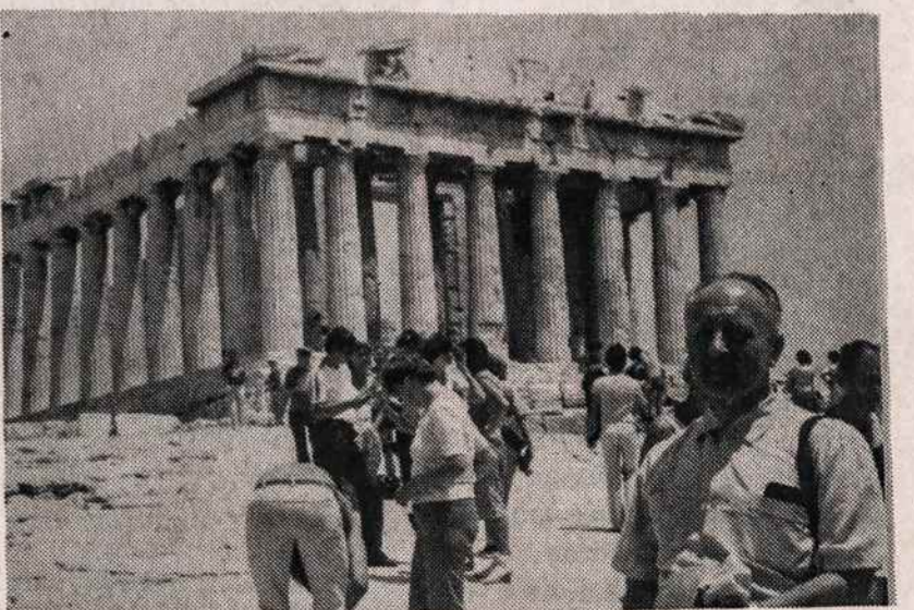
Grįžus į Atėnus, vėl prie Panteono.