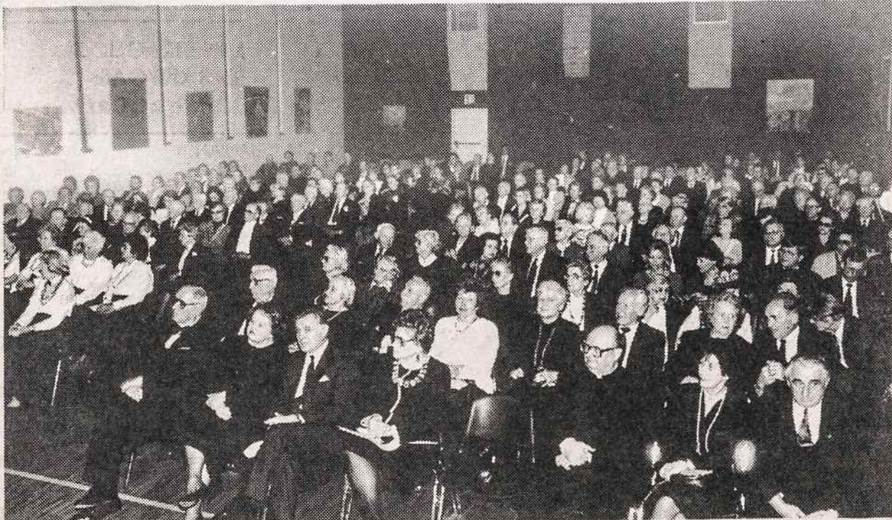
Dalis dalyvių Lietuvos nepriklausomybės 75-mečio sukakties šventėje vasario 21 d. Kultūros Židinyje.