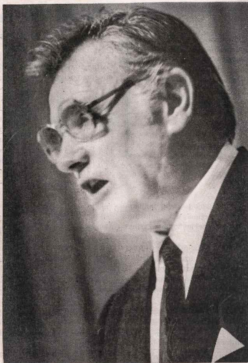
Valdas Adamkus, iš Chicagos, pasakė pagrindinę kalbą vasario 21 d. Kultūros Židinyje, kai buvo švenčiama Vasario 16-osios 75 metų sukaktis.

Noriu tikėti, kad mes savo moralinės atsakomybės prieš tautą