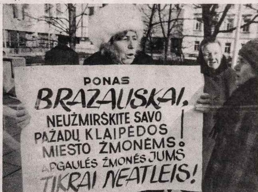
Piketuojiama prie vyriausybės rūmų Vilniuje.