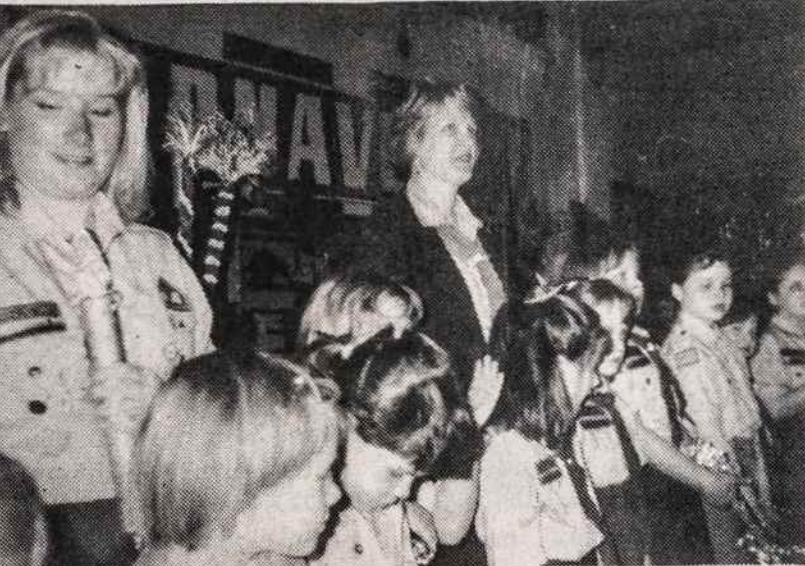
Vaidas iš Kaziuko mugės Chicagos Jaunimo Centre kovo 7 d. Matomas "Kernavės" tunto skautės.