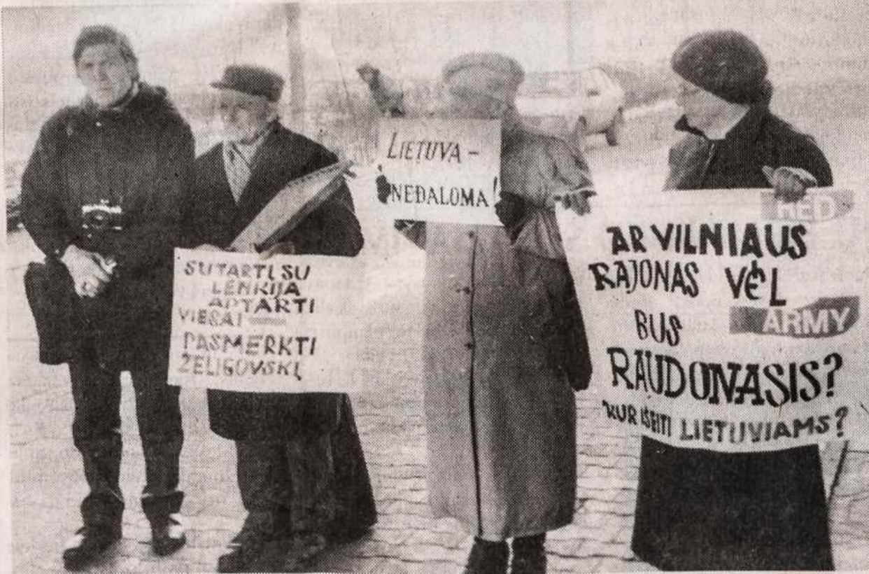
Vilniaus krašto lietuviai prie Seimo rūmų demonstruoja dėl Vilnijos lietuvių sunkios kultūrinės padėties.