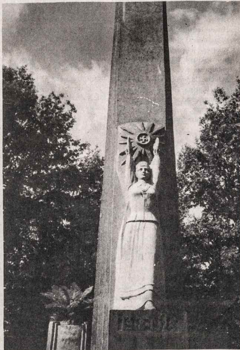
Skulptoriaus Roberto Antinio 1930 m. statytas Laisvės paminklas Rokiškyje. Per visus bolševikmečius stovyla išliko, nepaisant svastikos.