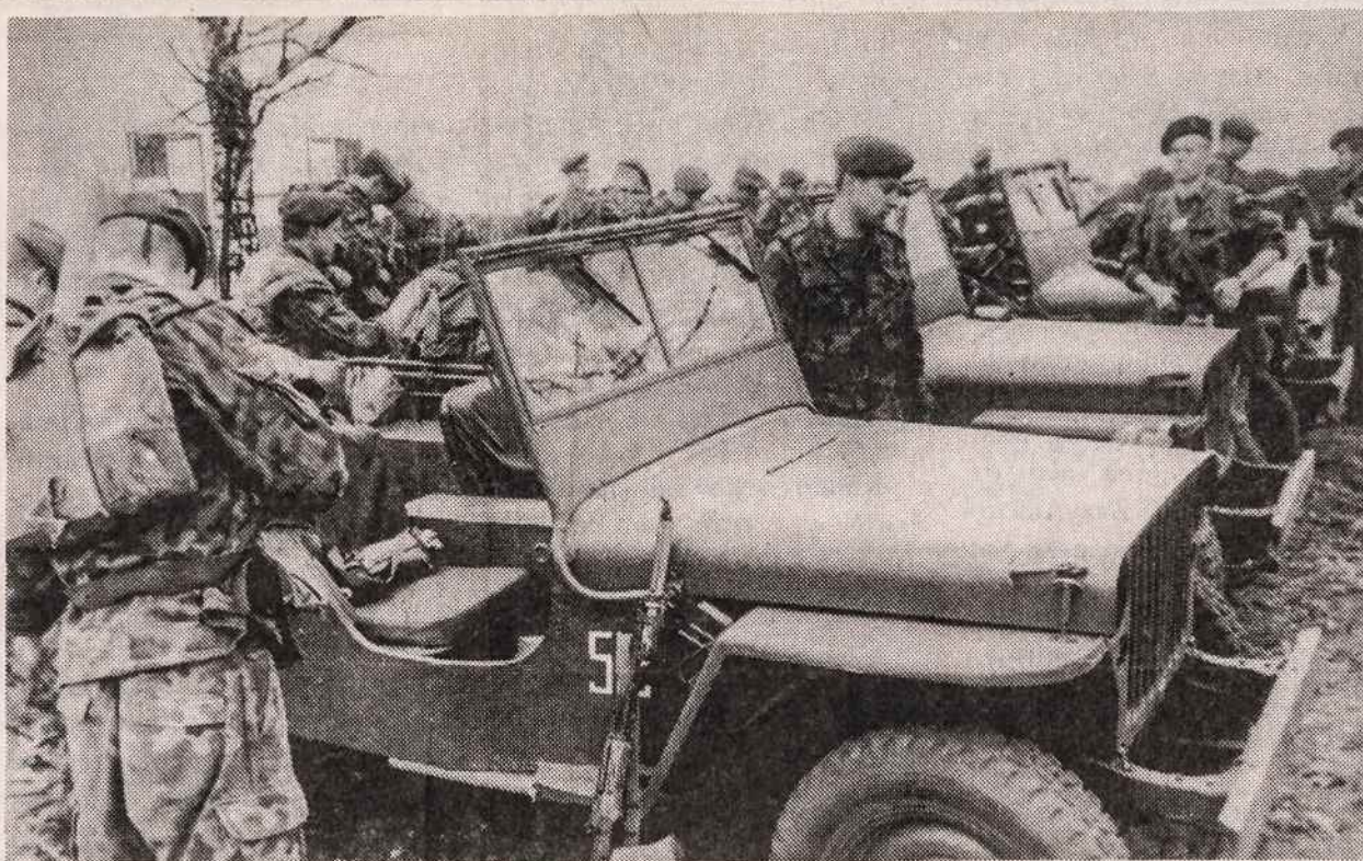
Lietuvos kariai susipažįsta su Prancūzijos dovanotais "džypais".

Dabar Europos Taryba išaugo iki 27 narių. Dvylika Tarybos narių sudaro Europos ekonominę bendruomenę, į ją įstoti ketina ir likusios 15 valstybių. Dvylikos šalių bendruomenė yra tikinė sąjunga, tuo tarpu Taryba yra kur kas platesnių horizontų. Jos pagrindinis tikslas yra suvienytos Europos vizija: bendrai puoselėti europietiškos kultūros paveldą, bendrai rūpintis savo tapatybės išsaugojimu ir savo ateitimi.