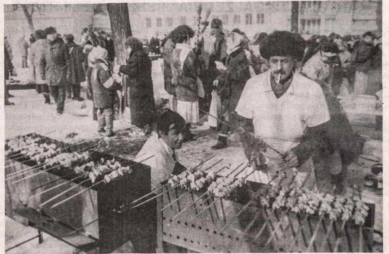
Vilniaus senamiestyje kepami "šašlikai" jau kainuoja per 200 talonų.