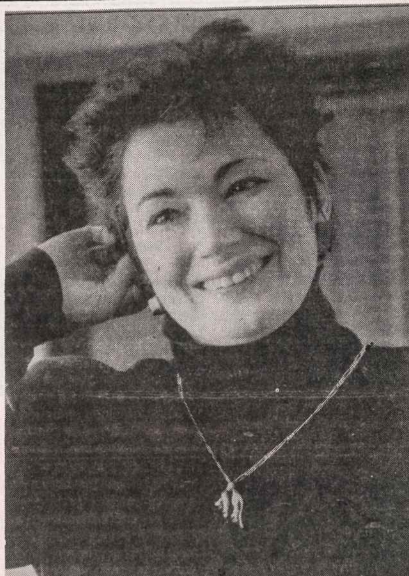
Metropolitan operos solistė Carol Vaness.