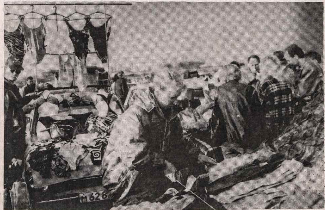
Gariūnų turgavietėje prekės žymiai pigesnės negu Vilniaus valiutinėse parduotuvėse.