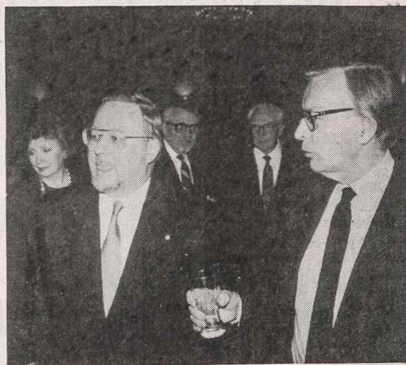
Vytautas Landsbergis su Lietuvos ambasadoriumi Stasiu Lozoraitiu balandžio 28 d. Washingtone, pagerbiant Landsbergį specialioje vakarieneje.

Konferencijos metu Landsbergis darė pranešimus apie demokratijos vystymąsi Lietuvoje, dalyvavo simpoziumuose bei di-