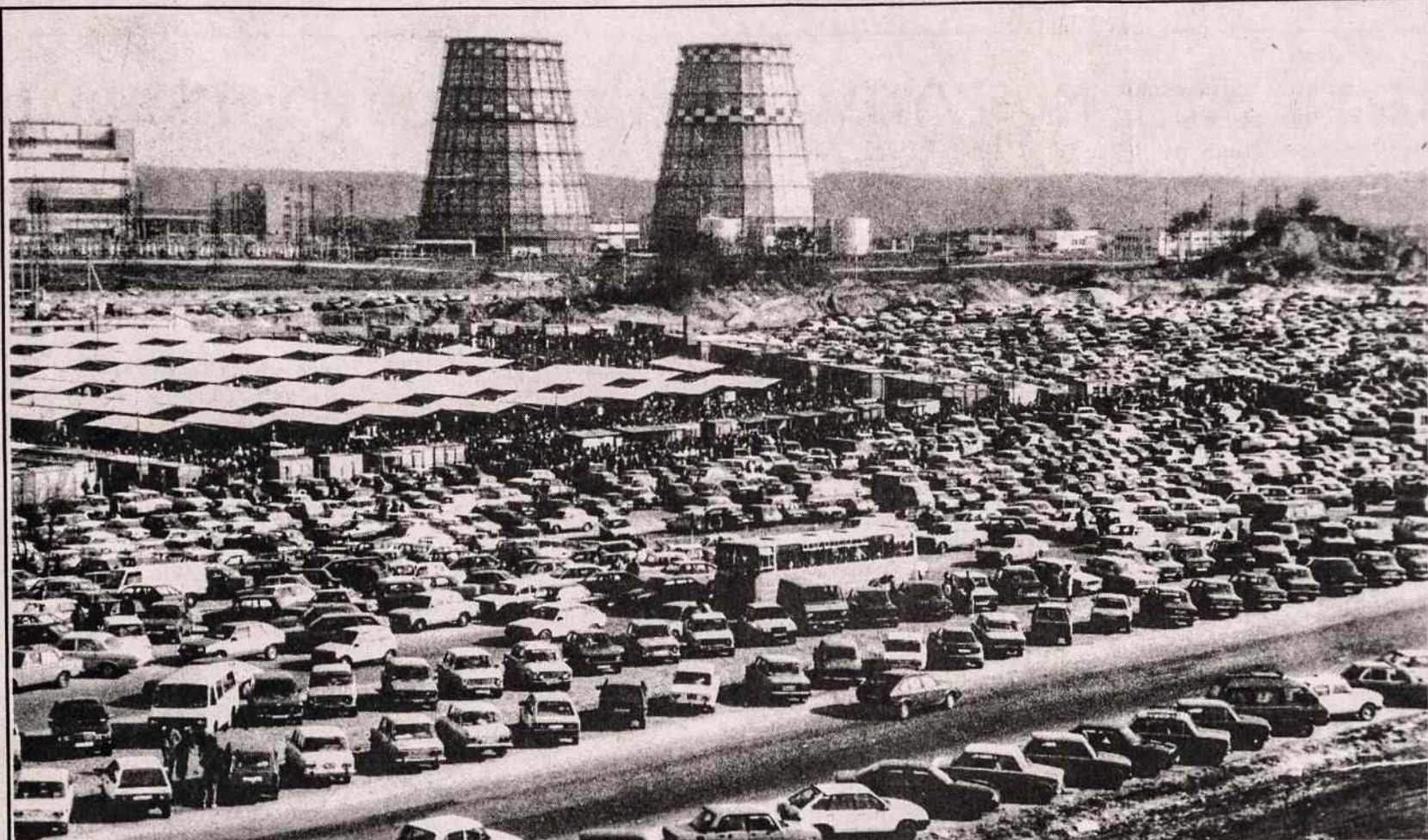
Netoli Vilniaus esančio garsiojo Gariūnų turgaus dalis. Apie šį turgų rašo Alfonsas Nakas "Darbininko" šio numerio trečiame puslapyje, atkarpoje.

Konferencija pradama birželio 18 d., penktadienį, susi-