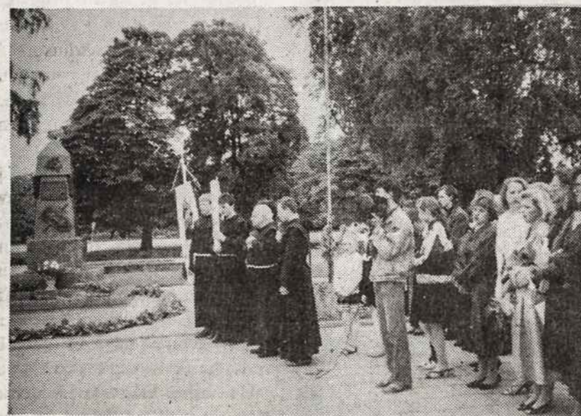
Po iškilmingo minėjimo dalyviai atžygiavo prie atstatyto laisvės paminklo.