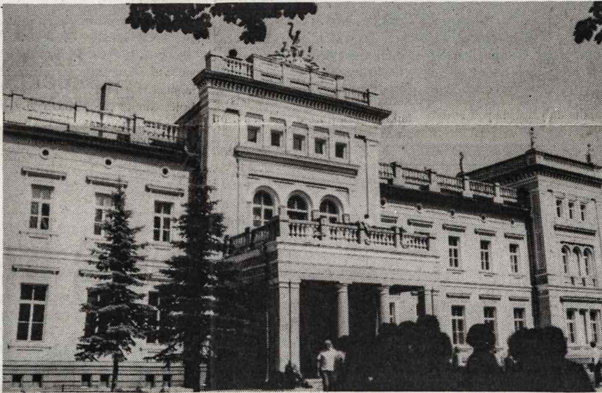
Kunigaikščio Mykolo Oginskio rūmai Plungėje.