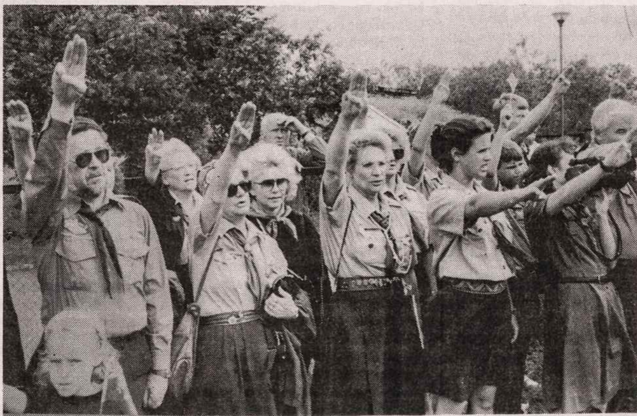
Dalis skautų jubiliejinėje 75-mečio stovykloje Palangoje