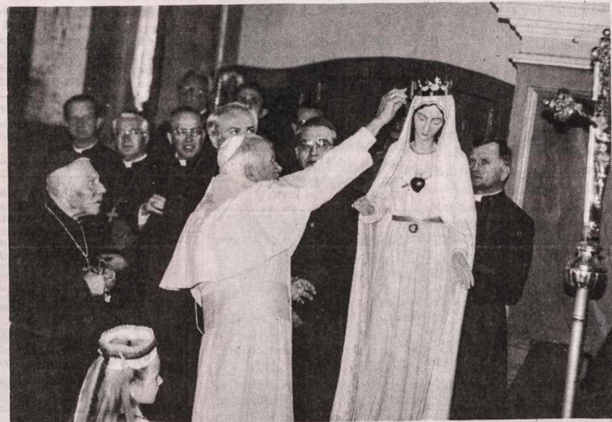
Popiežius Jonas Paulius II Šiluvoje rugsėjo 7 d. apvainikavo Marijos statulą, kurią atvežė Amerikos Lietuvių Kunigų Vienybės atstovai.