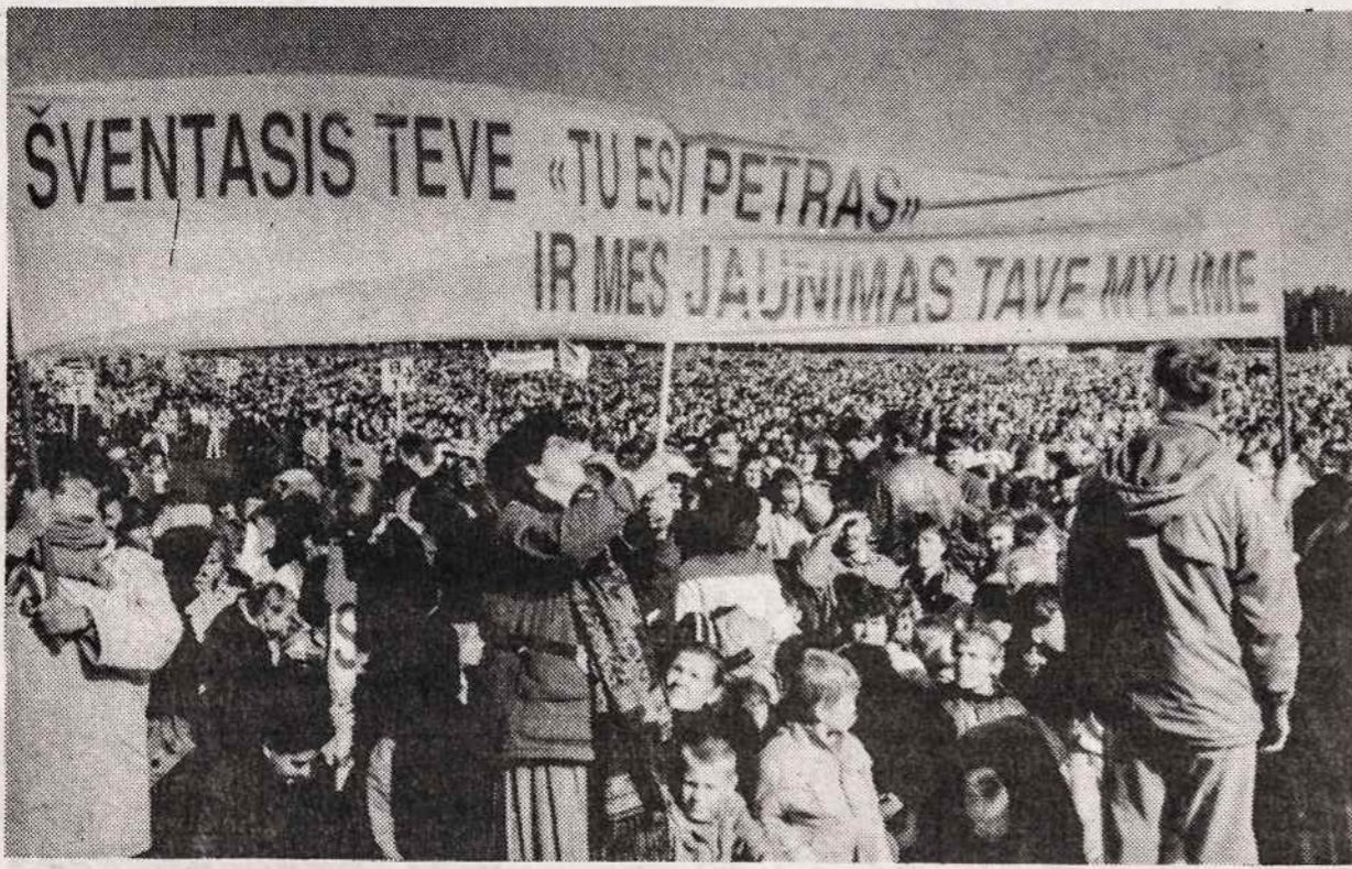
Žemaičių minia prie Kryžių kalno pasitinka popiežių Joną Paulių II.