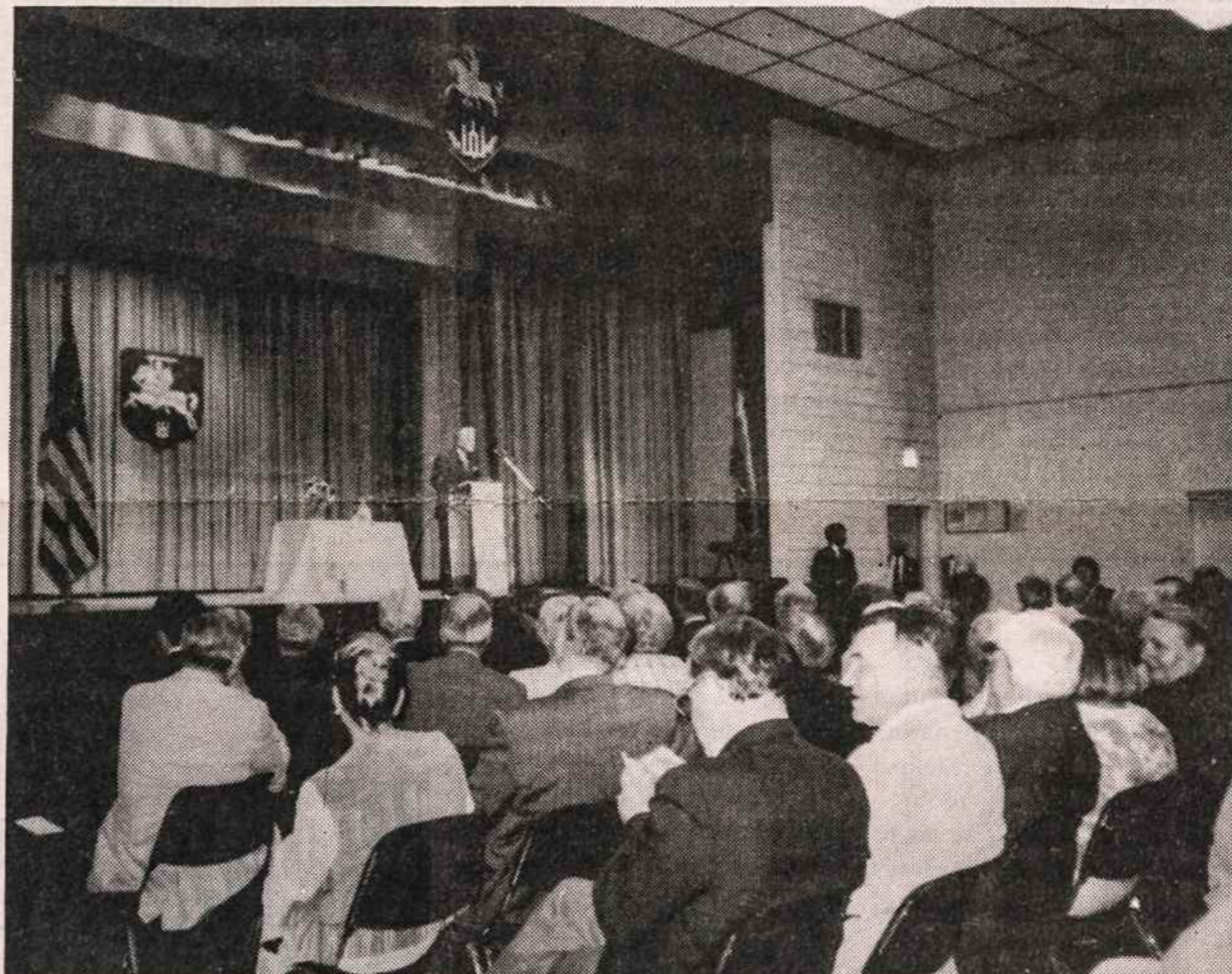
Lietuvos Prezidentas Algirdas Brazauskas kalba New Yorko ir apylinkių lietuviams Kultūros Židinio salėje.

Tenka pabrėžti, kad prieš propagandiniai organai ir reicinga emigracija stengiasi panaudoti antitarybiniais tikslais vadinamąją katalikų padėtį respublikoje. Jie kartu su Vatikanu ruošia ir vykdo priešiškas propagandines akcijas, kurios turi priešpriešinti tikinčiuosius mūsų valstybės ir partijos politikai, pastūmėti reakcinę dvasininkiją ir klerikalus kovai prieš socialistinę santvarką. Tai liudija kad ir toks faktas: atvažiavę iš užsienio korespondentai visada domisi katalikų padėtimi ir iškreiptai