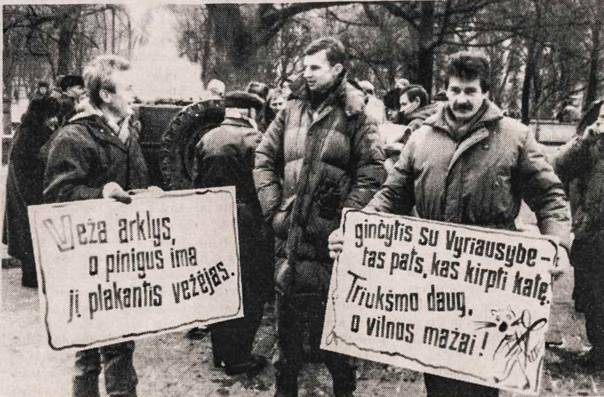
Žemdirbių demonstracijos prie Vyriausybės rūmų Vilniuje detalė.