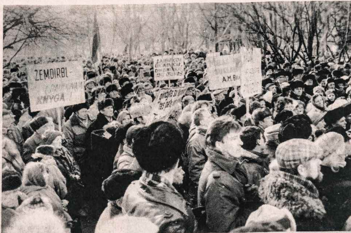
Nepatenkinti žemdirbiai masiškai demonstruoja Vilniuje.