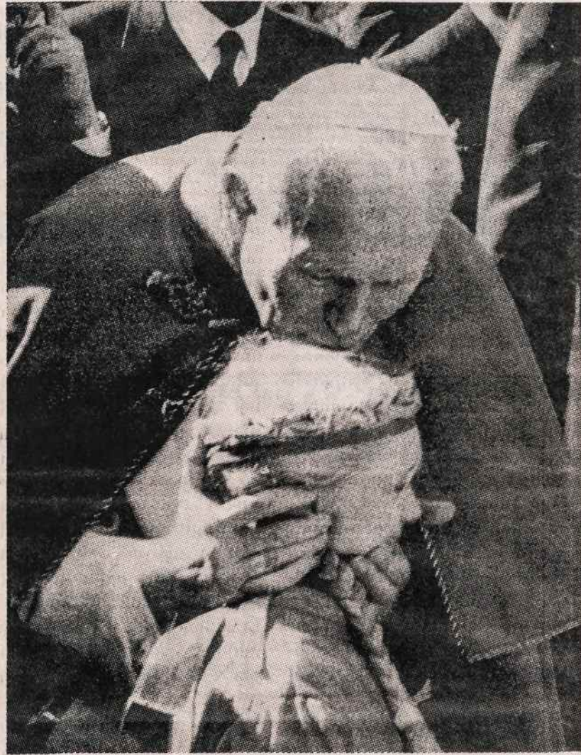
Popiežius Jonas Paulius II rugsėjo 4 d. Vilniaus aerouoste sveikina Lietuvos atstovę.