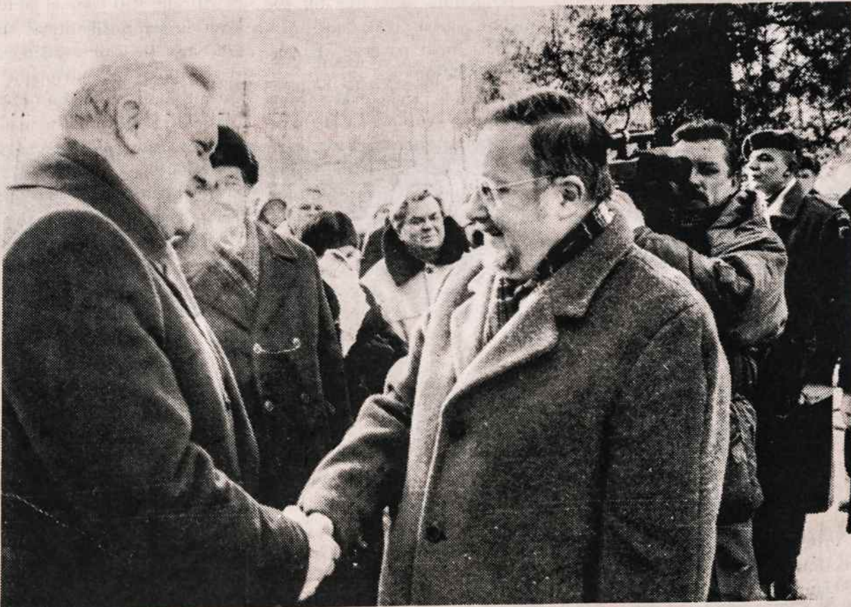
Kai lyderiai susitinka ne politinėje arenoje, bet neutralioje vietoje — kapinėse. Vasario 16 d. Vilniaus Rasų kapinėse, padėjus vainikus prie dr. Jono Basanavičiaus ir kitų nepriklausomybės veikėjų kapų, sveikina prezidentas Algirdas Brazauskas su Seimo opozicijos vadu prof. Vytautu Landsbergiu.