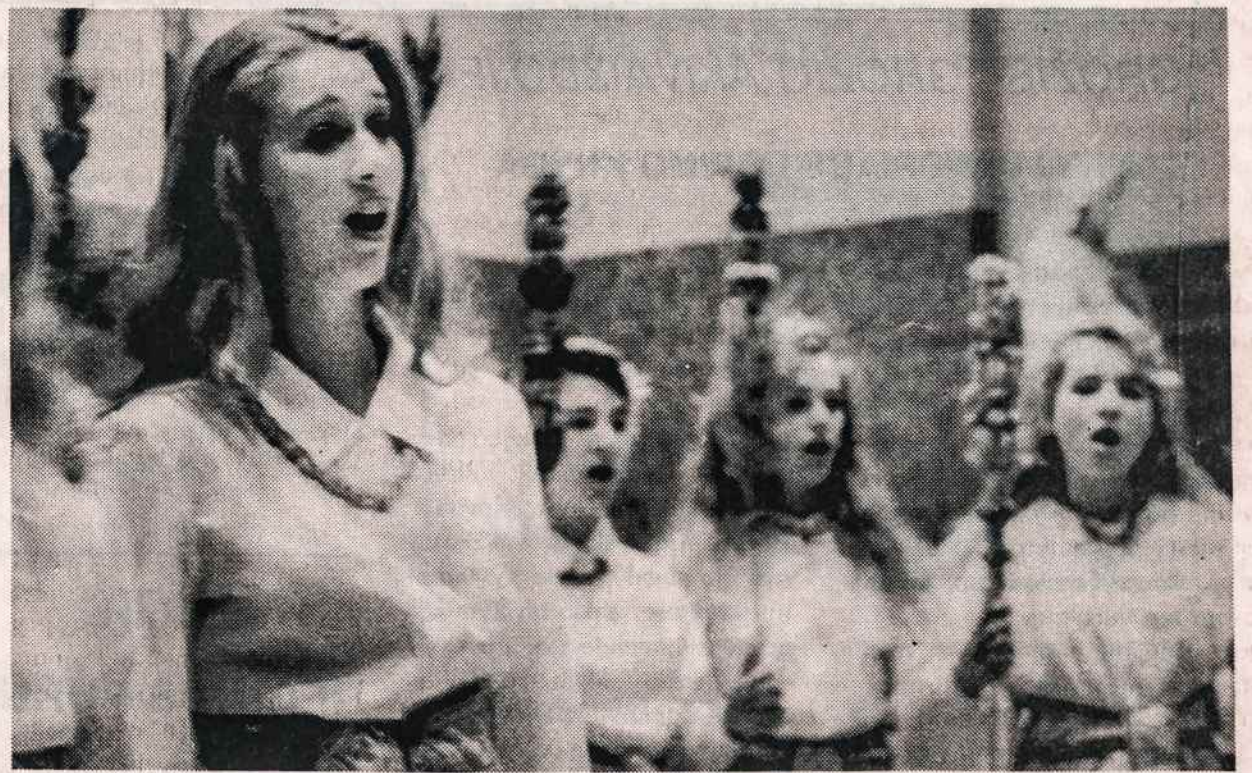
"Pastoralė", Kauno mergaičių sakralinės muzikos choras, atlikęs apie 30 koncertų JAV ir Kanadoje (taip pat ir New Yorke), grįžo į Kauną. dalis chorisčių koncerto metu.

Gražus spalvotas "Darbininko" kalendorius buvo išsiuntinėtis visiems skaitytojams gruodžio mėn. pradžioje. Kas dar jo negavo, prašom pranešti administracijai, skambinant telefonu (718) 827-1351. Dar yra likusių kalendorių; juos galima užsisakyti aukščiau duotu telefonu ar parašant laišką: "Darbininkas", 341 Highland Blvd., Brooklyn, NY, 11207. Kalendoriaus kaina $4.00. Daug skaitytojų užsisakė dar po keletą kalendorių, kad išsiųstų juos giminiams į Lietuvą.