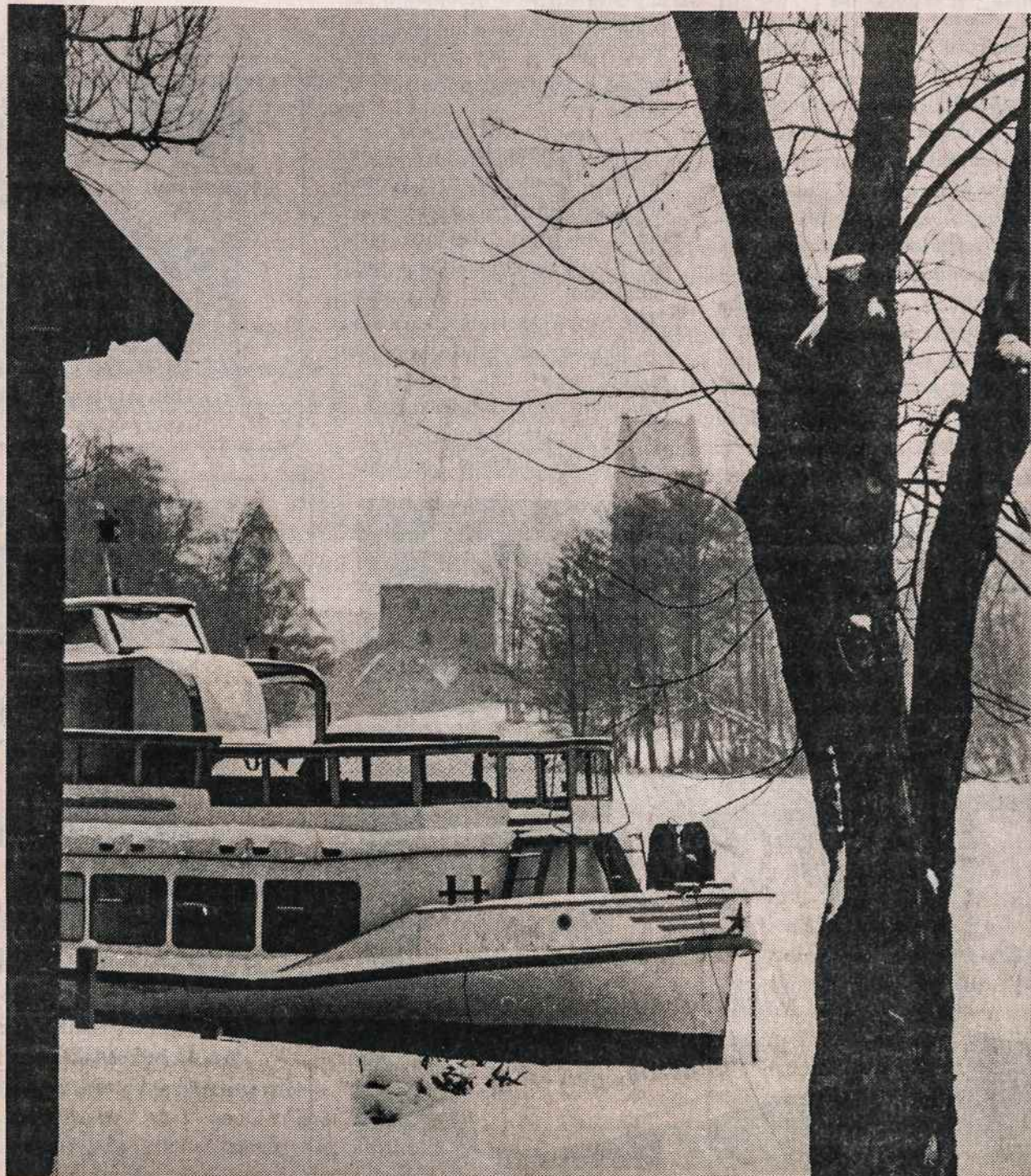
Trakų pilis ir Galvės ežeras laukia pavasario ir turistų.

Lietuvą turi burti Sąjūdžio dvasia, ir ne tik atsiminimų apie pirmąjį Sąjūdžio suvažiavimą dvasia, bet ir viltis, įžiebtą ketvirtajame - Sąjūdis gyvas, šiandien vėl reikalingas. Jis keliasi iš naujo.