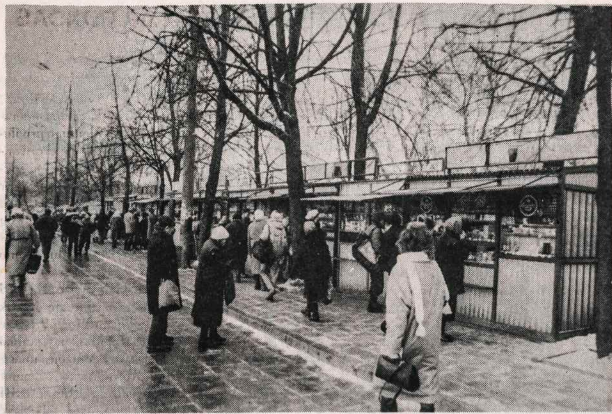
Privatų prekiautojų kioskai Vilniuje prie geležinkelio stoties.