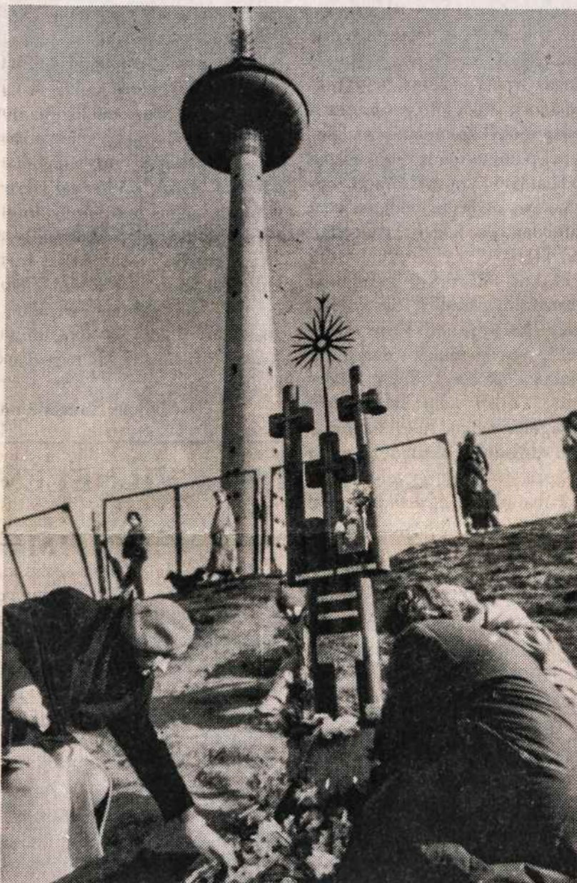
Pagerbiami žuvusieji prie Lietuvos TV bokšto 1991 m. sausio 13 d.

Teigiamas reiškinys yra tas, kad pedagogo A. Bartininko iniciatyva Černiachovsko (Įsručio) centrinėje bibliotekoje yra įsteigtas lietuviškos spaudos ir knygos kampelis. Žinoma, nors tai yra dar tik pirmoji kregždė, bet ir tai jau yra gerai. Dabar (nukelta į 4 psl.)