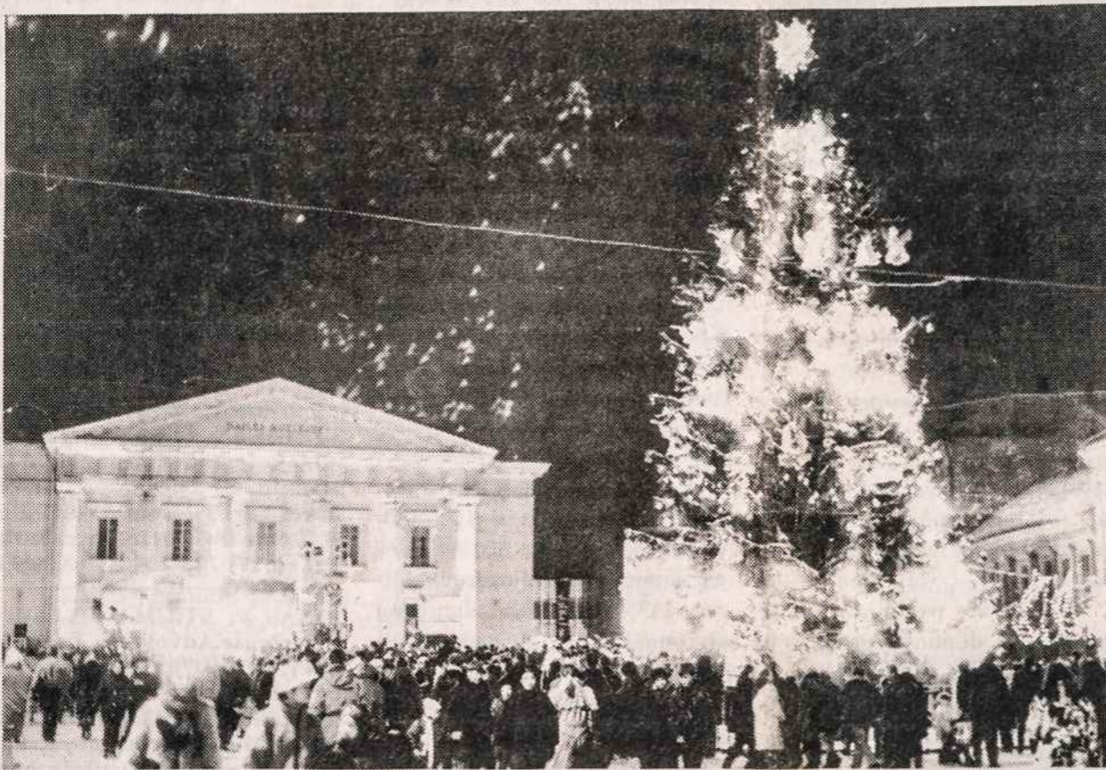
1993 m. Kalėdos ir Naujieji Metai Vilniuje pirmą kartą buvo švenčiami Rotušės aikštėje. Anksčiau pagrindinė Kalėdų eglutė ir linksmybės vykdavo Gedimino aikštėje prie arkikatedros.

-- Lietuvoje šių metų pradžioje buvo įregistruota daugiau nei 1500 masinės informacijos priemonių. Tarp jų - 680 leidinių, 457 laikraščiai, 235 žurnalai, 134 radijo ir televizijos kompanijos. Bendrą masinės informacijos priemonių skaičių padidina naujų agentūros, kino ir video studijų.