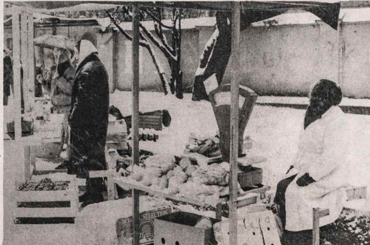
Vilniaus gatvėse bananų ir apelsinų galima nusipirkti ir žiemą.

— Klaipėdos gyventojų 92% pasisakė už mirties bausmę. Tai paaiškėjo iš Universiteto ir "Vakarų ekspreso" sociologinės apklausos. Daugumos klaipėdiečių nuomone, mirties bausmę reikėtų skirti už tyčinę žmogžudystę ir išprievartavimą.