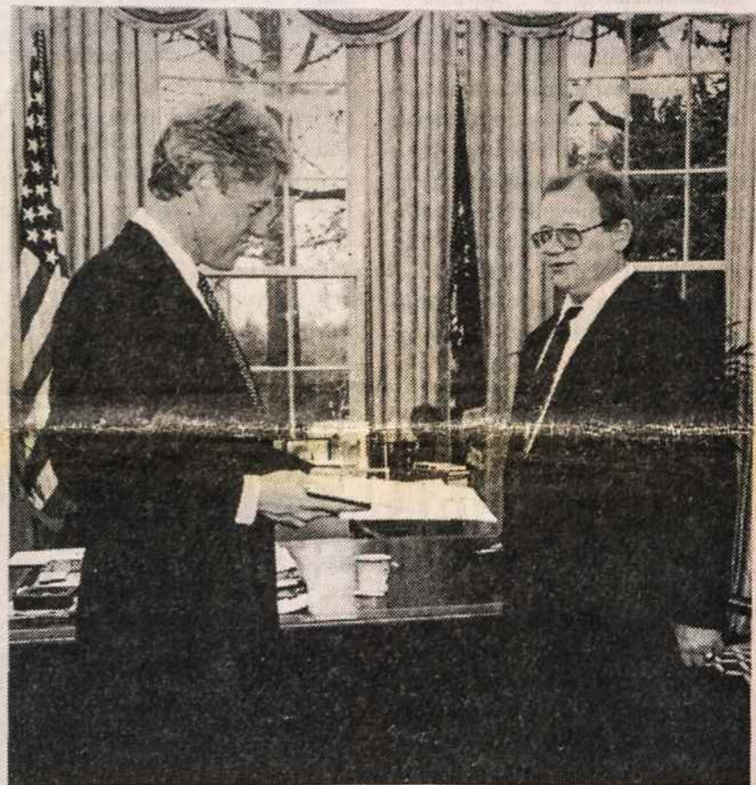
Dr. Alfonsas Eidintas, Lietuvos Respublikos nepaprastasis ir įgaliotasis ambasadorius Jungtinėse Amerikos Valstijose gruodžio 9 d., įteikė skiriamuosius raštus prezidentui W. J. Clinton.

nizacijas, tačiau vien tai nesuteikia jai saugumo garantijų.