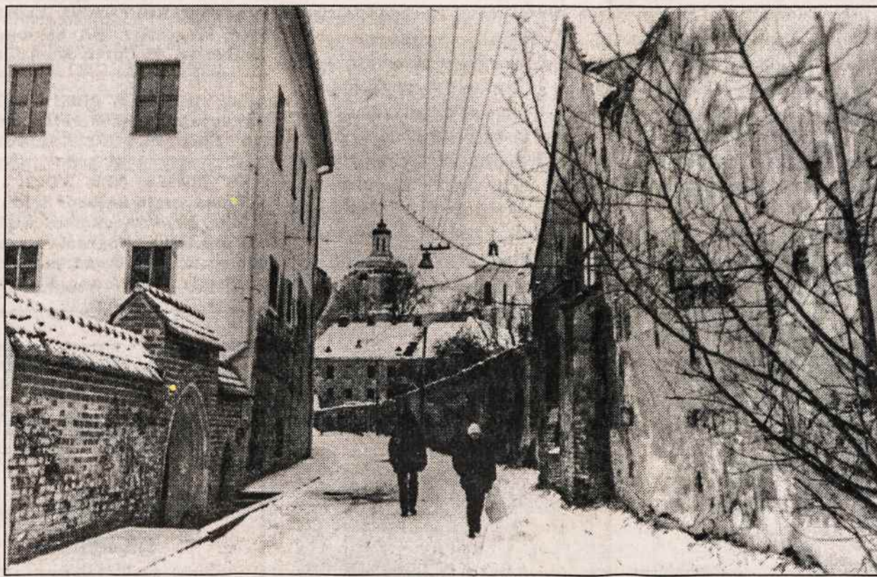
Vilniaus senamiestis. Šv. Ignoto gatvė.