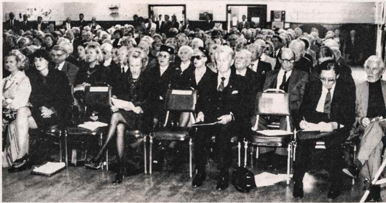
Los Angeles, CA, Vasario 16-osios šventės dalyvių dalis.