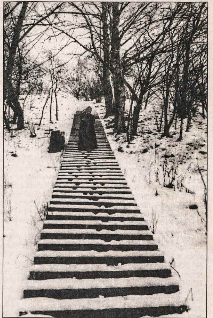
Merkinės piliakalnis vis dar pasipuošęs žiemos rūbu.

Šiuo metu Lietuvos visuomenėje ir Bažnyčioje išgyvename vertybių kaitą, Sąjūdžio, o po to ir Nepriklausomybės atgavimo laikui stengėmės akcentuoti šviesųjį Lietuvos (nukelta į 2 psl.)