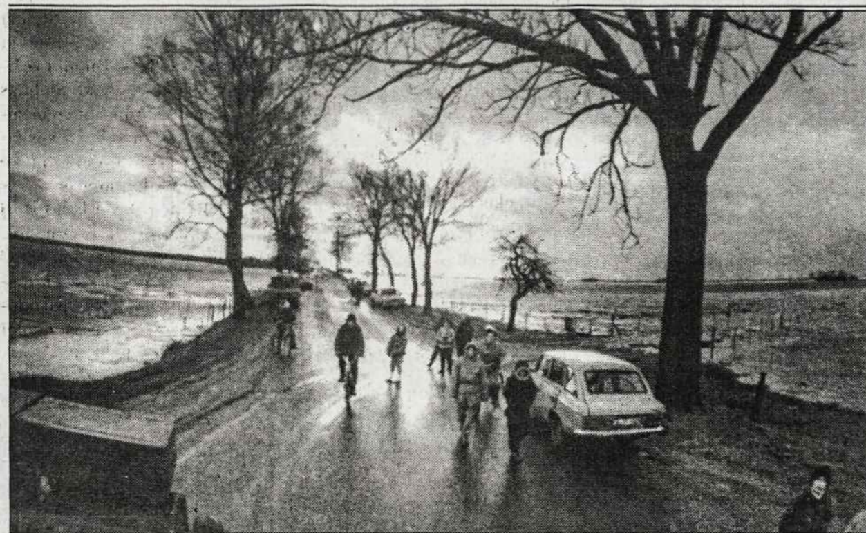
Potvynis Šilutės rajone. Kelias Šilutė-Rusnė apsemtas.