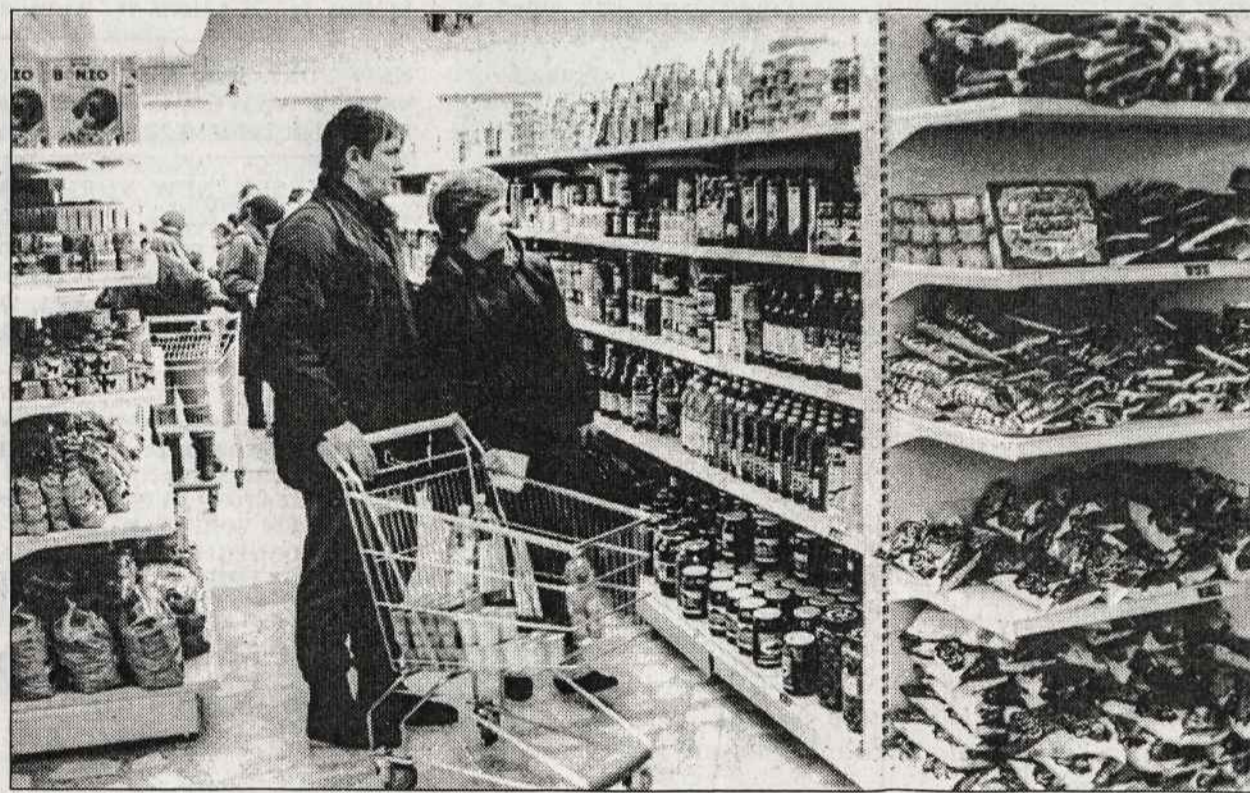
Pirmasis Vilniuje supermarketas "Pas Juozapą" neseniai atvėrė savo duris. Čia parduodama 4,800 pavadinimų prekių - nuo kepalėlio duonos iki skalbimo miltelių, veikia 40 vietų baras. Po "Juozapų" jau baigiamas įrengti 60 vietų restoranas.