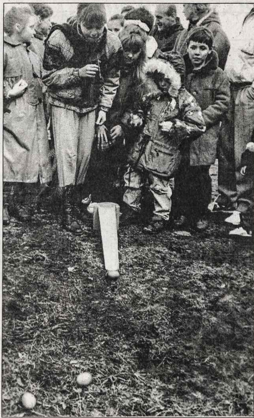
Vaikai švenčia Velykas Rumšiškių muziejuje.