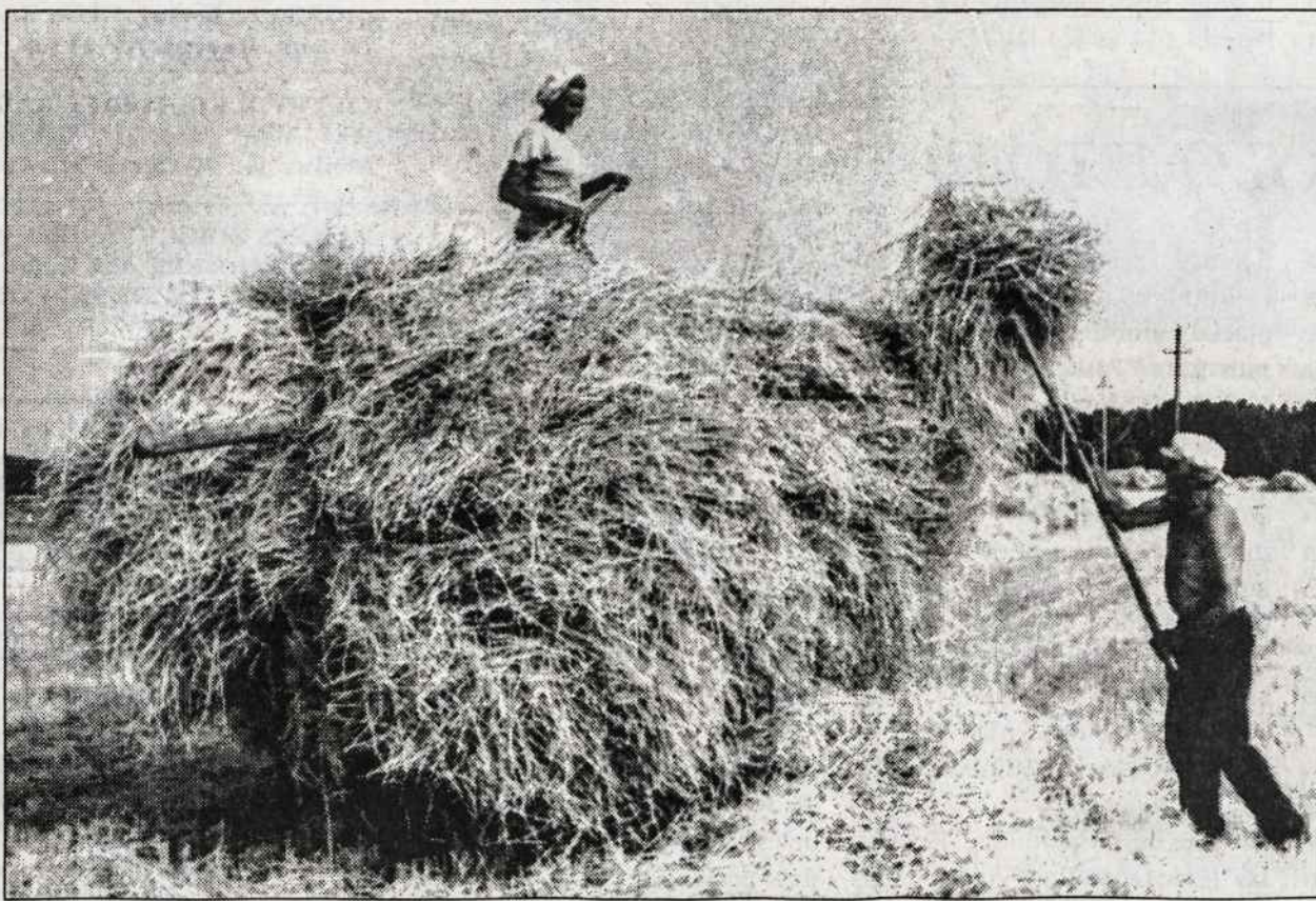
Šių metų javų pjūtė Viduklėje, Raseinių rajone.