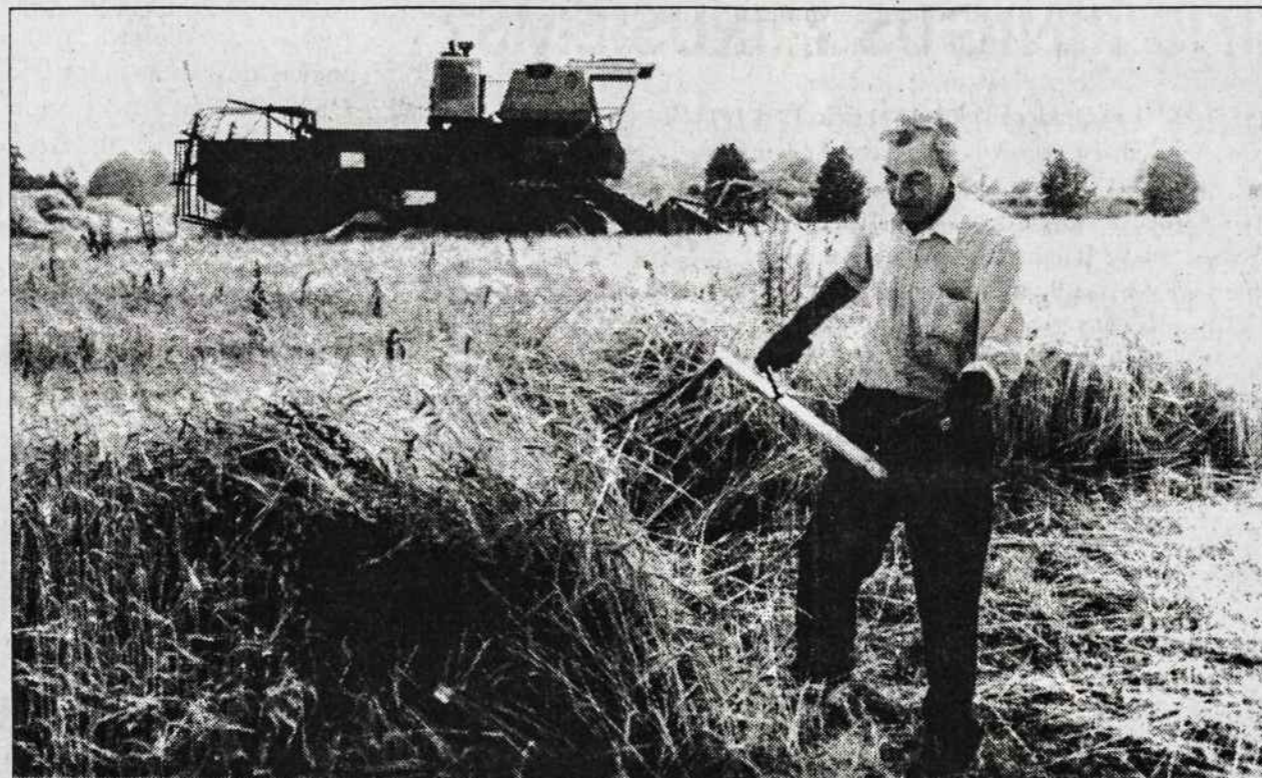
Ir su dalgiu, ir su kombainu... Dėl karščių šių metų rugiapiūtė prasidėjo anksčiau negu įprasta.

itakingas kardinolas Dei Monte. Jis ir jo broliai išgijo tokius dabar plačiai žinomus Caravaggio kūrinius kaip "Paskutinė vakarienė", "Šventasis Jonas Krikštytojas". Jiems priklausė ir drobė "Jėzaus suėmimas". Bet aštuonioliktojo amžiaus pabaigoje dėl Monte šeima nusigyveno ir jų dailės kolekcija, taigi ir Caravaggio kūriniai, buvo parduoti iš varžytinių. Didžiąją kolekcijos dalį nusipirko škotų didikas ir meno mylėtojas William Hamilton Nisbet. Jo kolekcija buvo laikoma Edinburge, Biel House pilyje. 1920 m. ir šis dailės rinkinys buvo išparduotas. Paveikslas "Jėzaus suėmimas", tada priskirtas Honhorstui, buvo parduotas už aštuonias gvinejas - labai men-