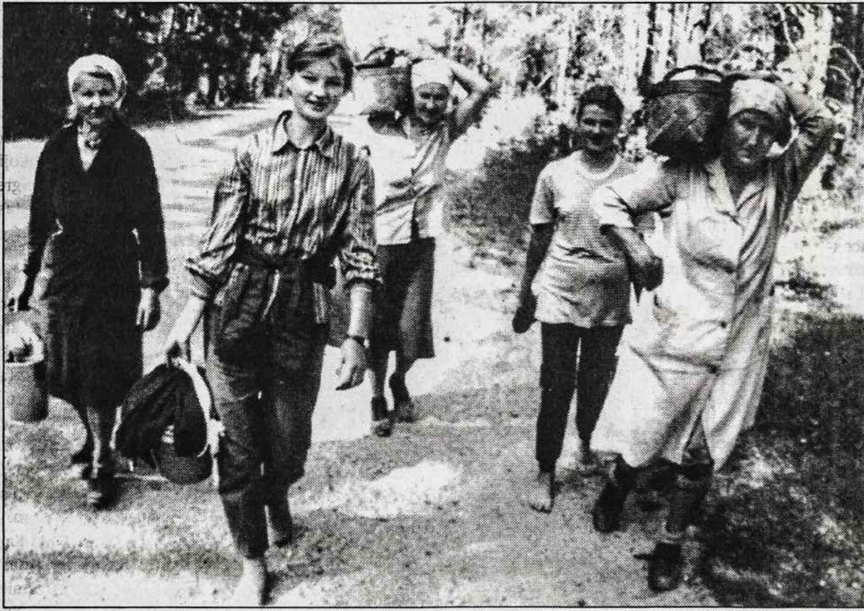
Ignalinos rajone uogautojos grįžta namo. Jos nuo ryto 7 val. iki 4 popiet surenka po 4-5 kilogramus mėlynių ir parduoda jas po 2.60 lito už kilogramą.