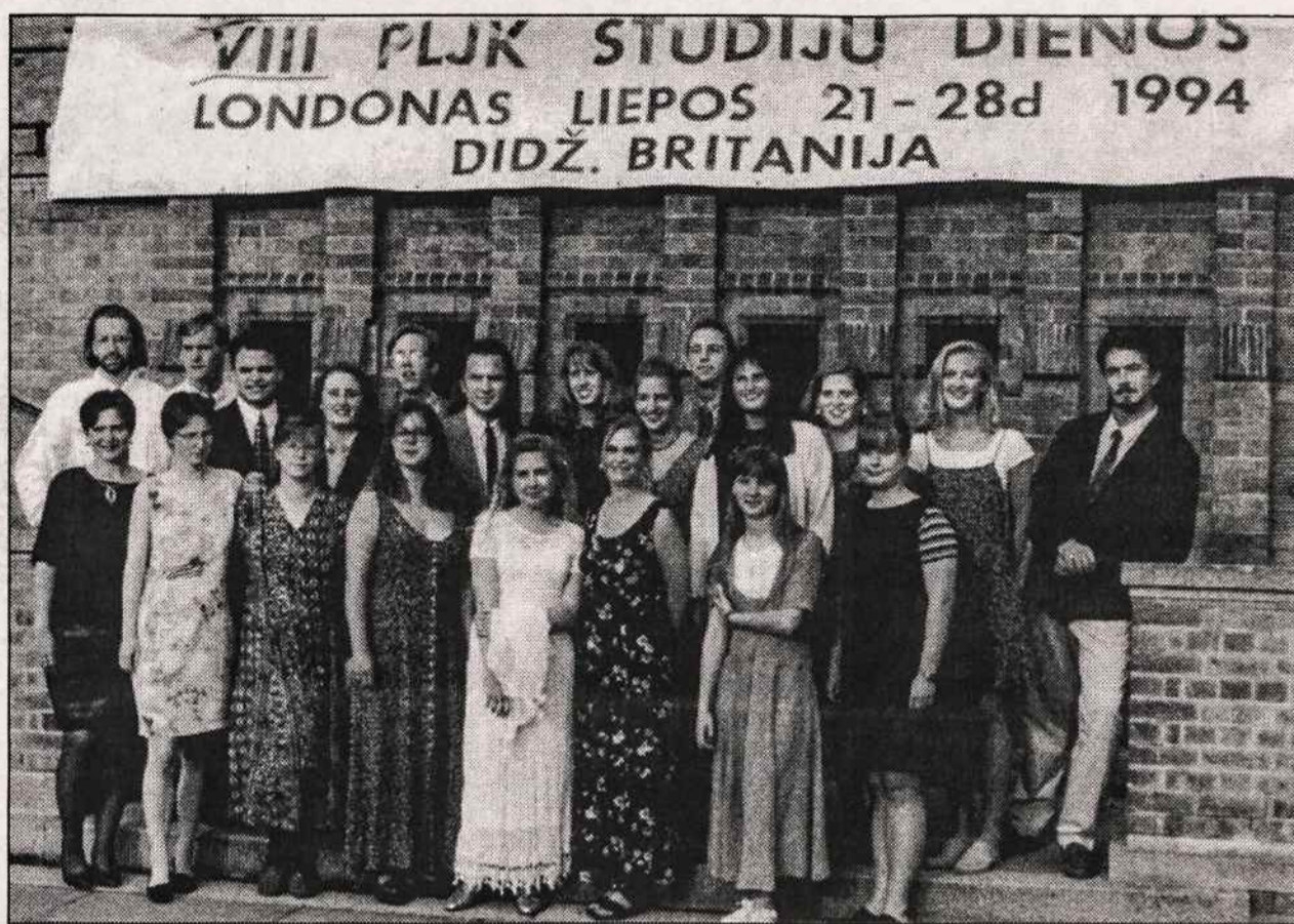
Buvusieji Vasario 16-osios Gimnazijos mokiniai VIII-ajame PLJ Kongrese Londone.