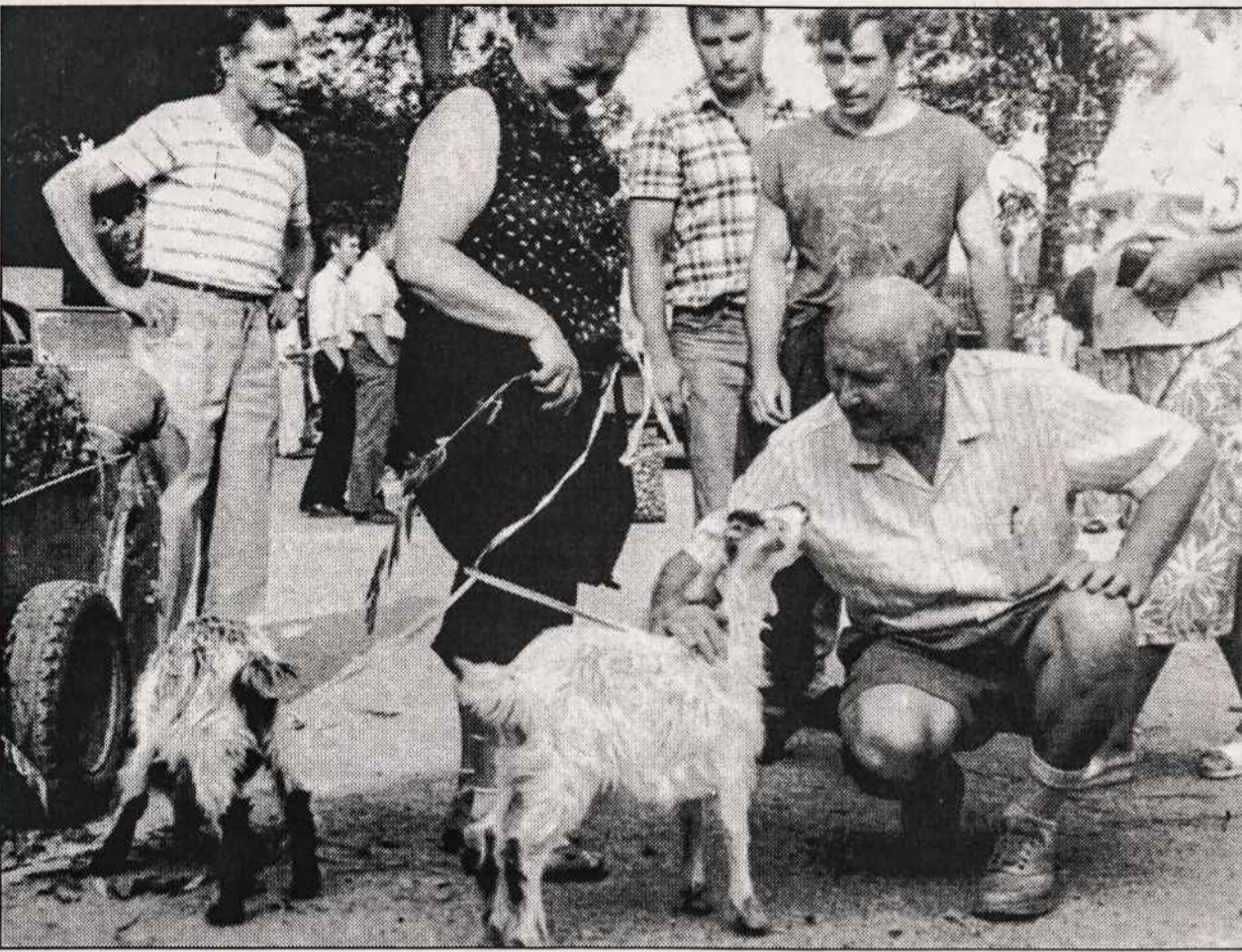
Kretingos turguje ožkos parduodamos po 60 litų.