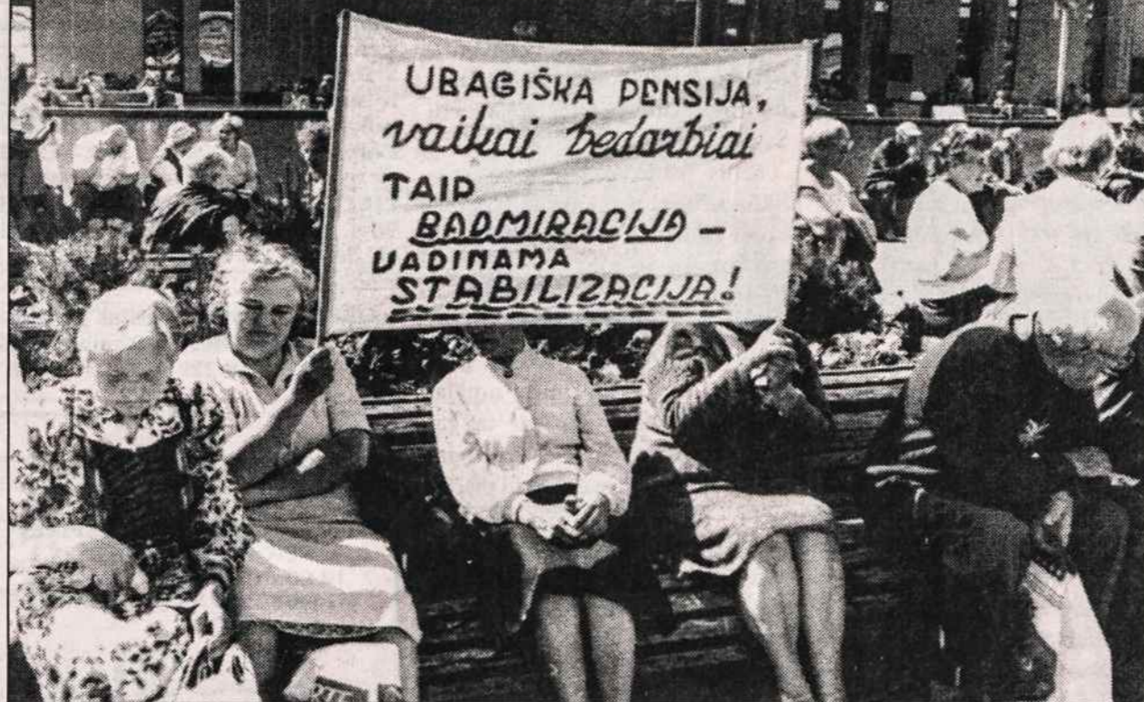
Prie Lietuvos Seimo darbininkai ir pensininkai piketuoją.

Kad prie redagavimo pridėta PLB vadovybės ranka, rodytu paskelbta nuostata, kad "Suvažiavimas patvirtina, jog dabartinės PLB valdybos veikla atitinka svarbiausius PLB tikslus ir uždavinius". Jei taip būtų, tai apie pagrindinius PLB tikslus ir uždavinius grupuotųsi visi "rezoliucijos" ir "nuostatų" paragrafai. Senovės romėnai sakydavo, kad esmė vedasi žodžius. Šiame dokumente žodžiai esmės neliudija. Užgiriama PLB valdybos veikla, bet už kokius nuopelnus, taip ir neaišku. Nutyliama "Lietuvių tautos kančių ir kovų" istorijos istorija. Gali tos knygos ir už jos pasirodymą atsakomingu žmonių apologetai iki nualpimo įrodinėti, kad tuo leidiniu padarytas geras, mažiausiai nekenksmingas darbas, bet tiesa yra kita. Iš tikro padaryta nebeatitaisoma žala. Kas uždraus Lietuvos priešams, sakykite, už 50 metų įrodinėti, remiantis PLB rankingomis išleistu dokumentų rinkiniu, kad Stalinu režimas vis tik buvęs žmoniškas?