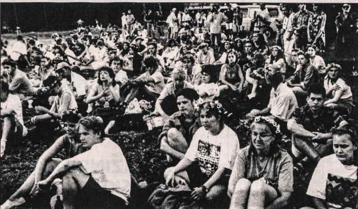
VIII-ojo Pasaulio Lietuvių Jaunimo Kongreso dalyviai vakaronės metu Trakuose.