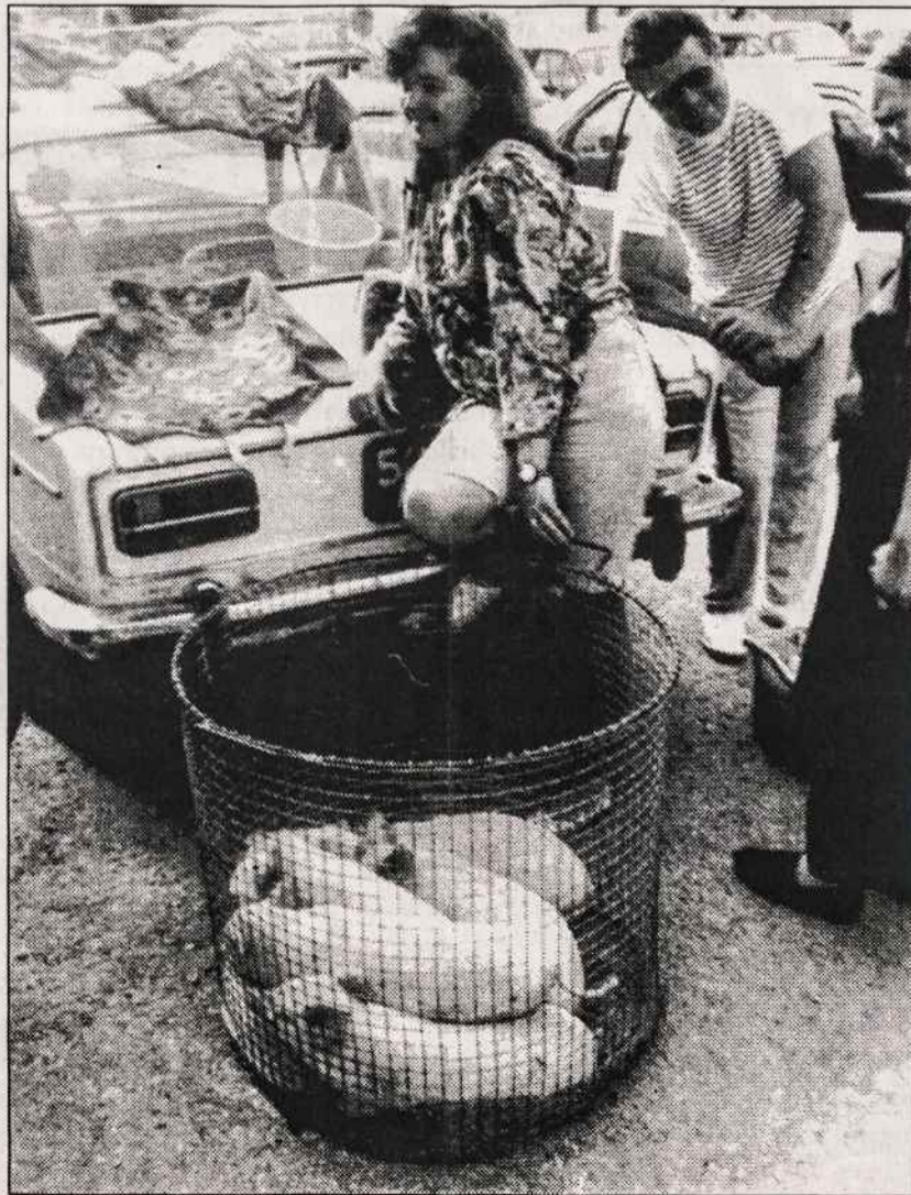
Kretingos turguje paršeliai kainuoja tiek pat kiek ir ožkos - po 60 litų.

is Prancūzijos ir Didžiąja Britanija, pranešė, kad iki rugsėjo pabaigos nauju maršrutu keliaus tik specialius kvietimus gavę asmenys, kurių yra keliasdešimt tūkstančių. Spėjama, kad normlus - be eilių ir be išankstinių rezervacijų - keleivinis eisimas po La Manche prasidės tik 1995 metų vasarą, kai praeis smalsumo euforija.