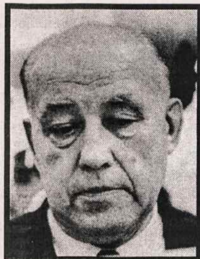
Jack Sharkey - Juozas Žukauskas

Jack Sharkey-Žukauskas , buvęs pasaulio sunkaus svorio bokso čempionas, seniausias žmogus turėjęs šį titulą, mirė rugpjūčio 17 d., trečiadienį, Beverly, MA, sulaukęs 91 metus amžiaus.