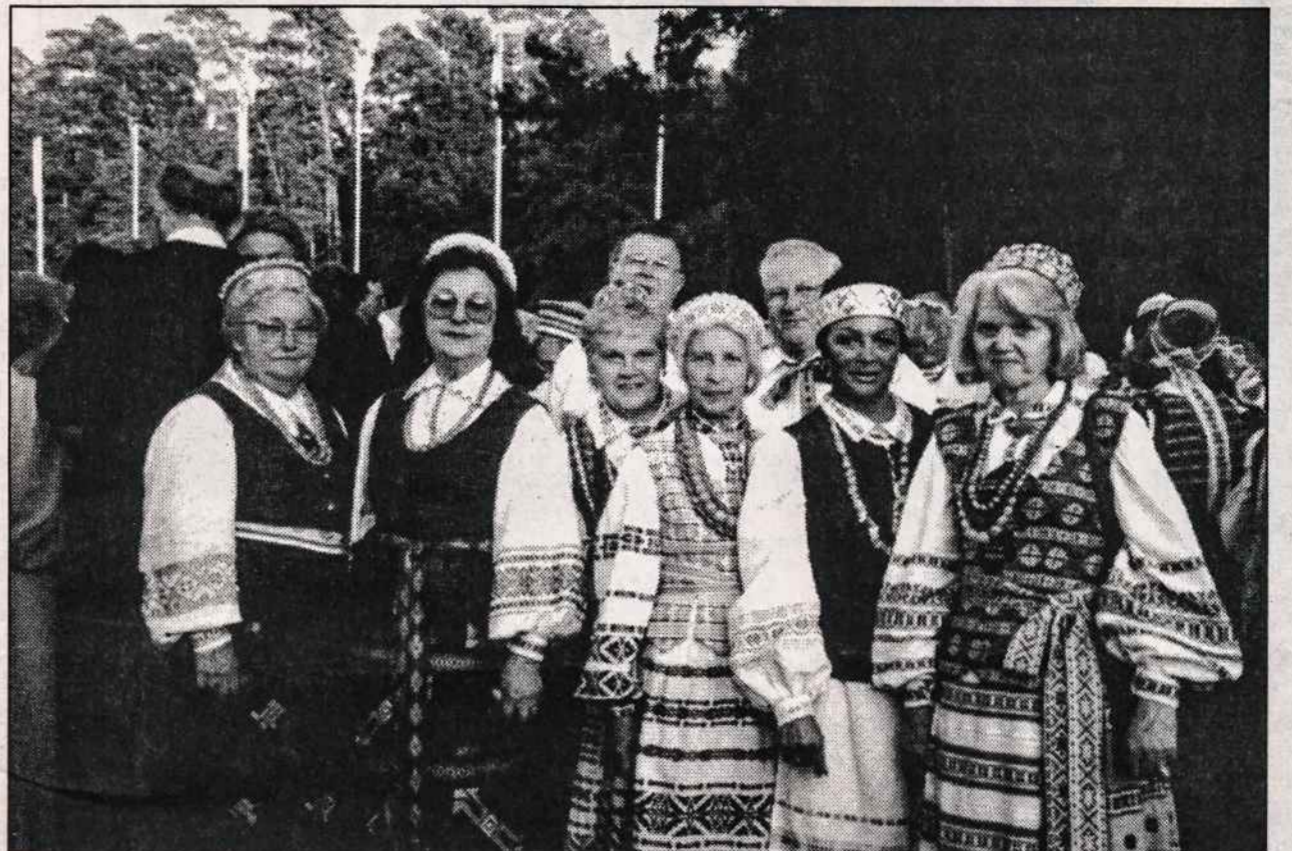
Smagios Dainų ir Šokių šventės akimirkos liepos 10 d. Vilniaus Vingio parke: dalis Brooklyno Apreiškimo parapijos choristų pertraukos metu.

Moterims siūlomi darbai amerikietiškoje šeimoje. Siūlo patikimą agentūrą. Moterims turi susikalbėti angliškai, mėgti vaikus, žinoti namų ruošos darbus. Skambinti tel.: (516) 377-1401. (sk.)