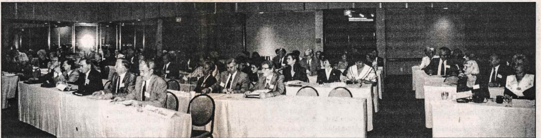
JAV Lietuvių Bendruomenės XIV Taryba susirinkusi posėdžiams rugsėjo 17-18 d.d. Sheraton viešbutyje, Washingtone.