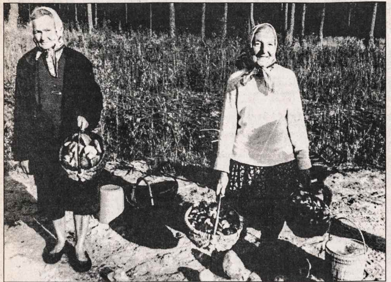
Šių metų rudenį grybautojos Dzūkijos miškuose, pardavusios per dieną surinktus grybus, uždirba iki 100 litų.

Lietuvos nepaprastasis ir igaliotasis ambasadorius Suomijoje Petras Auštrevičius įteikė skiriamuosius raštus Suomijos prezidentui Martui Ahtisariui.