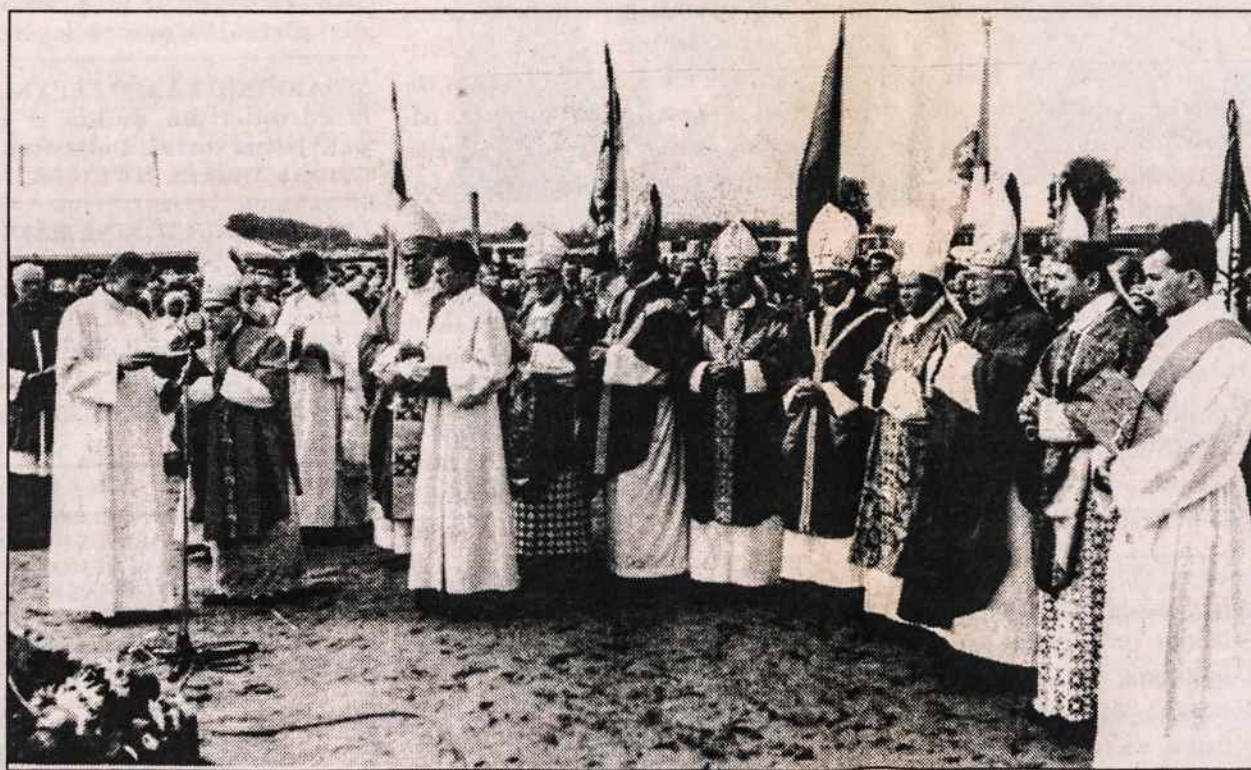
Visi Lietuvos vyskupai bei kardinolas Vincentas Sladkevičius, šventinant Popiežiaus kryžių Kryžių kalne, netoli Šiaulių, š.m. rugsėjo 18 d.

Lietuvos Kardinolas, Arkivyskupas ir Vyskupas