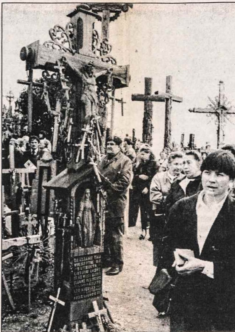
Los Angeles lietuvių kryžius, skirtas Lietuvos laisvei Kryžių kalne, netoli Šiaulių.

Jis labai daug pasitaravo, kai buvo verčiama Lietuvos Katalikų Bažnyčios Kronika į vokiečių kalbą. Daugiausia jam tenka patarnauti neseniai iš Lietuvos atvykusiems, kai reikia verstis visokiems dokumentais, rūpintis jų patvirtinimais.