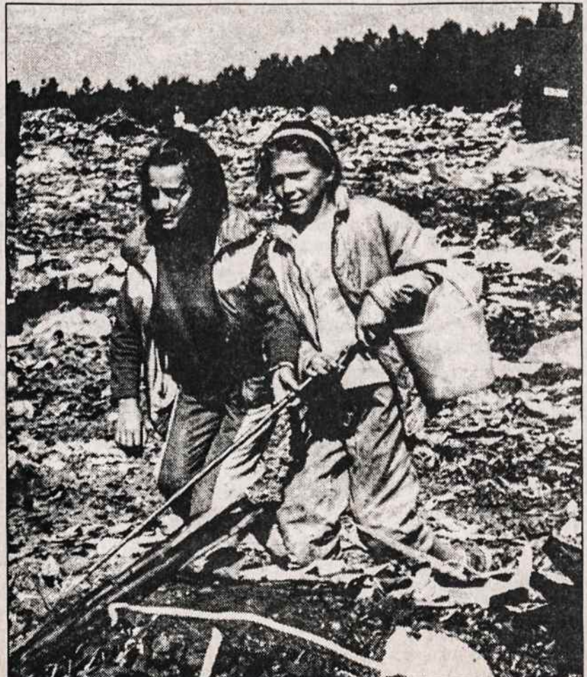
Vilniaus šukšlyne. Vaikai ieško daiktų įvairių firmų išmestose šukšlėse.

-- Lietuvos krikščionių demokratų partijos valdyba paskelbė rezoliuciją "Dėl partizanų kovų ir jų gyvybės aukos įamžinimo".