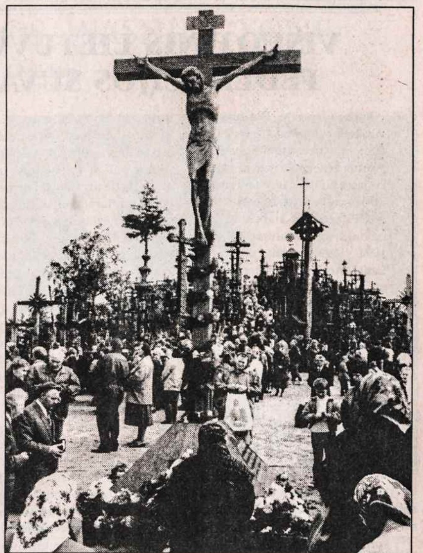
Popiežiaus kryžius Kryžių kalne pašventintas rugsėjo 18 d., minint Jono Pauliaus II apsilankymo Lietuvoje metines.