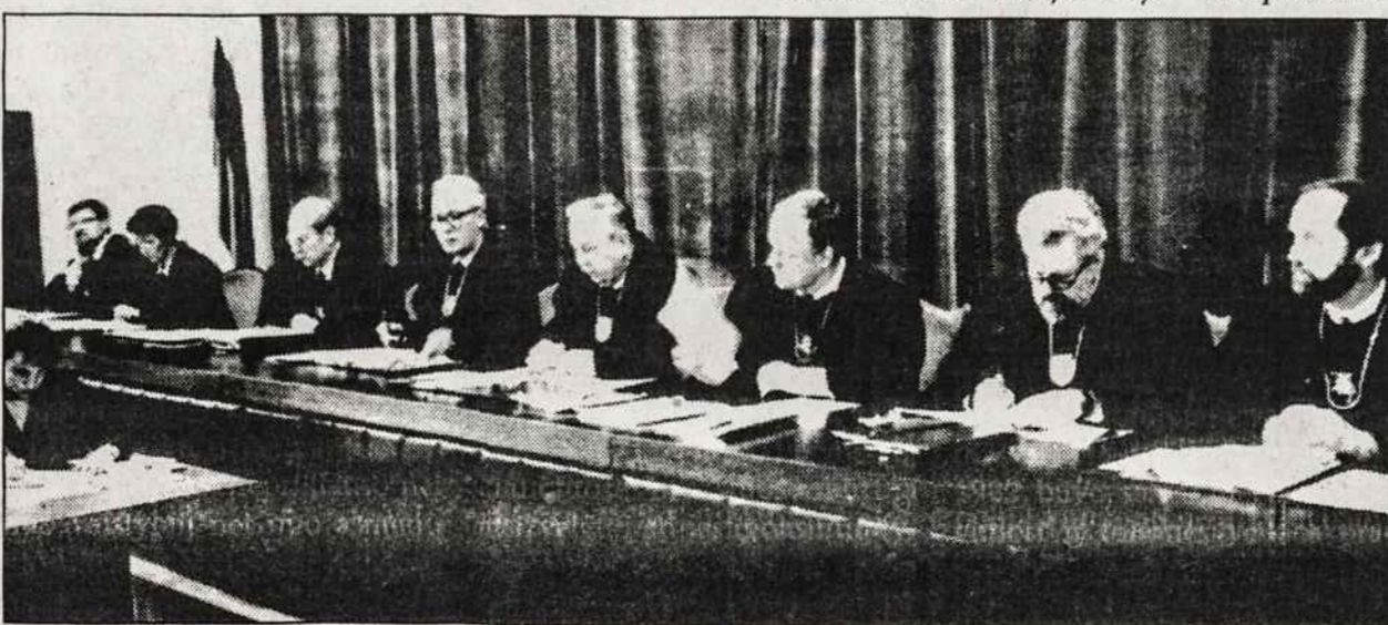
Lietuvos Respublikos Konstitucinis teismas.

Lietuvos nepriklausomybės gynimo Sausio 13-osios brolijos narys - korespondentas