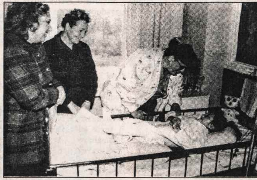
Chicago gydytojai po operacijos palatoje su jauna pacientė.