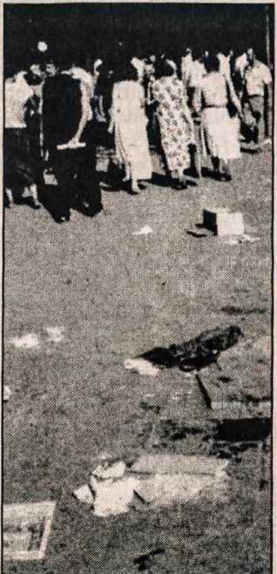
Kur dingio Vilniaus gatvių švara?