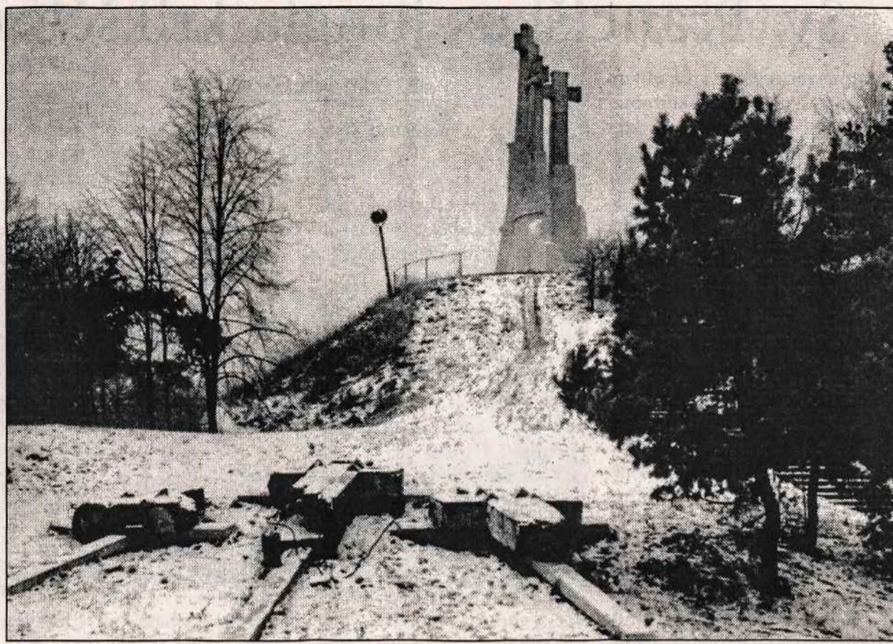
Trijų Kryžių kalnas Vilniuje žiema.

□ North Carolina Universiteto iš Chapel Hill mokslininkai paskelbė, kad elektros kompanijų darbuotojai, kurie kiekvieną dieną yra paveikiami stiprių magnetinių laukų, turi dvigubai didesnę tikimybę gauti smegenų vėžį negu tie, kurie yra retai jų veikiami. Rizika susirgti kramu vėžiu - leukemija - elektrikas yra du su puse karto didesnė negu dirbančiųjų, nepatenkančių į magnetinių laukų poveikį. Prancūzijos ir Kanados mokslininkų tyrimai taip pat parodė ryšį tarp magnetizmo ir vėžio ligų.