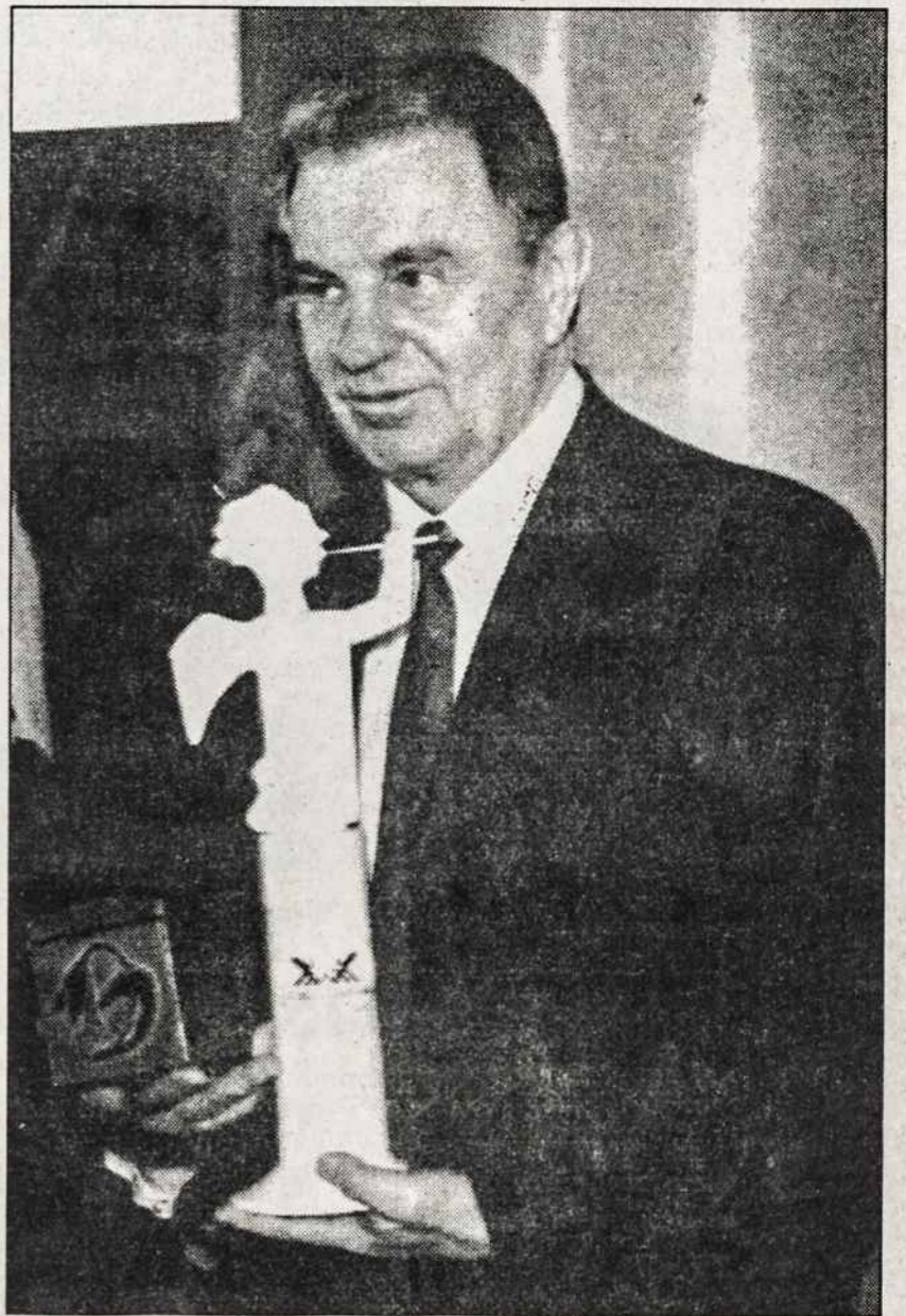
Poetas Justinas Marcinkevičius Vilniaus Rotušėje, apdovanojamas pirmąja Santarvės premija.