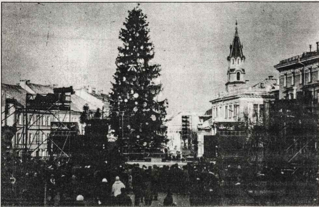
1994-ųjų metų Kalėdinė eglutė Vilniaus Rotušės aikštėje.