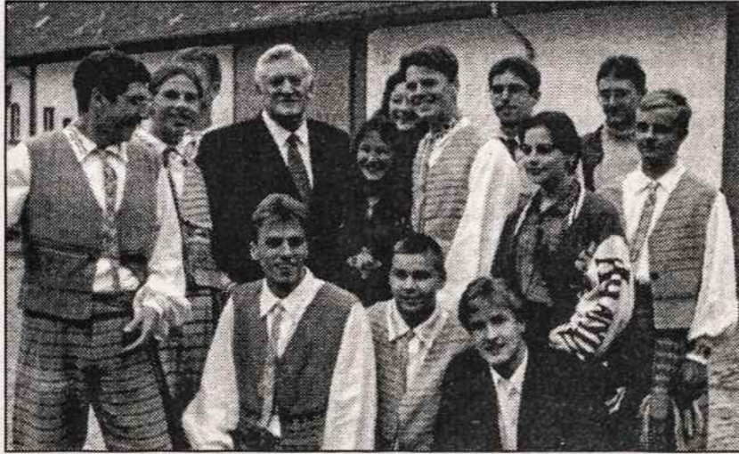
Lietuvos prezidentas A. Brazauskas kartu su Vasario 16-osios gimnazijos mokiniais Vokietijoje.