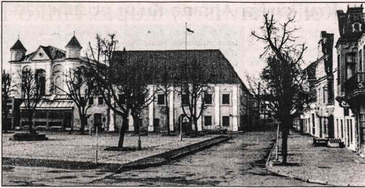
Kėdainių senamiestis.