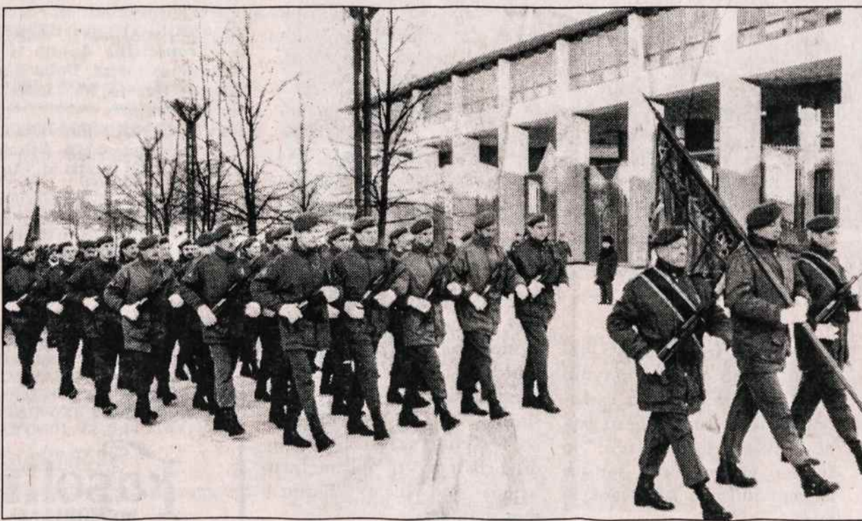
Lietuvos savanoriai, švėsdami savo ketverių metų sukaktį, žygiuoja prie Seimo rūmų.