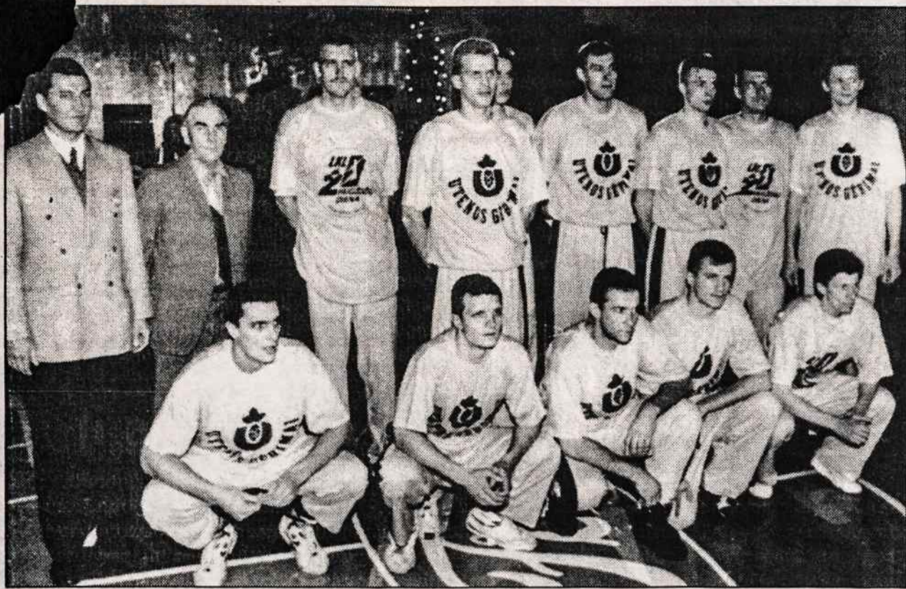
Lietuvos Rytų krepšinio rinktinė, laimėjusi Rytų ir Vakarų krepšinio žvaigždžių rungtynes Panevėžyje, vadovaujama Kauno "Žalgirio" trenerio Jono Kazlauskas (pirmas iš kairės).