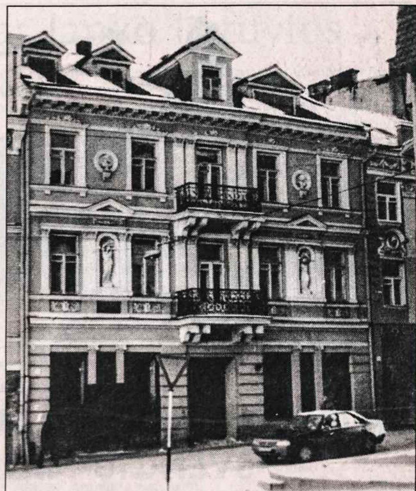
Namas Vilniuje, Pilies gatvėje, kur 1918 m. vasario 16 d. buvo pasirašytas Lietuvos Nepriklausomybės Atstatymo aktas.

O apie tai, jog buvo įvykdytas Holocaust, komunistai Sovietų (nukelta į 2 psl.)