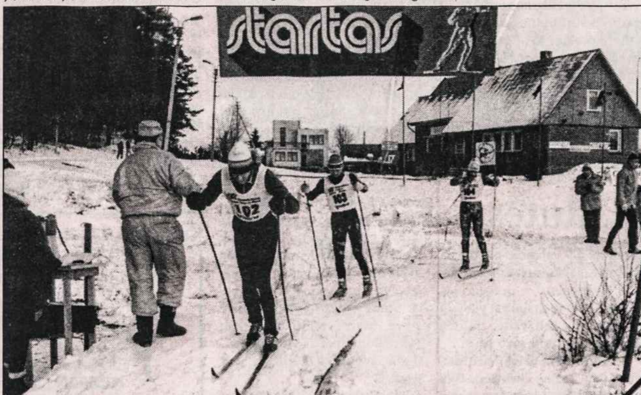
Ignalina - Lietuvos slidinėjimo sporto centras.