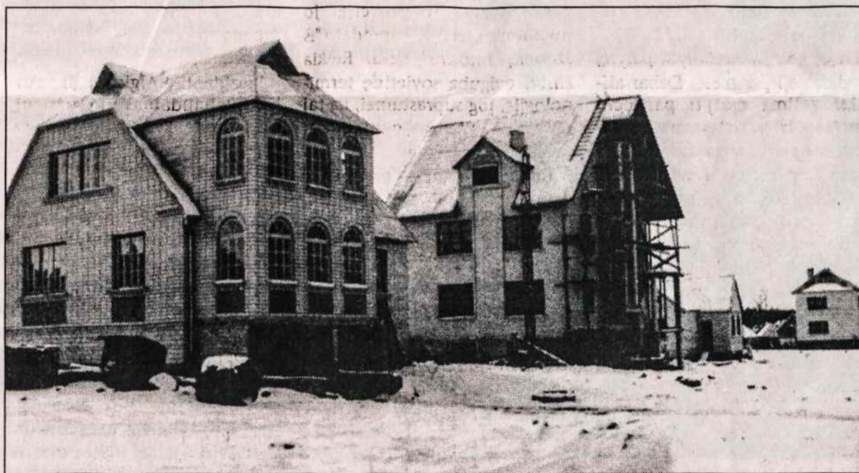
Nauji namai kyla Ignalinos priemiestyje.