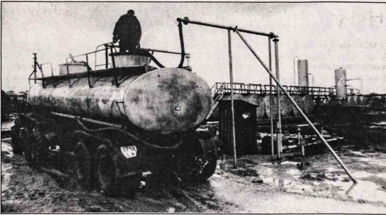
Lietuviška nafta, iš kurios gaminama aukštos kokybės alyva, teka Gargžduose.