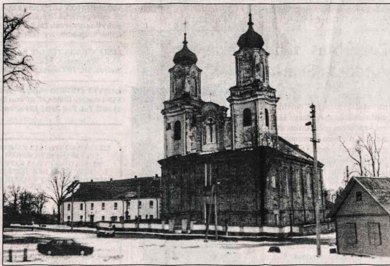
Dotnuvos bažnyčia ir vienuolynas.

-- Lietuvos skautų sąjunga vasario 25 d. Vilniaus Salomėjos Neries mokykloje surengė suvažiavimą. Pirmą kartą po beveik trijų metų pertraukos čia susirinko visi Lietuvos skautai. 1992 metais dėl kelių asmenų savavališko sąjungos statuto pakeitimo Lietuvos skautai suskilo į dvi priešingas stovyklas - viena pasiliko senąjį pavadinimą, o kita pasivadino Lietuvos skautija.