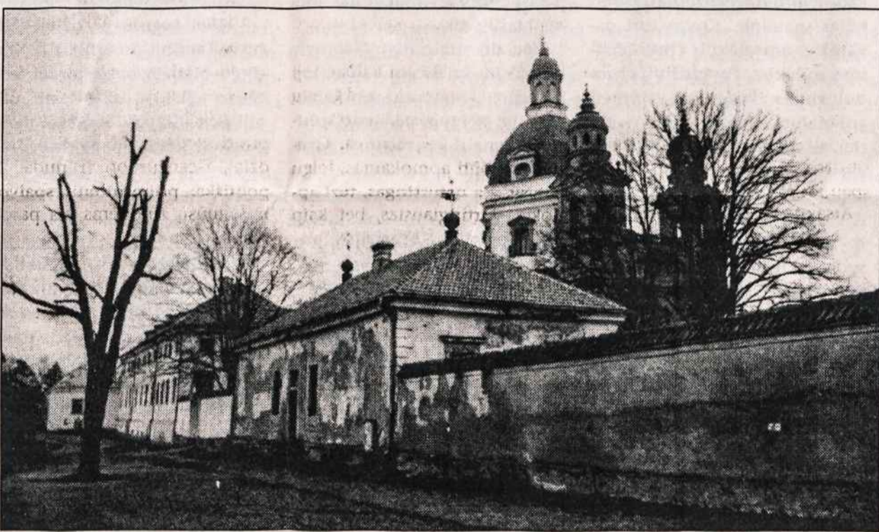
Pažaislio vienuolynas gražintas seselėms kazimierietėms.

— Miškotvarkos institutas Utenos miesto ir rajono gyventojams kaip kompensaciją už negražinamą žemę paskyrė 180 hektarų miško. Utenos, Leliūnų, Užpalių ir Vyžuonų apylinkėse. Visi 40 pretendentų to miško atsakė, nes jis itin prastas - pelkių lapuočiai ir krūmai. Teigiama, kad miškotvarkos specialistai rajone net nesilankė ir patys nežino, ką paskyrė.