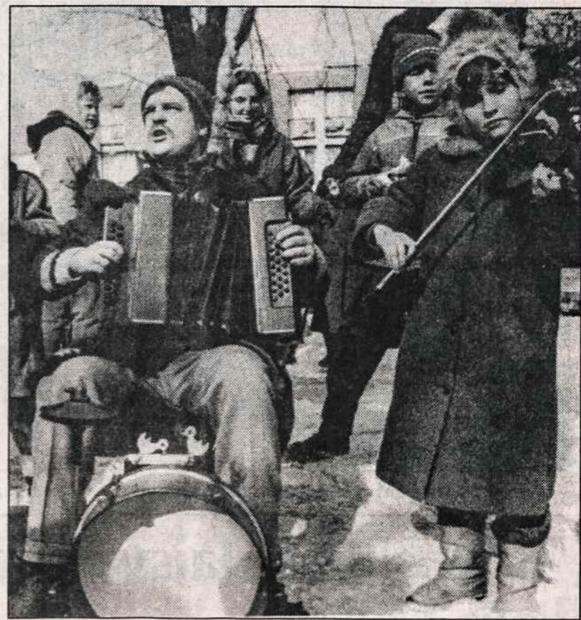
Linksmoji Kaziuko mugė vėl atkeliavo į Vilnių.

santykių istoriją, Lietuvos Prezidentas pažymėjo, kad blogai yra tai, jog aštrūs tarpusavio ginčai bei XX amžiaus pradžios įvykiai turėjo neigiamos reikšmės Lietuvos ir Lenkijos likimui. Tačiau naujausi įvykiai Europoje suteikia istorinę galimybę nekartoti lemtingų praeities klaidų. A. Brazauskas savo kalboje paminėjo, kad dabar Lietuvoje lenkų kalba leidžiami 7 laikraščiai ir 4 kiti periodiniai leidiniai, veikia radijo stotis "Znad Wilii", yra daugiau nei 25 lenkiškos organizacijos, 127 mokyklose dėstoma lenkų kalba. Daugiausia dėmesio Lietuvos Prezidento manymu, šiandien reikia skirti tolesniam prekybinio ir ekonominio bendradarbiavimo plėtojimui, turizmo skatinimui. Lietuvos ir Lenkijos sieną A. Brazauskas savo kalboje Lenkijos Seime pavadino nesusipratimu, kuris turi būti kuo greičiau pašalintas. Ji Lietuvos Prezidentui primenanti liūdno atminties Berlyno sieną, dalijusią Europą. Todėl ją turime pakeisti civilizuotas valstybes skiriančiais ženklais ir tik būtina kontrole, sakė jis. A. Brazauskas manymu, vertėtų parvestyti Lietuvos ir Lenkijos jungtinio taikos palaikymo bataliono įkūrimą, bendras oro erdvės ir jūrų sienos kontrolės galimybes. "Viktorijos" viešbutyje, kuris yra Lietuvos prezidento rezidencija jo vizito metu, A. Brazauskas surengė spaudos konferenciją.