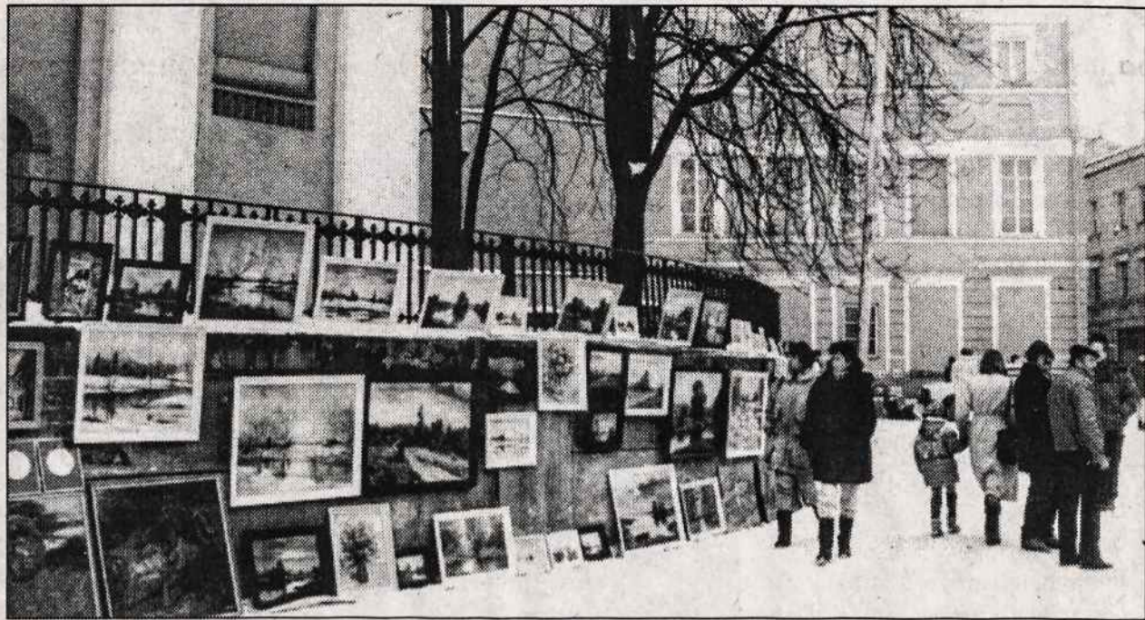
Vilniuje, Pilies gatvėje dailininkai parduoda savo paveikslus.