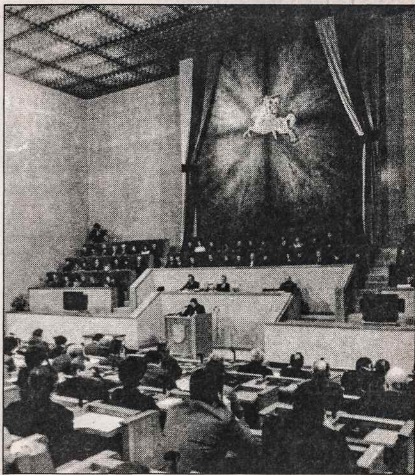
Lietuvos Seimo rūmuose 1990 m. kovo 11 d. buvo paskelbtas Lietuvos Nepriklausomybės Atstatymo aktas.

Ar ilgai tęsis šita ramybė? Europos Tarybos pareigūnas aną savaitę paguodė: dėl Baltijos kraštų mes daug griežčiau protestuotumėm negu dėl Čečėnijos. Rūsčiai pagrasintų pirštu (pažeistos žmogaus teisės!) ir vietoj 6 milijardų dolerių metinės paskolos paskirti 2 milijardus... JAV Atstovų rūmų komitetas pasiskubino išbraukti Baltijos šalis iš kandidatų į NATO sąrašą (nukelta į 2 psl.)