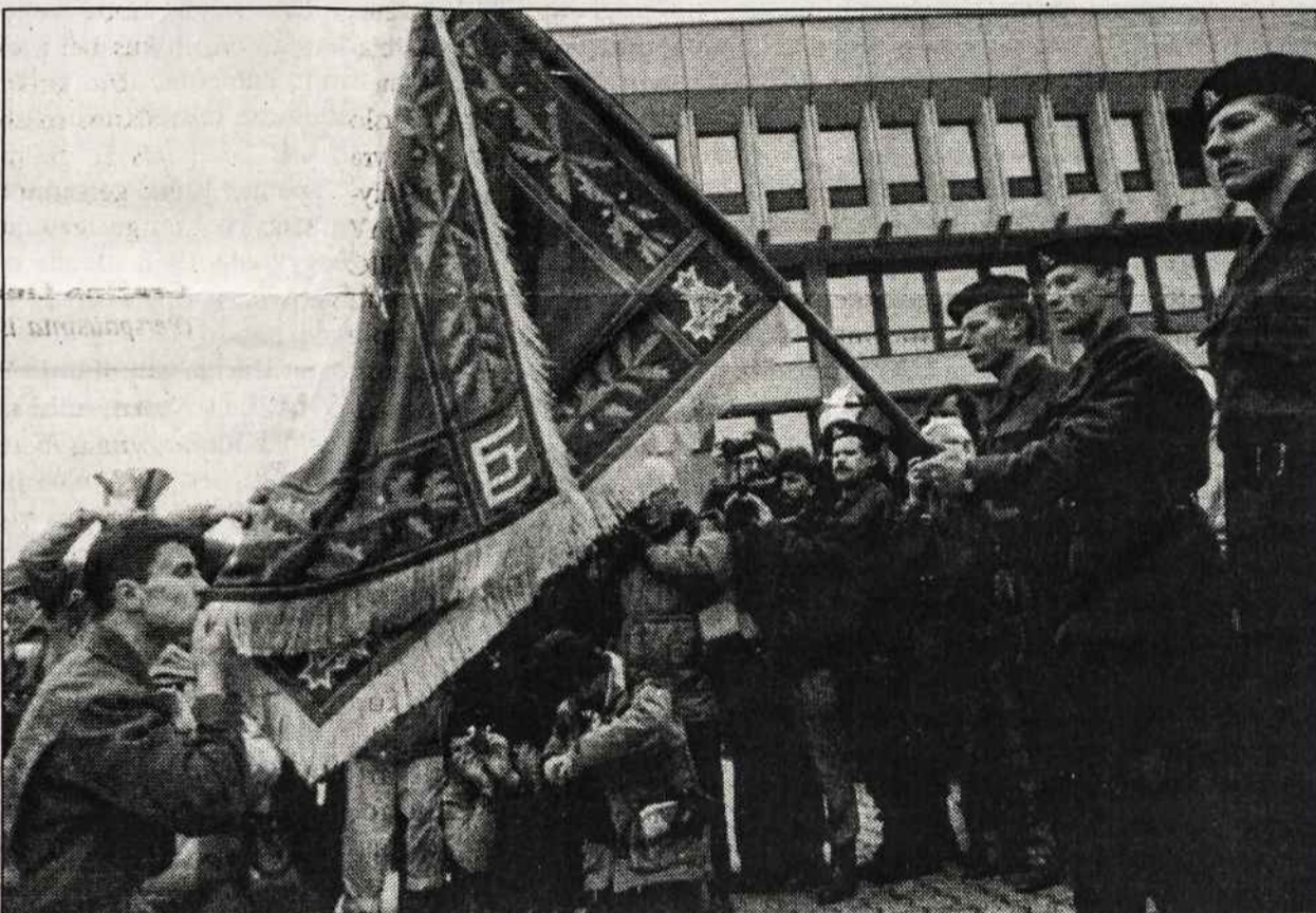
1991 m. Kovo 11-ąją, pirmųjų Lietuvos Nepriklausomybės atstatymo metinių progą, Lietuvos savanoriai duoda priesaiką.