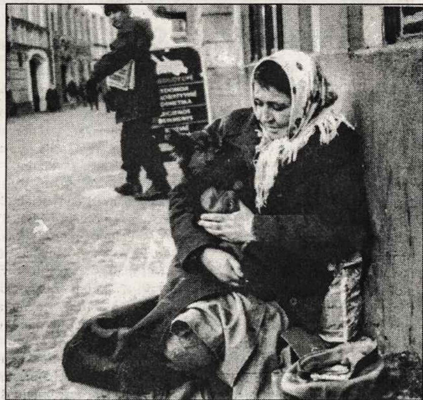
Vilniuje, Pilies gatvėje moteris su šuneliu prašo išmaldos.

Kas gali imtis tos reikšmingos iniciatyvos? Jei neklystu, dar tebegyvuoja 1958 metais įsteigta Lietuvių Istorijos draugija. Tai savo paskirtimi bene artimiausia organizacija, galinti imtis iniciatyvos išleisti trečią enciklopedijos papildomą tomą. Iš gyvenimo patirties galiu pasakyti, kad aš tą trūkumą dažnokai pajuntu. Neseniai dariau pokalbį spaudai su vienu iš mūsų visuomenės viršūnė iškilusiu asmeniu. Grįžus į namus, pradėjau ieškoti platesnės biografinės informacijos. Deja, jos nebuvo, nors tam asmeniui jau artė 60 metų. Tai ne vien žurnalistine problema, bet spraga mūsų ir pasaulio kultūros istorijoje, taip išsamiai surašytoje trisdešimt septyniuose tomuose. 1773 metais pradėta leisti populiarioji "Encyclopaedia Britannica" beveik kasmet