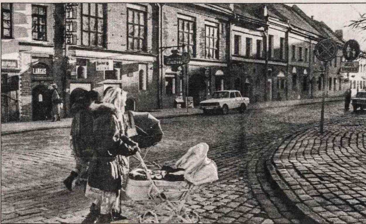
Kaunas. Rotušės aikštė.