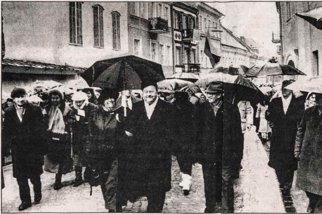
Vytautas Landsbergis su žmona eina į Vasario 16-osios šventę Vilniuje, Pilies gatvėje.