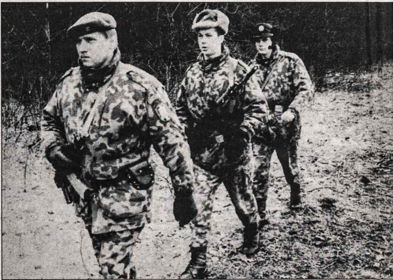
Lietuvos pasienio policijos patruliai saugo sieną su Baltarusija.