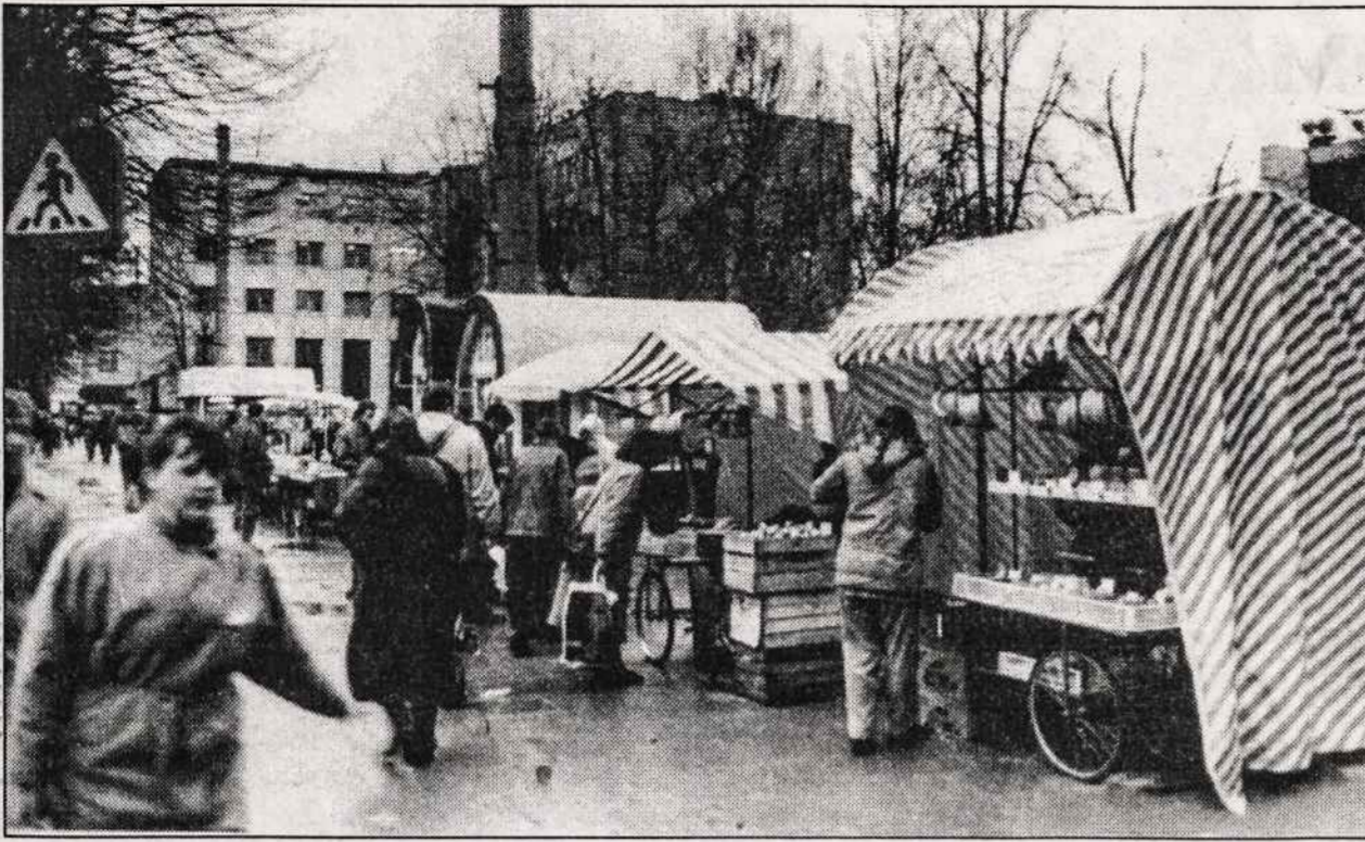
Bananų pardavėjų kioskeliai Vilniaus Gedimino prospekte.