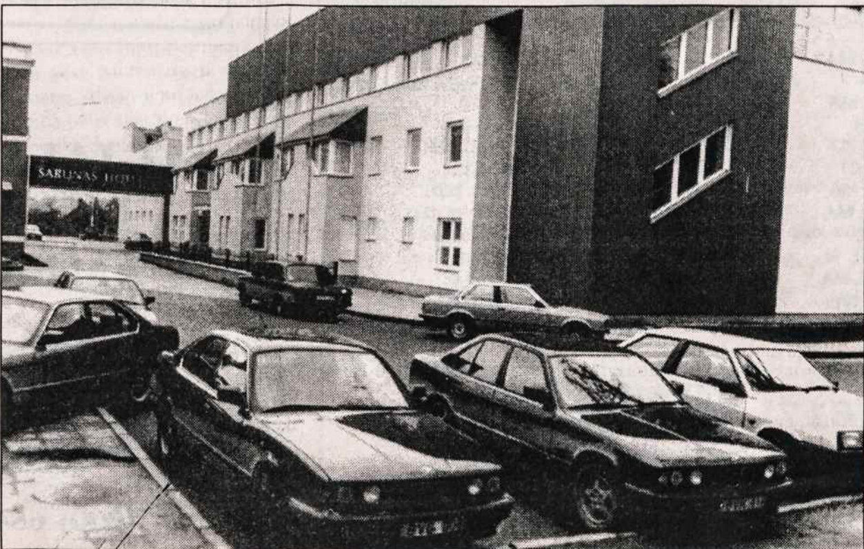
Šarūno Marčiulionio viešbutis ir sporto mokykla Vilniuje.