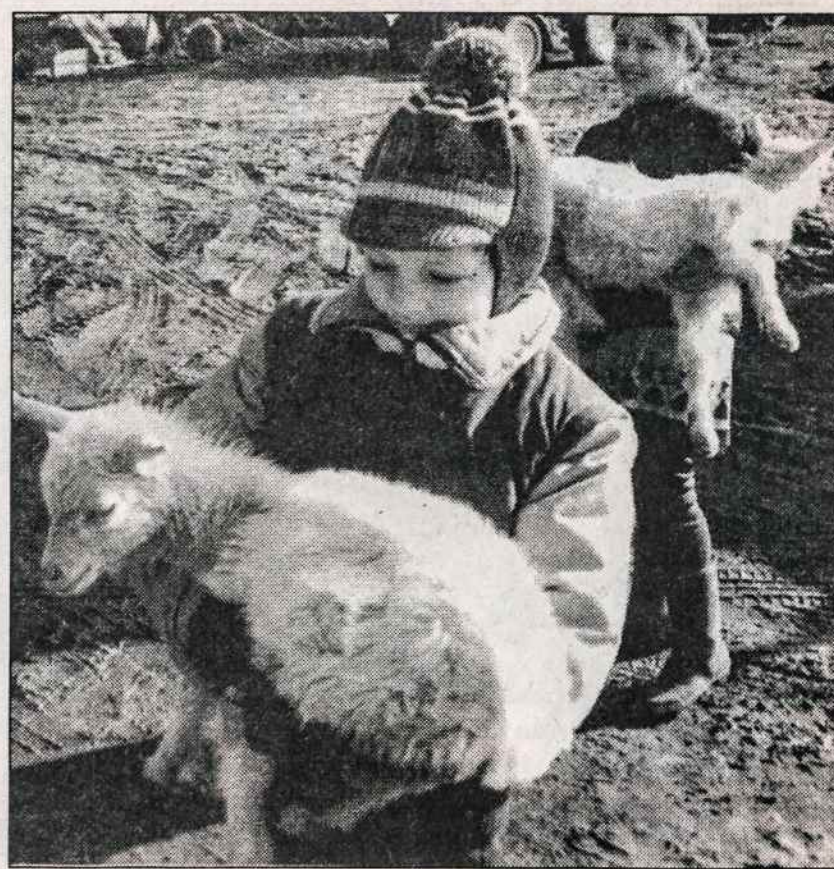
Lietuvos ūkininkų vaikučiams jau prasidėjo pavasaris - jie neša ožkytes prie pirmosios žolės.