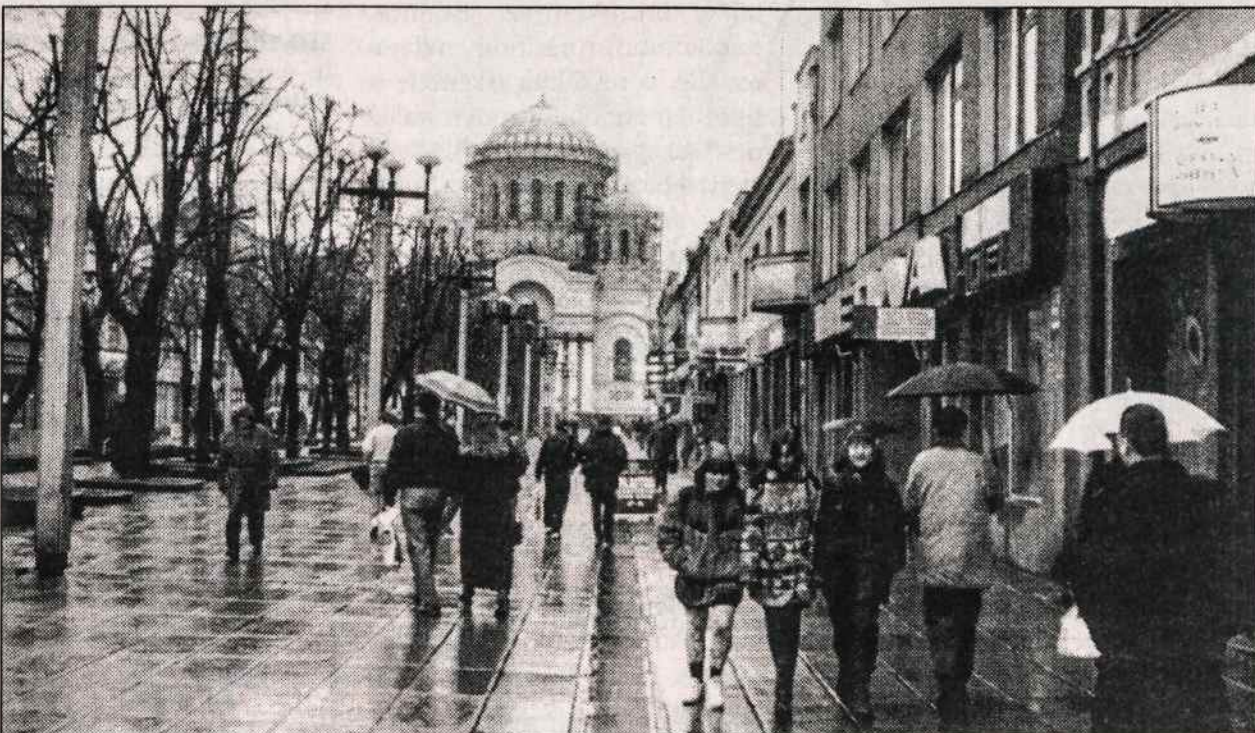
Pavasario lietus plauna Laisvės alėją Kaune.