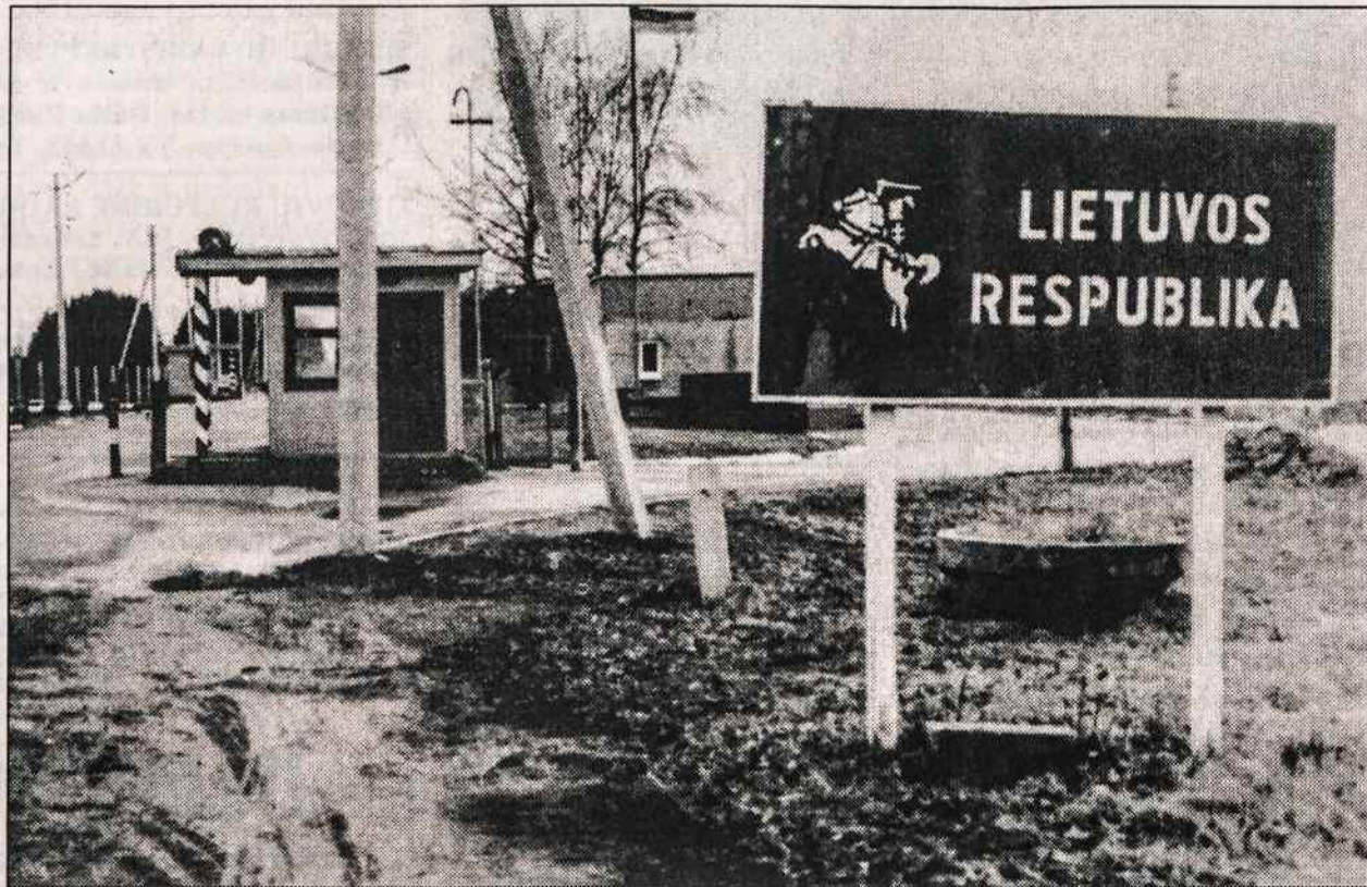
Pasienio punktas ties Medininkais šalutiniame kelyje visada tuščias.