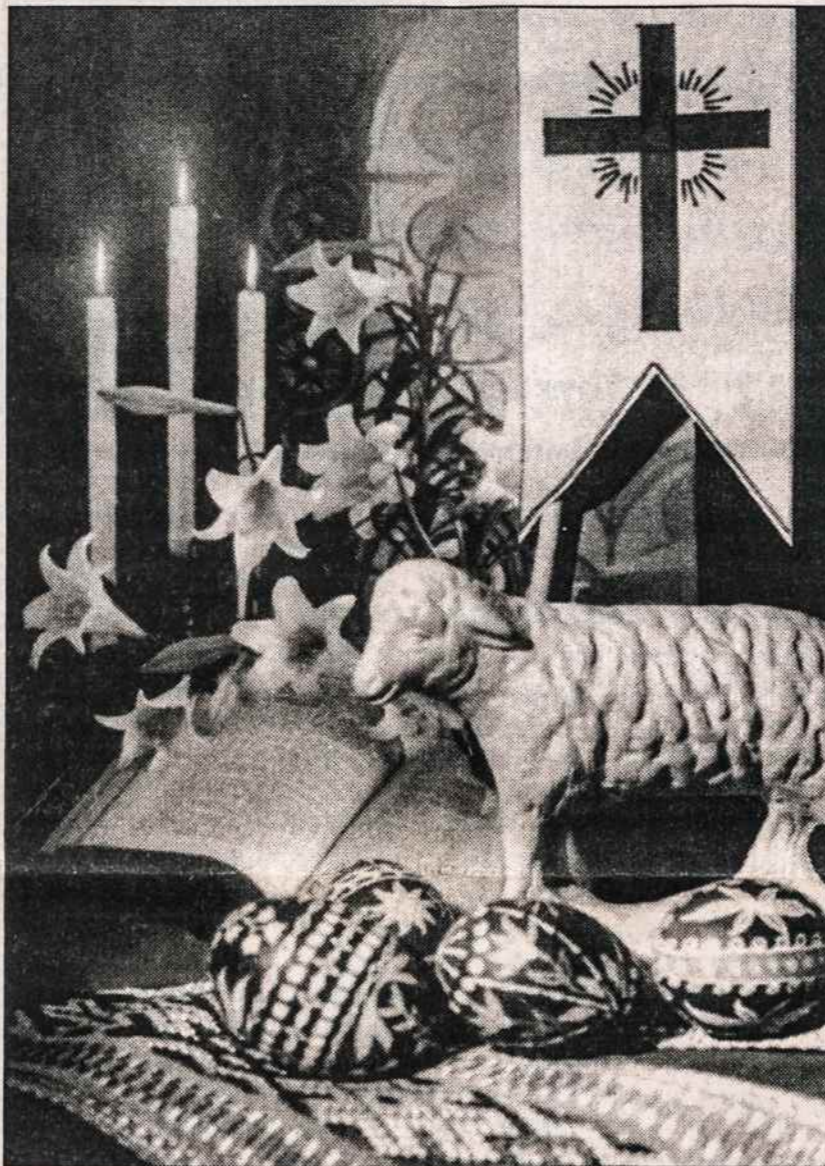
Velykinė kompozicija.

Tokia nuostata, savaime suprantama, iš karto susilaukė stiprios kritikos. Žymus istorikas Henry Chadwick pareiškė: "Bandau suprasti ir tokį požiūrį, tačiau manau, jog atvirukų siuntinėjimo vėjus organizatoriai pasirodė išmintingesni sveikinimuose ir raginimuose įkomponuodami bent mažą kryželį. Jeigu iš velykinių sveikinimų išmesime kryžių ir kitus vadinamus senus krikščioniškus simbolius, tai kas gi beliks? Kažin ar pasiteisins: