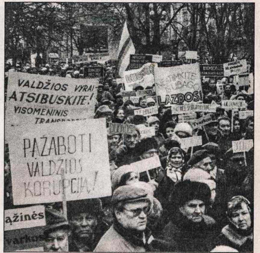
Akcijoje "Darbo, duonos, teisingumo" kovo 16 d. Vilniaus Savivaldybės aikštėje dalyvavo tūkstančiai žmonių.

Lietuvos Tautininkų Sąjunga nutarė dalyvauti 11 rinkimų apygardų. Dar dešimtyje apygardų LTS sudaro bendras koalicijas su dešiniųjų partijų atstovais. Lietuvos kalinių ir tremtinių sąjunga kėlė kandidatus 25-iose (mukelta į 2 psl.)