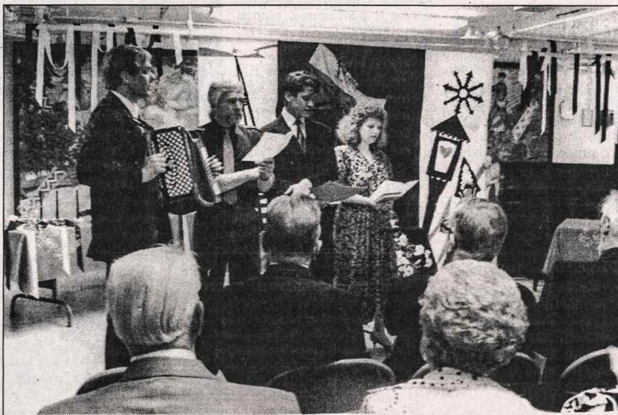
Apreiškimo parapijos bažnyčios salėje birželio 18 dieną įvyko Gedulo ir Vilties dienos - tragiškojo birželio minėjimas. Meninė programos dalį atlieka apylinkės "Versmė" nariai.

Kultūros Židinyje birželio 27, antradienį, 8 v. v. įvyko Vilniaus vyrų choro "Vytis" kon- certas. Į Lietuvą choras išvyko birželio 28 d.