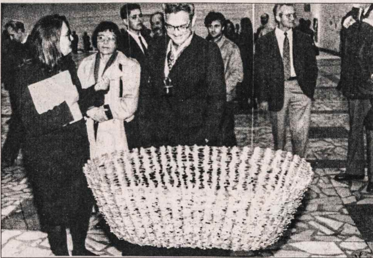
Žinomas filantropas, Lietuvai paaukojęs daugiau nei 12 milijonų dolerių, George Soros atidaro Šiuolaikinio meno centre parodą.

Po to New Yorko arkivyskupo rezidencijoje Jonas Paulius II susitiko su kitų krikščioniškų Bažnyčių, bažnytinių bendrijų bei musulmonų religiniais vadovais. Susitikimas buvo neformalus, jis vyko pokalbio pavidalu. Po šio susitikimo ir trumpo poilsio Popiežius taip pat neformaliai susitiko ir kalbėjosi su žydų bendruomenės nariais.