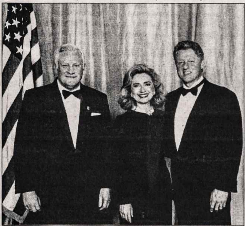
Lietuvos prezidentas Algirdas Brazauskas, JAV prezidentas Bill Clinton ir jo žmona Hillary š.m. spalio 22 dieną New Yorko viešojoje bibliotekoje, kai ten buvo surengtas priėmimas.