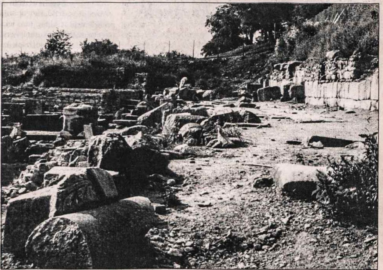
Filipai. Senamiesčio likučiai.

Lukas, aprašydamas Lidijos atsivertimą, parodo savo meniškumą ir jautrumą Dievo malonei. "... [Lidija] ėmė klausytis ir Viešpats atvėrė jos širdį Pauliaus žodžiams" (Apd 16, 14). Lidija buvo protinga moteris. Versdamasi prekyba, ji žinojo, kad svarbu gerai apsigalvoti. Bet šiuo atveju, ji neabejojo. Lidija įtikėjo, - ji ir visa jos