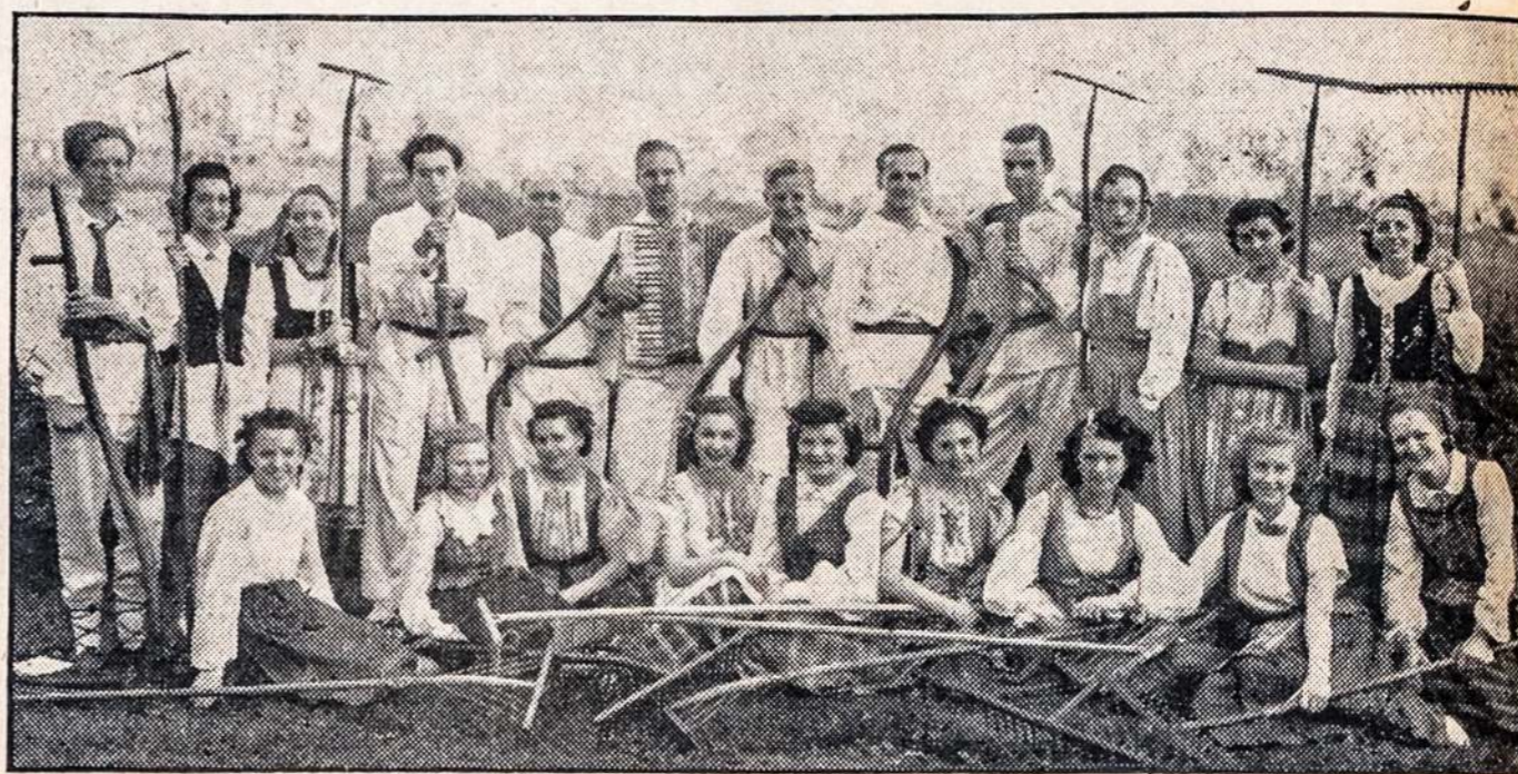
Tik vienas pasirodymas Clevelande — Vieną Dieną!

Vienatinė Vietinė Pastovi Lietuviška Real Estate ir Apdraudos Agentura 6606 Superior Ave. Cleveland HENDERSON 6729