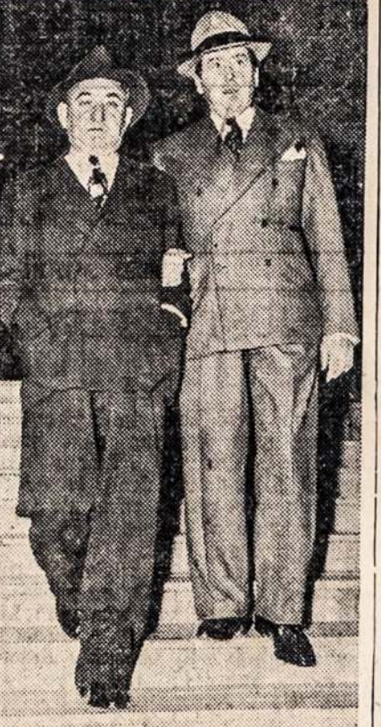
J. M. Schenk, (left) board chairman of Twentieth-Century Fox film corporation, leaving the federal court in New York with his lawyer, after being found guilty of income tax evasion. He faces a possible sentence of 10 years in jail and $20,000 fine.

J. M. Schenk (kairėje), tarvybos pirmininkas Twentieth Century-Fox filmų korporacijos, rastas kaltu vengime mokesčių valdžiai taksu. Jam gresia 10 metų kalėjimo ir apie $20,000 pabaudos.