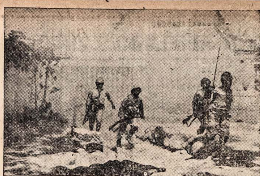
This remarkable photograph, one of the most vivid to come out of the Sino-Japanese war zone...