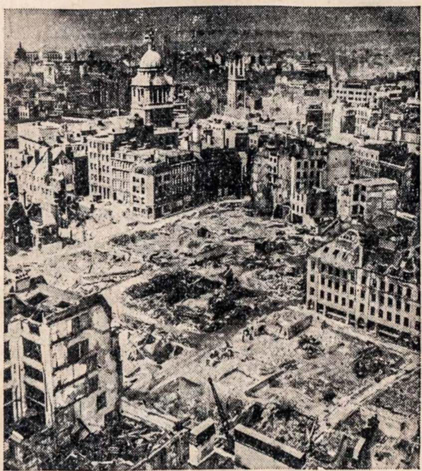
This photograph, just released by the British censor, shows some of the devastated sections in the great business center of London after air raid clearance work. An entire block of demolished buildings has been completely removed, leaving nothing but vacant lots, as shown in the picture. Hardly a building escaped damage.

Milijonas Lenkų darbininkų tapo išsiųsta į Vokietiją ir išmėtyta po dirbtuves, o kitas pusantro milijono kaimiečių ir amatininkų išvaryta iš vakrinųjų provincijų (Vokiškų plotų) į vidurinę Lenkiją, kur pastatyti dirbti ant kelių, geležinkelinių ir tvirtovių statymo.