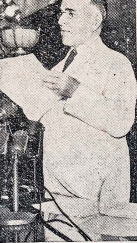
Getulio Vargas, Brazilijos prezidentas, parodoma skelbimas Vokietijai ir Italijai kara, po nuskandinimo penkių Brazilijos laivų, su kuriais buvo 600 žmonių. Tai pirmą Pietų Amerikos šalis įstojanti į šį karą.