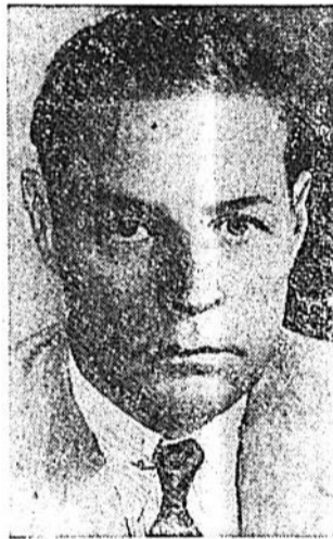
Charles E. Bohlen, naujas JAV atstovas Rusijoje.

Kad Bohlenas tikrai pažįsta sovietų psichologiją ir žino, kad