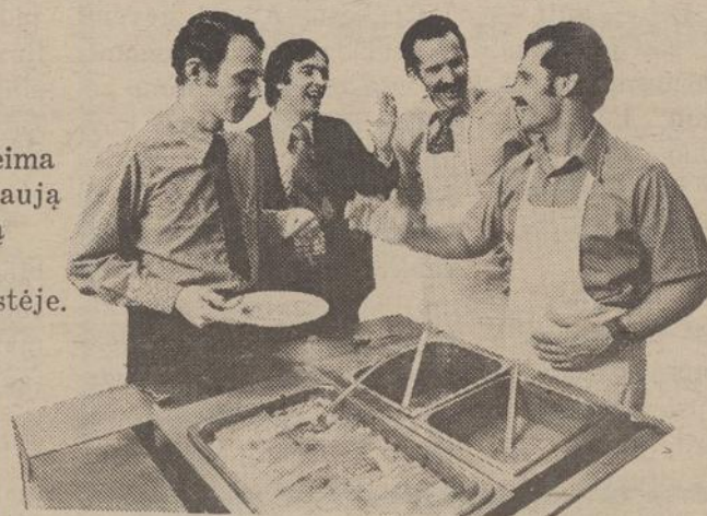
Loizos šeima atidarė naują restoraną senoje kaimynystėje.