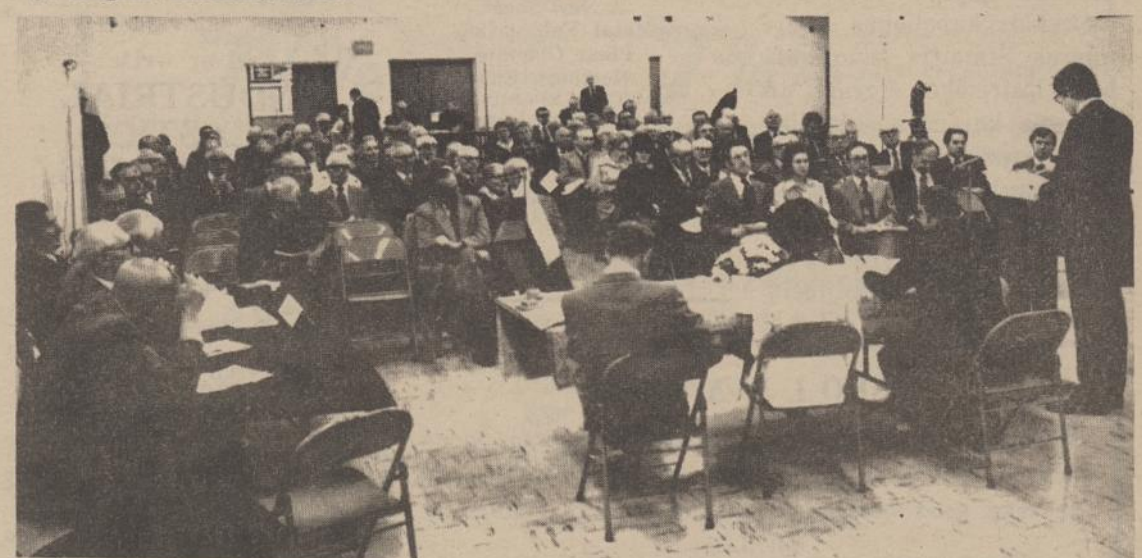
Lietuvių Fondo 1978. V. 6 XV narių suvažiavimo Chicagoje, Jaunimo Centre, atstovai, kurių buvo 122, turėdami 3686 balsus.

Iš mokyklų vadovybių išgirdome, kad dalis tų pačių abiturientų, pagilinę žinias Pedagoginiame Lituanistikos institute, grįžta į savo mokyklas jau kaip mokytojai. Kas metai jaunųjų mokytojų skaičius vis didėja ir mokytojų kadrą jaunėja.