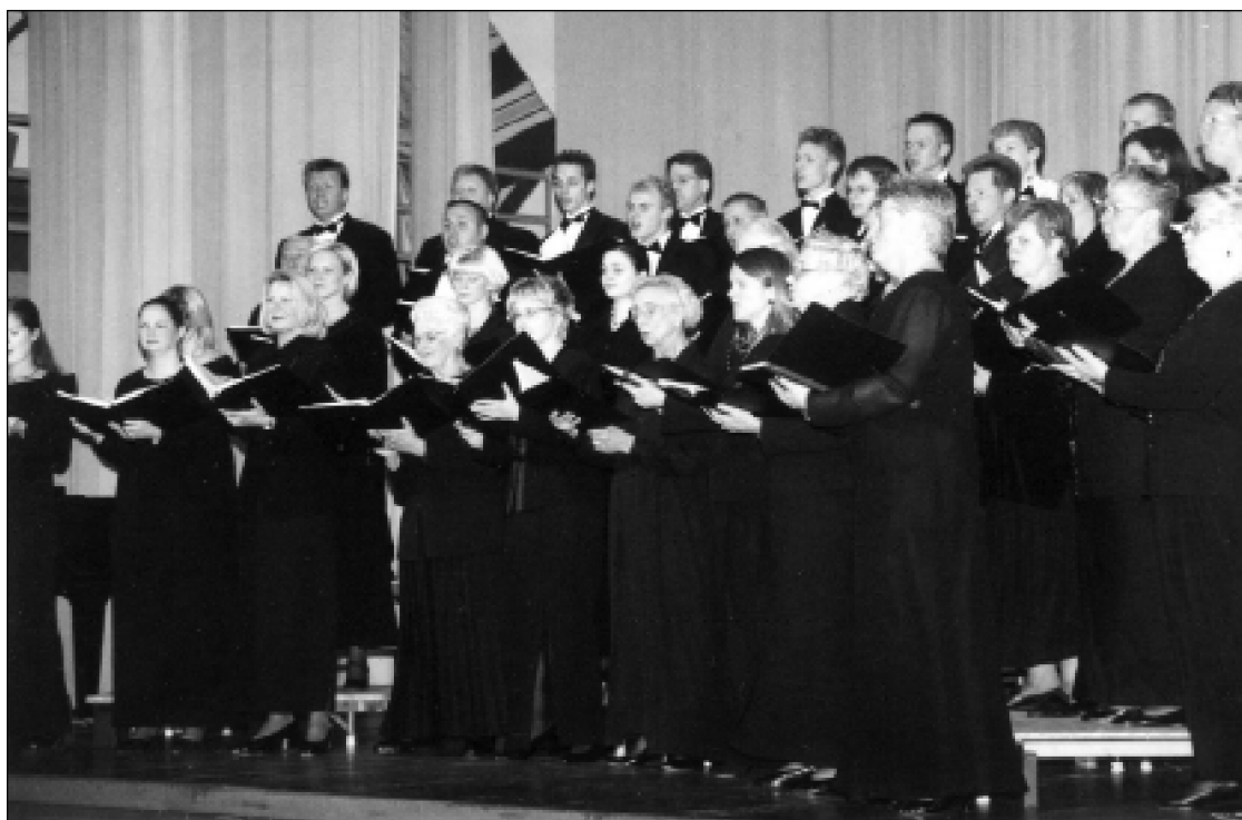
Lietuvių dienose Clevelande puikiu koncertu visus pradžiugino Lietuvių Meno Ansamblis "Dainava".

Iš anksto dėkingi, Vilties draugija - Dirvos leidėjai