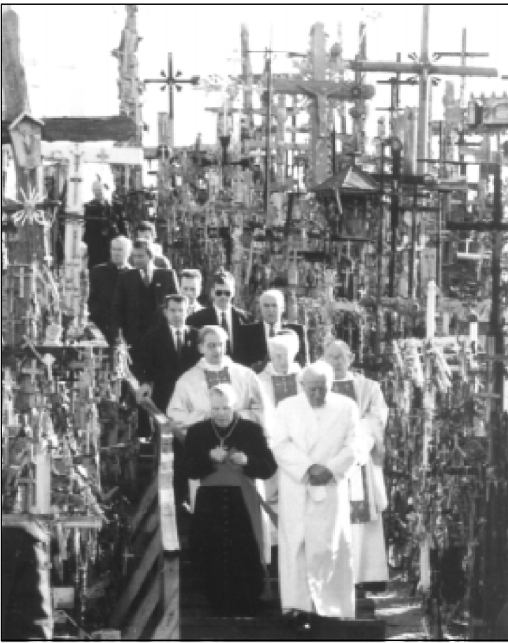
Pirmą kartą Lietuvos istorijoje Katalikų Bažnyčios Popiežius Jonas Paulius II, lydimas kardinolo Vincento Sladkevičiaus ir kitų vyskupų, 1993 m. rugsėjo mėn. aplankė ir Kryžių kalną.