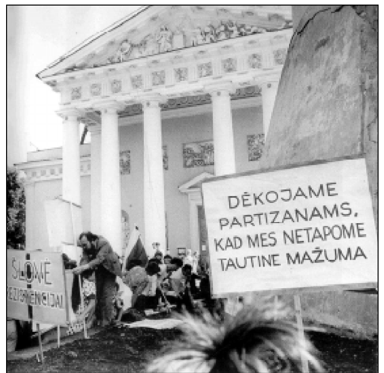
Molotovo-Ribentropo pakto 50-ųjų metinių minėjimas prie Katedros. Vilnius, 1989.08.22.

Nepasisėkė rasti dokumentų, kada tuometiniai LKP CK vadai, vidaus reikalų ministras