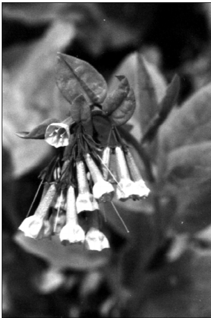
Virginijos mėlyni varpeliai (Virginia bluebell - Mertensia ) klesti pamiškėse ir pievose.