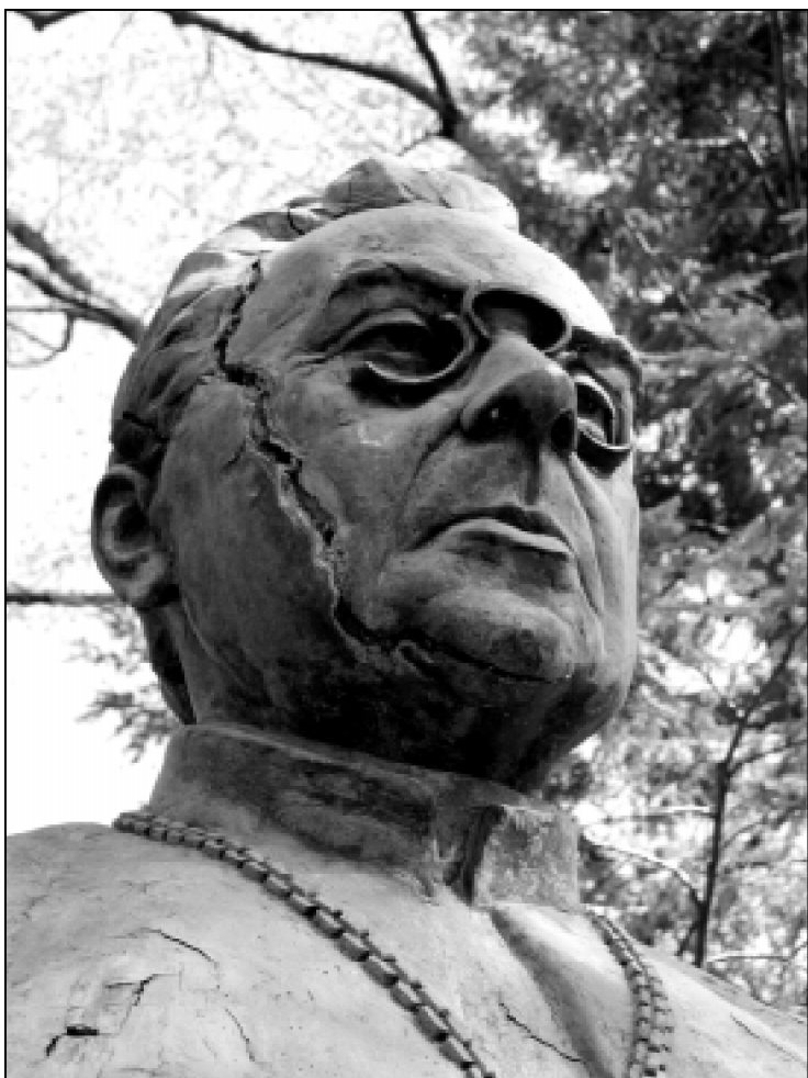
Maironio (1862 - 1932) biusto detalė su prieš daug metų padarytu nuostoliu nežinomų vandalų, kuris yra Lietuvių kultūriniame darželyje Cleveland, Oh.