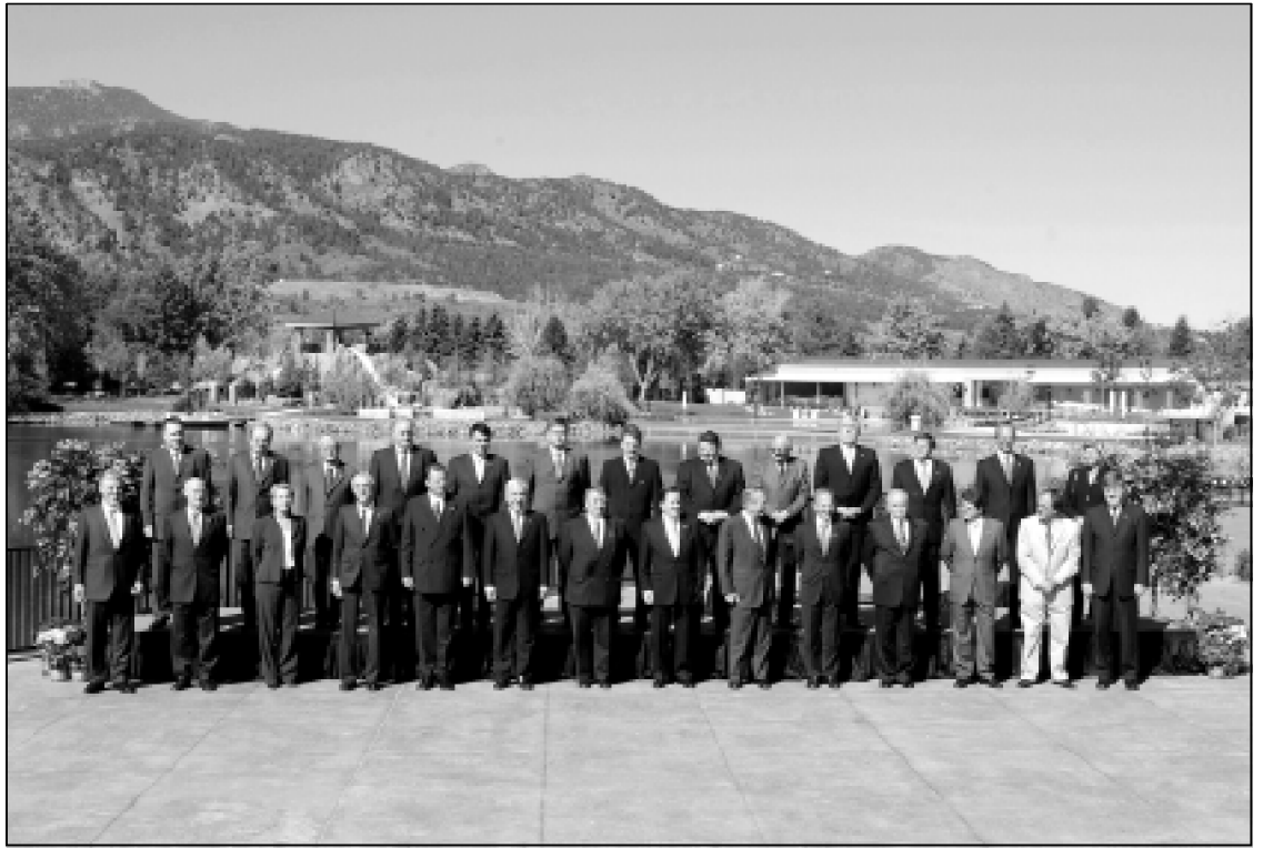
NATO valstybių gynybos ministrai neformaliame pasitarime Colorado Springs spalio 9 d. Antroje eilėje viduryje stovi Estijos min. Margus Hanson, Latvijos min. Girts Valdis Kristovskis, Lietuvos min. Linas Linkevičius ir kiti ministrai.

Prezidentas R. Paksas sveikinime rašo su malonumu prisimenąs spalio pradžioje įvykusį susitikimą su Jo Šventenybe popiežiumi Jonu Pauliumi II Vatikane. Valstybės vadovas išreiškė viltį, kad sėkmingas Lietuvos ir Šventojo Sosto bendradarbiavimas ir toliau bus plėtojamas bei stiprinamas. Prezidentas užtikrina, jog Lietuva bus ištikima popiežiaus puoselėjamų žmogiškųjų vertybių gynėja ir puoselėtoja.