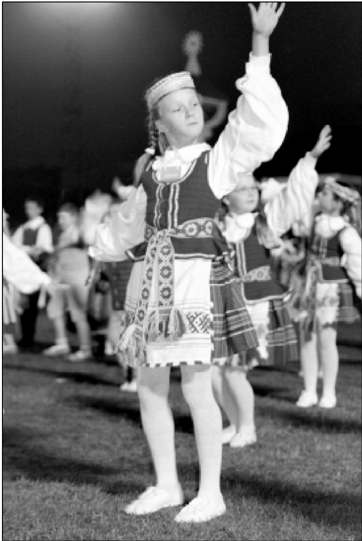
Mažoji lietuvė šokėjė Šokių dienoje "Gyvybės žalias medis" Pasaulio lietuvių šventėje.