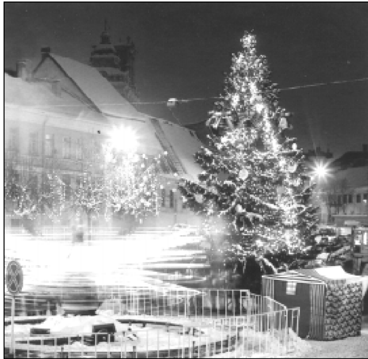
Kalėdinė eglė Lietuvos sostinėje, Rotušės aikštėje.