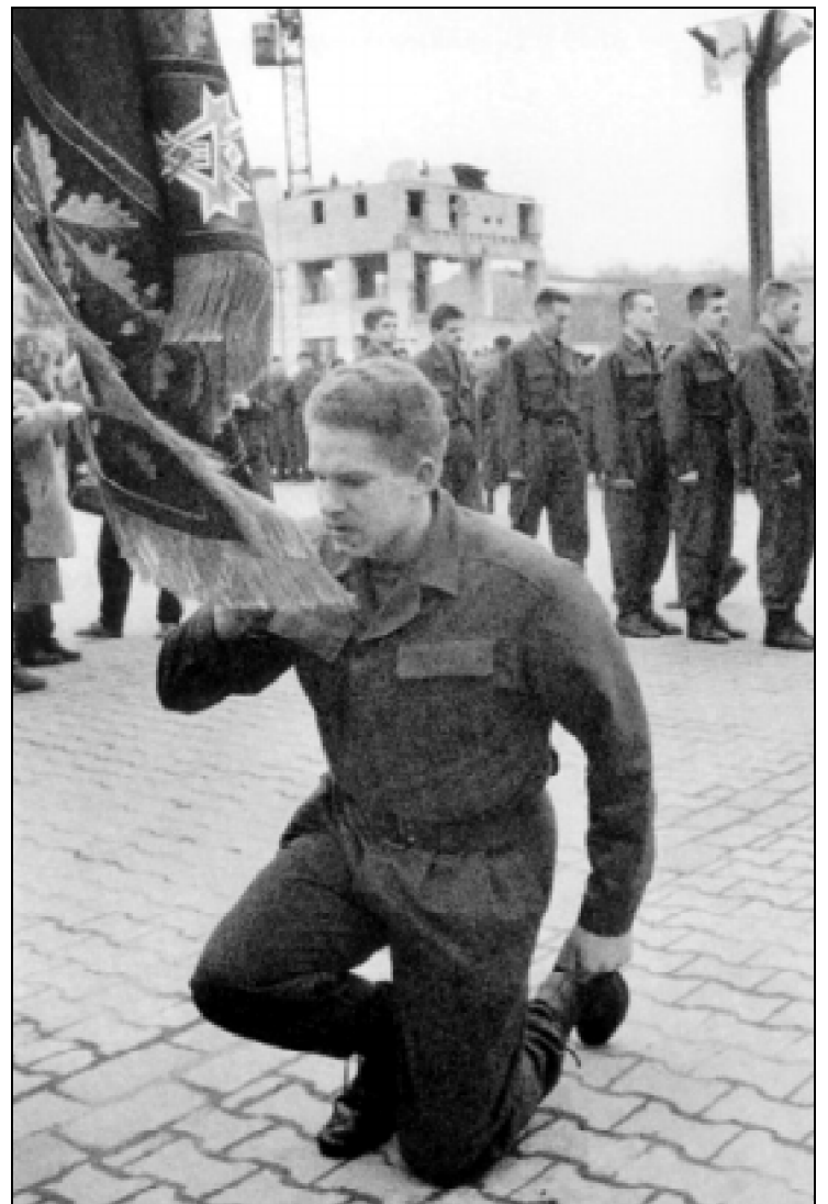
Priesaika. Savanorių eisena prie Aukščiausiosios Tarybos. Vilnius, 1991.03.11.

prieš "pertvarką", - neteko girdėti, kad kuri nors būtų apsvarsčiusi ir anksčiau minėto LKP CK plenumo nutarimą, o tuo labiau išreiškusi viešą pritarimą jam. (Bus daugiau)