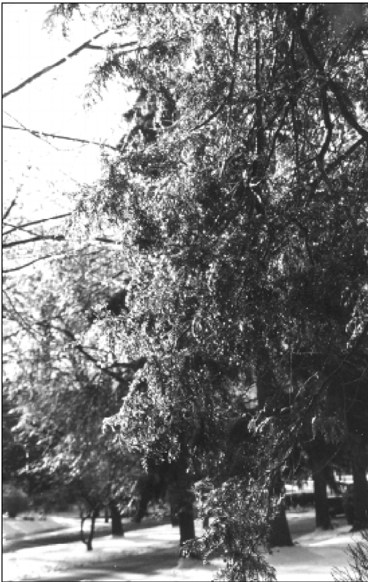
Žiemos deimantai prie Washington Blvd. (Clev.Hts, Oh).