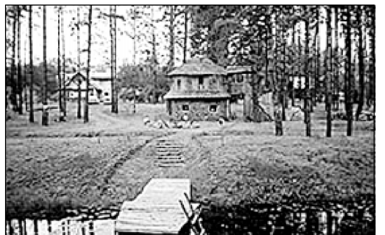
Vaclavo Židonio etnografinė sodyba Anykščių rajone pritaikyta kaimo turizmui.

A. Lukoševičius priminė, kad šiemet spalio mėnesį buvo priimtos Turizmo įstatymo pataisos, kuriomis kaimo turizmo bei nakvynės ir pusryčių paslaugos priskirtos specialaus tipo apgyvendinimo paslaugoms. Todėl kaimo turizmo paslaugų teikėjai galės naudotis 5 procentų lengvatiniu pridėtinės vertės mokesčio tarifu.